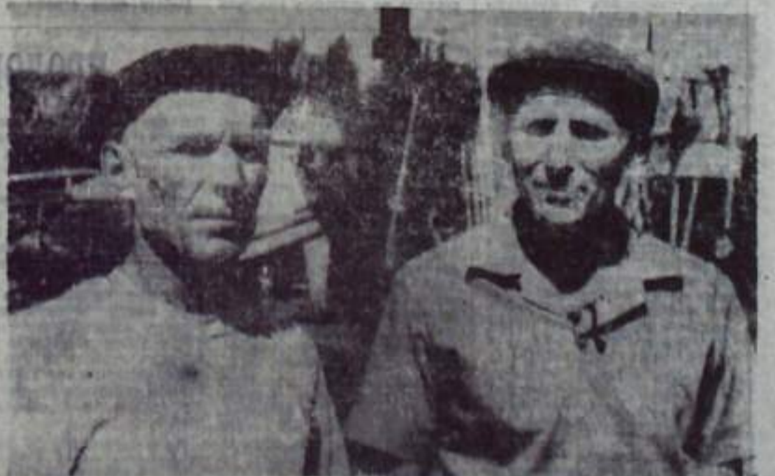
Заготовка кормов — ключевая задача

стического соревнования по итогам работы затеяла смена мастера-пекаря Н. Иванова. С любовью и сиюминутной душой пекаря Х. Иванова, Н. Фаткуллина, Л. Станкина, Л. Юрлова, Е. Осиповичева. Может быть, потому хлеб выпеченный на этом комбинате так вкусен и ароматен. Н. ФИРСОВ, рабкор.