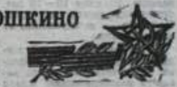
был награжден орденом Ленина.

Указом Президиума Верховного Совета СССР от 10 апреля 1945 года полковник Николай Константинович Дмитриев