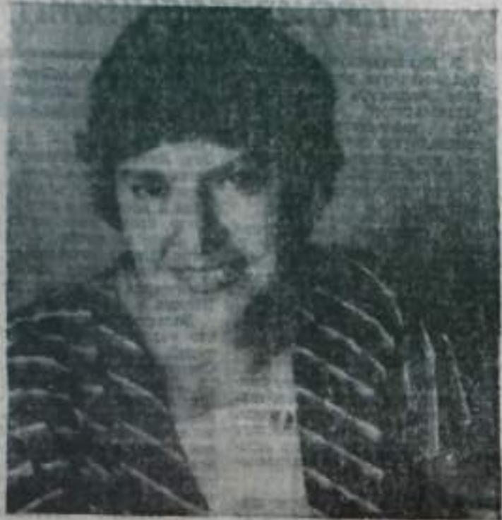
Депутат городского Совета

ходимых условий и завершаться овладением учащимися одной из профессий. Как знания, упоминается профессия, но она будет даваться, если есть условия. А если нет условий, то опять будет академическая школа. Время до Всероссийского съезда учителям достаточно. Учебный год закончился, есть над чем подумать, чтобы реформа двигалась вперед, выявить все механизмы торможения, чтобы на съезде был выработан прием, с малой оценой на вопрос усовершенствования этого требует партии. Л. ЯПРЫНЦЕВ, учитель истории школы рабочей молодежи № 1.