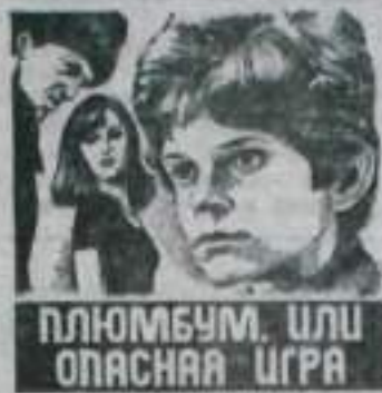
ПЛЮМБУМ, ИЛИ ОПАСНАЯ ИГРА