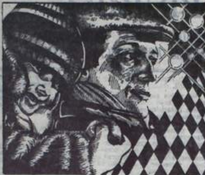
МОЙ ЛЮБИМЫЙ КЛОУН

род». В «Крике дельфина» режиссер впервые обращается к жанру политической фантастики. Основные события фильма разворачиваются на территории подводной лодки «Архело», принадлежащей военно-морским силам одной из западных держав. В главной роли сыграл хорошо знакомый зрителям актер кино Ивар Калльвич. В фильме встретитесь с популярными актерами Арменом Джигарханяном, Донатосом Банюнисом.