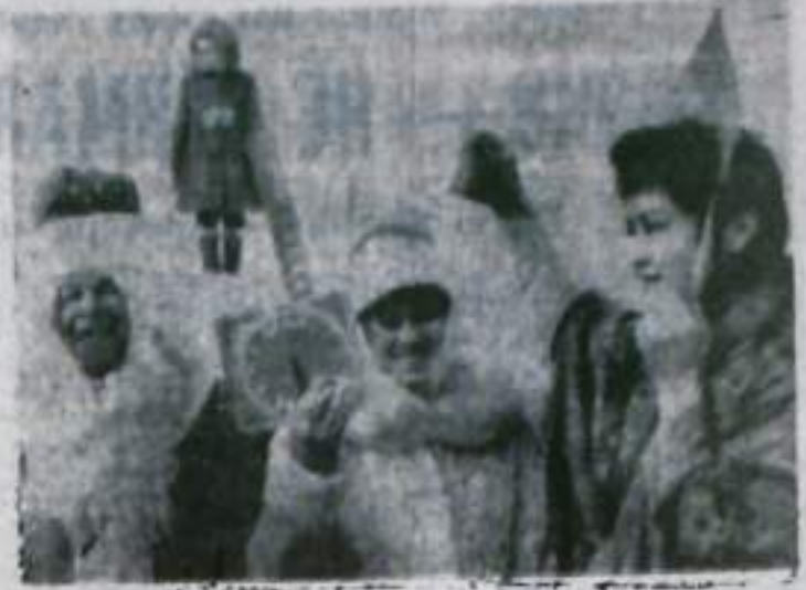
Режиссер Э. Ю. ТАГИРОВ