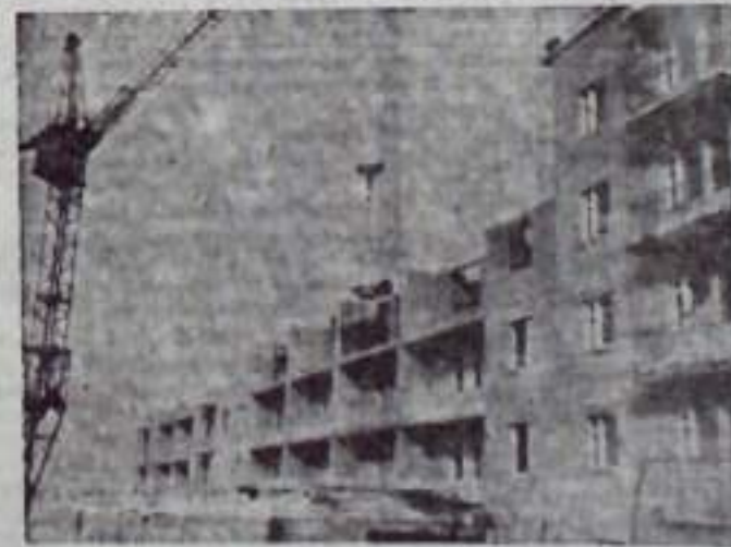
Фото и текст Н. МАИОРОВОЙ.

На снимках: В. Ким; идет строительство дома.