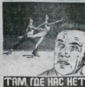
ТАМ, ГДЕ НАС НЕТ

обладание. Автор сценария — Борис Рахманин, режиссер — Геннадий Гагюлев, снявший фильмы «Крупный разговор» и «Разбег».