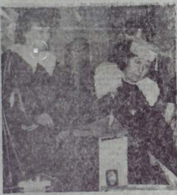
КОНКУРС «ЗНАКОМСТВО», КОГО МОГУТ ПРЕДСТАВИТЬ МАГН И ВОЛШЕВНИКИ? КОНЕЧНО, ФИЗИКОВ!