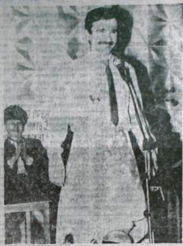
Ф. ПСАНГУЛОВ ЕСЛИ НА ЗАРПЛАТУ УЧИТЕЛЯ КУПИТЬ ПОСТРОМ, ТО НА СЛАДУ...

Не успели смолкнуть смех и аплодисменты, а уже в новом конкурсе «ситуативный марафон». Учителю представ- ляло, что ученик не пришел в школу, потому что читал книгу: какую? И что сказать ученику? Только юмор успело под-