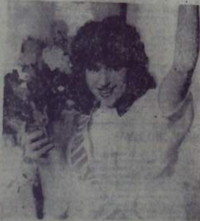
Традиционный бал выпускников средних школ города состоялся 18 июля. В добрый путь напутствовали ребят родители, папы и мамы, го родская общественность. фрагменты выпускного бала «В добрый путь!»