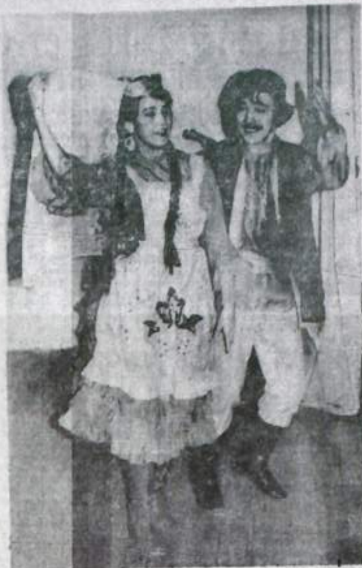
Редактор Э. Ю. ТАГИРОВ.