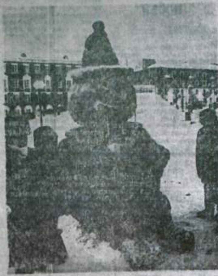
А значит, и места награды. После жаркого обсуждения первое место и премия 100 рублей досталась ученикам авиационного техникума, создавшие своего «Мишку». Второе место и про-

Програнных в этом конкурсе нет, ведь искусство есть искусство, а талантом его нетронуто — душа художника, его увлеченность. И все это конкурс,