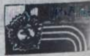
Его организовали Ишанский горный комсомолец и Федерация борьбы за мир, посвятив 70-летию ВЛКСМ.

Молодые звезды нашего города приняли участие во Всесоюзном турнире городов.