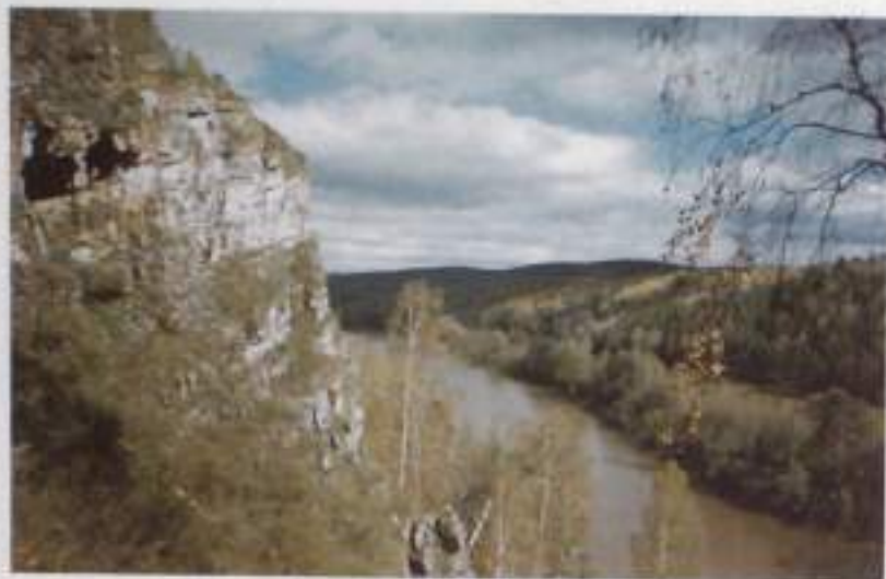
Скала, на которой Салават ловил молодых беркутов