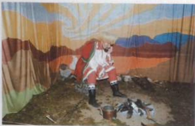
Восковая фигура «Повстанец на привале». Экспозиция из музея Салавата Юлаева в с. Малояз Салаватского района РБ