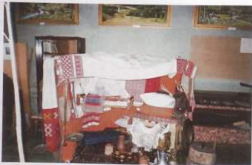
Экспозиция из школьного музея в д. Алькино, основанного Т. Загидуллиным