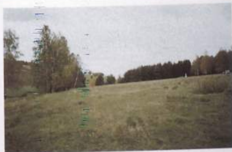
Там, где раньше была д. Текей (Иске йорт), еще видны следы Сибирского тракта, а заросли крапивы обозначают места домов