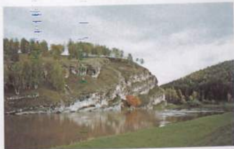
Место боя воинов С. Юлаева с карателями И. Михельсона, где в XVIII в. располагались пристань и паромная переправа