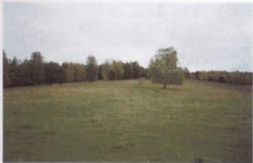
Дорога, соединяющая д. Текей с Юлай-аулом. Может быть, эта старая береза еще помнит Салавата?