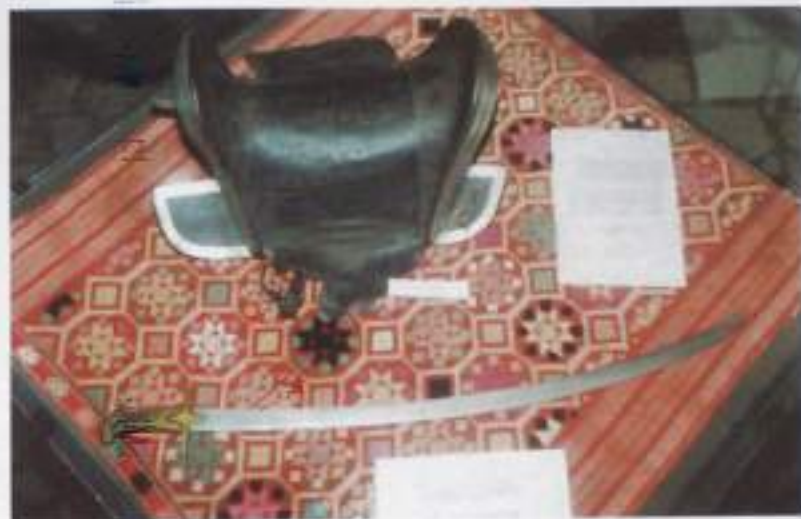
Седло и сабля Салавата Юлаева. Экспозиция из музея Салавата Юлаева в с. Малояз Салаватского района РБ