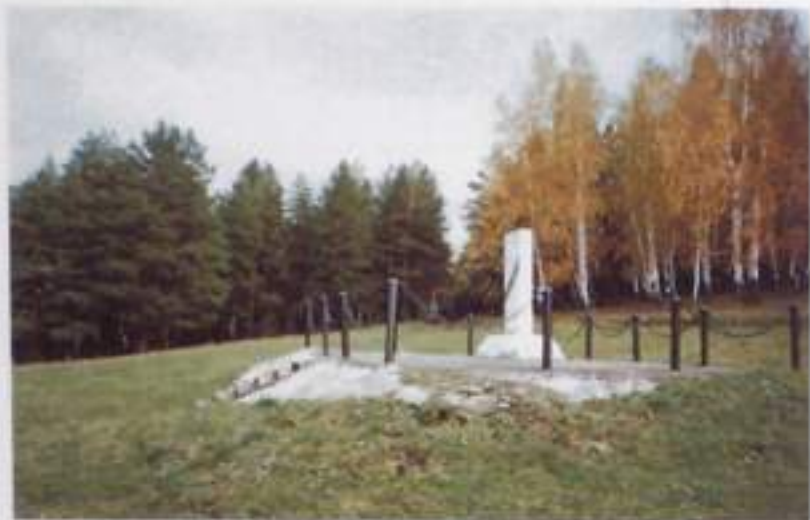
Обелиск, установленный на месте, где некогда была д. Текей