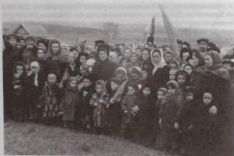
Первые юбилейные торжества, посвященные 200-летию Салавата Юлаева. Райцентр Салаватского района, 1952 г. Автор — I ряд, третий слева