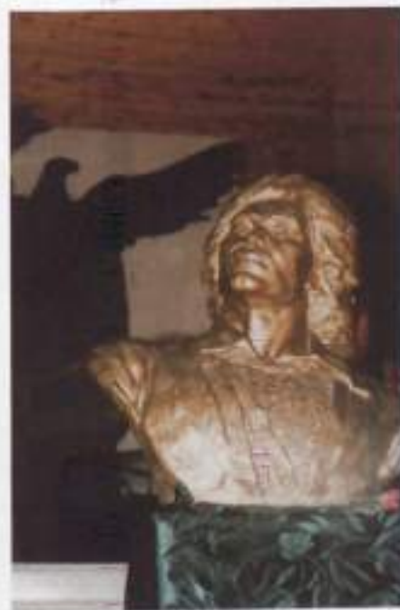
Бюст Салавата Юлаева. Скульптор Т. П. Нечаева. Бронза, 1952 г.