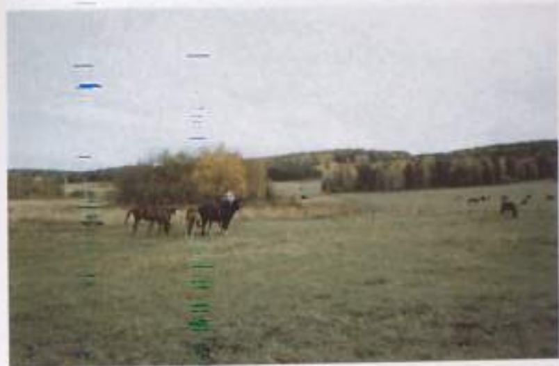
Здесь когда-то находилась д. Мурат (Мрат), основанная Муратом, братом Юлая Азмалина