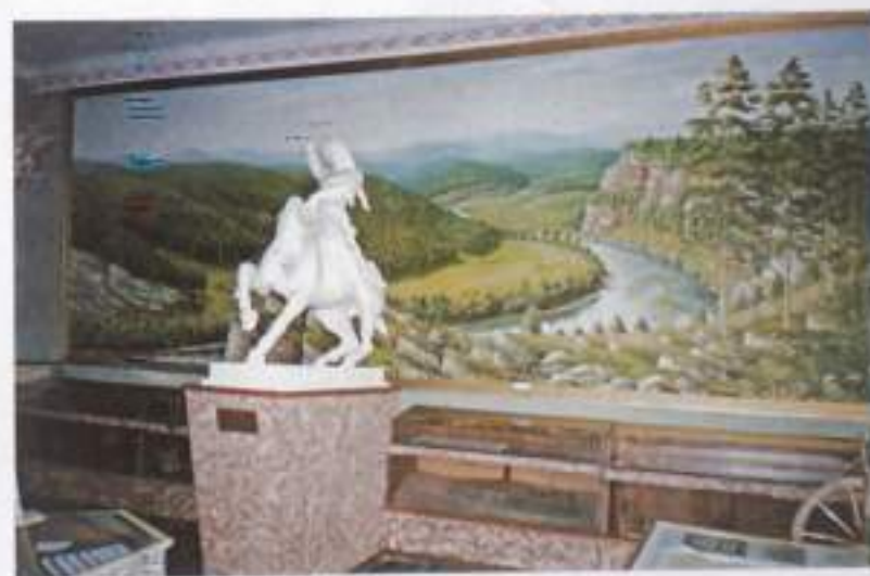
В музее Салавата Юлаева