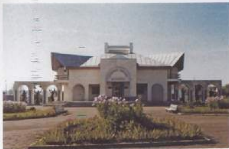
Музей Салавата Юлаева в с. Малояз Салаватского района РБ. Основан в 1991 г.