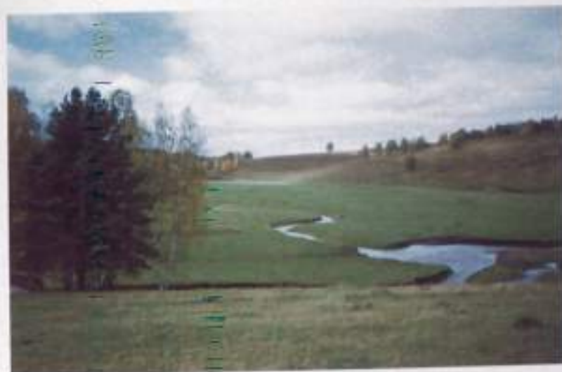
Речка Кускянды при впадении ручья Хари Кундуз. Здесь располагалась д. Текей, в которой родился Салават