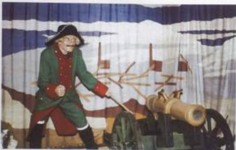
Восковая фигура «Каратель с пушкой». Экспозиция из музея Салавата Юлаева в с. Малояз Салаватского района РБ