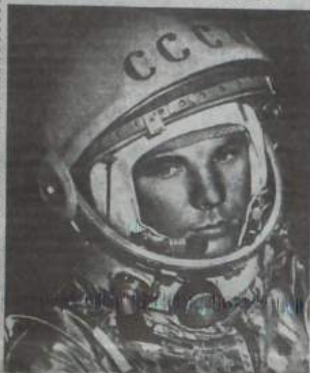
Первопроходец Вселенной Ю.А. Гагарин Апрель, 1961 г.