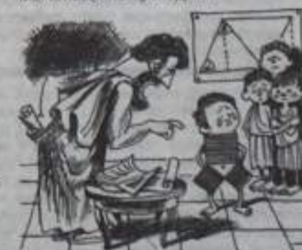
- Пифагор, что это у тебя за штаны?