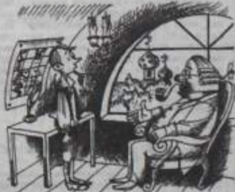
- Суворов, где же Альпы? - Мы их еще не проходили.