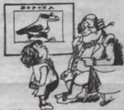
- Опять вместо урока зоологии ты, Крылов, рассказываешь нам какие-то басни!