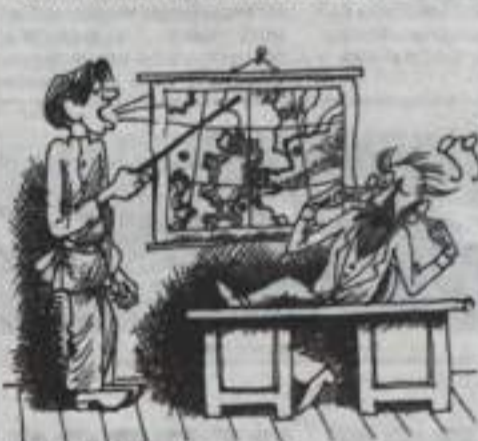
- Маяковский! Только не во весь голос!