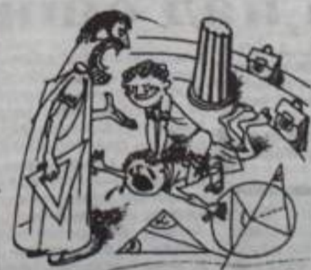
- Александр Македонский, перестаньте воевать с соседями!