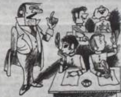
- Господа лицеисты, вы очень невнимательны на лекциях по поэтике. А отвечать за вас потом кто будет - Пушкин?