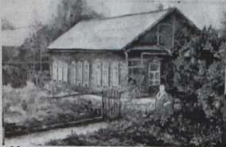
• Одаренные дети