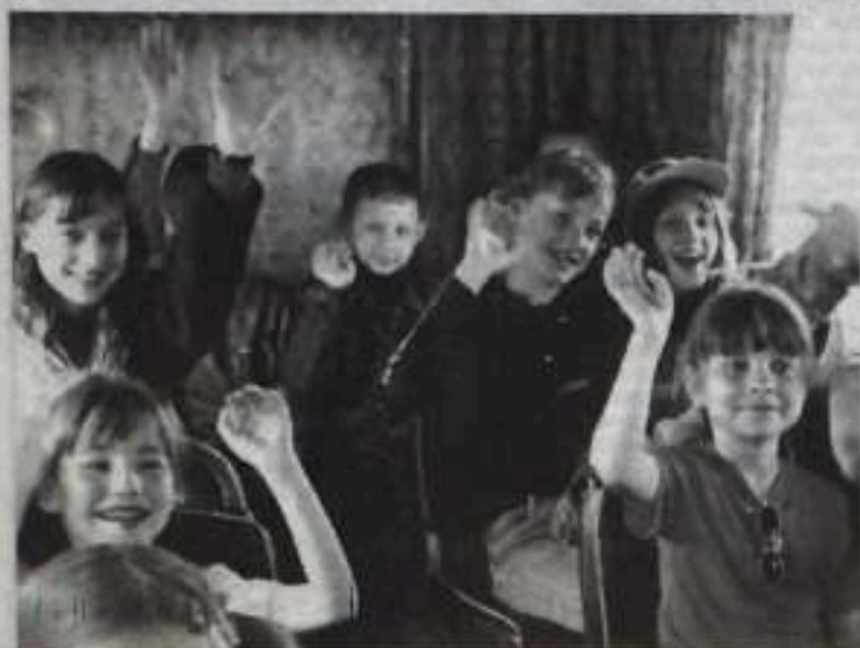
• Летний отдых детей

Общественно - политическая газета города Кумертау Республики Башкортостан