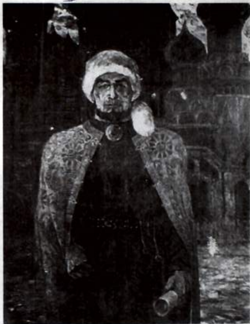
«Бөйөк Шәғәлә Шаһман». Рәссам Ринат Атауллин.

- Ошонда, Көнгәктә, 9 полк тупланған, - тип һүзен дауам итте Мөхәммәтша, Усман кулъязманы уға биргәс. - Башкорт яугирзәре тап бына Көнгәк тауы итәгендә яуга китергә фатиха ала. Каһым түрә етәкселегендәге ир-егеттәрәбез яуза һынатмай, изге тау фатихаһына тап төшөрмәй.