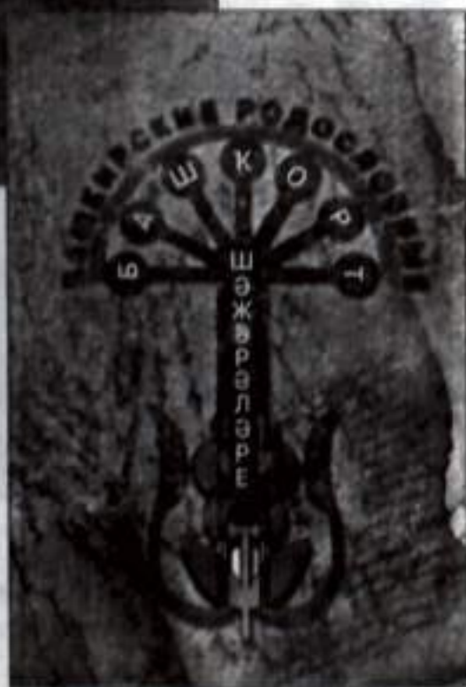
Башкорт шажаралары. «КИТАП», Өфө – 2002 й.