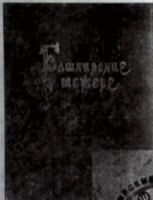
Башкорт шажаралары. Башкортостан китап нәшрияте, Өфө – 1960 й.