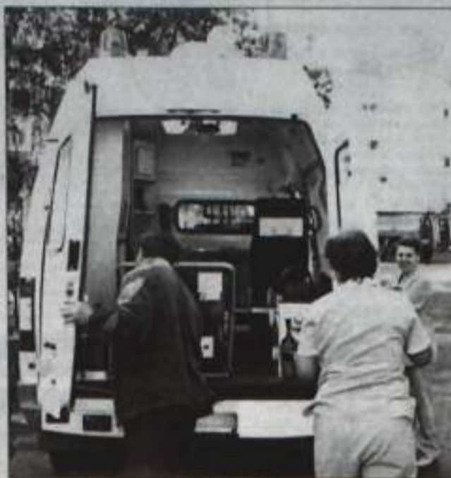
Экипаж «скорой помощи» во всеоружии.