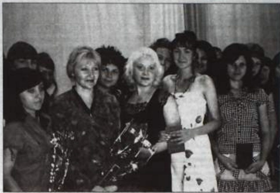
Торжественное вручение дипломов в КТЭП и КИЭП. 129 человек получили дипломы о среднем профессиональном образовании, из них 12 – «красных», и 24 юноши и девушки стали обладателями документов о высшем образовании, из них 3 – окончили институт с отличием.

пешно прошел государственную аккредитацию, которая подтвердила, что подготовка кадров здесь ведется в соответствии с государственными образовательными стандартами, и получил право выдачи дипломов государственного образца, а студенты получили право на отсрочку от призыва в ряды ВС РФ. С целью обеспечения качества подготовки специалистов в течение последних трех лет, помимо внутреннего контроля качества подготовки специалистов, студенты КИЭП регулярно проходили внешнюю экспертизу качества знаний, проводимую Национальным аккредитационным агентством Федеральной службы по надзору и контролю в сфере образования и науки РФ через участие во Всероссийском интернет-экзамене. Информационно-аналитические карты педагогических измерений свидетельствуют о том, что наши студенты показывают высокий уровень знаний по предметам.