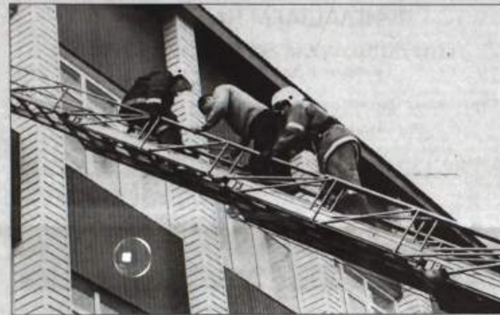
Эвакуация «больного» по пожарной лестнице.