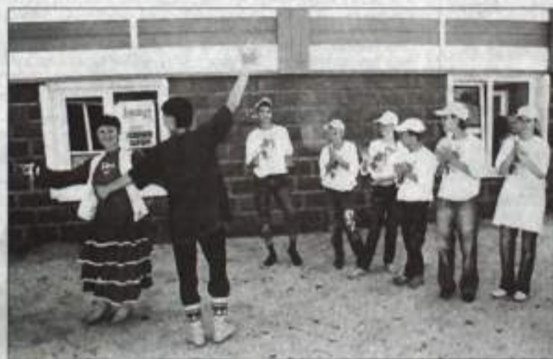
Ах, хорош башкирский танец!

тации, следует сказать, что в этой номинации первенствовало «Горное эхо». Второе место – «Ласточкино гнездо», третье – «Березка».