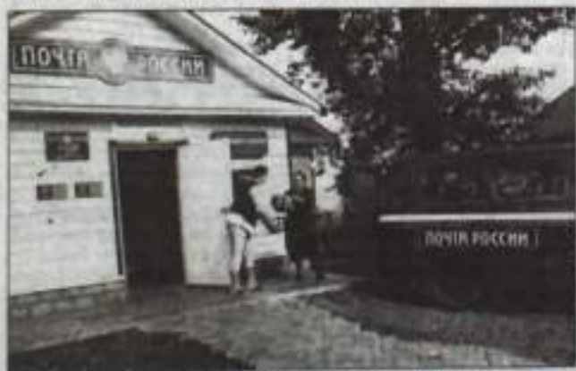
Работники почтового отделения села Маячного принимают посылки, которые пришли их односельчанам из разных уголков нашей страны.

передачи данных и предоставление доступа к сети Интернет с использованием пунктов коллективного доступа на территории Башкортостана. В прошлом году в отделениях связи республики разместили 900 точек доступа в Интернет. Федеральная программа «Электронная Россия» реализуется нашим ведомством полным ходом. Поэтому и в нашем городе все почтовые отделения оказались связанными в единую информационную сеть, что дало нам значительные конкурентные преимущества. В работе