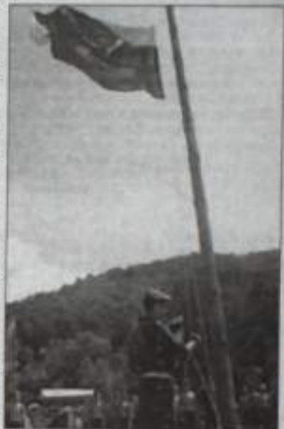
Флаг лагеря поднят.

ных мероприятий, соревнований, тактико-полевых занятий, марш-бросков, причем каждый из дней имеет свою тему. Несмотря на расписной день, всегда найдется время для досуга и отдыха, который обещает быть незабываемым.