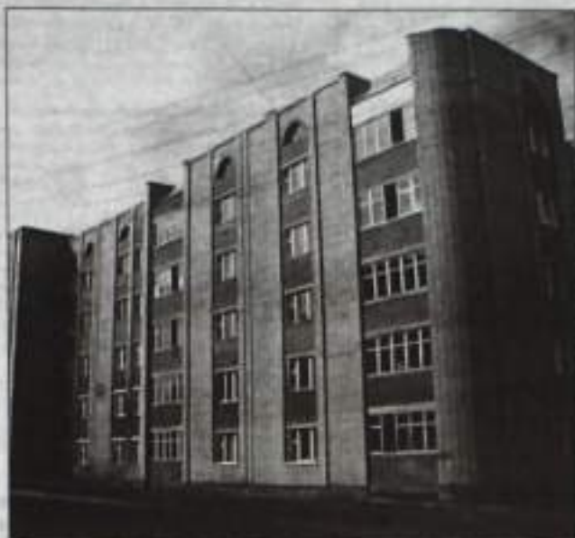
реальной компании заменить ее.

Тарифы на ЖКХ растут, а качество услуг при этом не меняется. Некоторые дома не ремонтировались даже не по 15, а по 40-50 лет. При этом новый Жилищный кодекс возложил обязанности по содержанию домов на собственников квартир. Но хроническое недофинансирование коммунальной отрасли в прежние десятилетия привело к тому, что нынешние собственники просто не в состоянии оплатить капитальный ремонт дома и уж тем более переселение из аварийного жилого фонда. Именно поэтому необходимо было изыскать дополнительные средства. Для эффективной работы по реформированию ЖКХ Президент Владимир Путин поручил создать специальный фонд, в который были перечислены бюджетные средства в размере 240 млрд. рублей. Деньги выделяются всем регионам, но лишь после выполнения властями субъекта Федерации и органами власти муниципальных образований условий, указанных в Федеральном законе «О Фонде содействия реформированию ЖКХ». Регионы должны создать условия для развития частного бизнеса в ЖКХ и создания ТСЖ, бизнес вкладывает в ЖКХ собственные средства, дома в большинстве своем будут обслуживаться не ДЭЗа и ЖЭКа, а частными управляющими компаниями, выбравшими жильцами. Это позволит собственникам самим контролировать целевое использование выделенных средств и в случае недовольства работой уп-