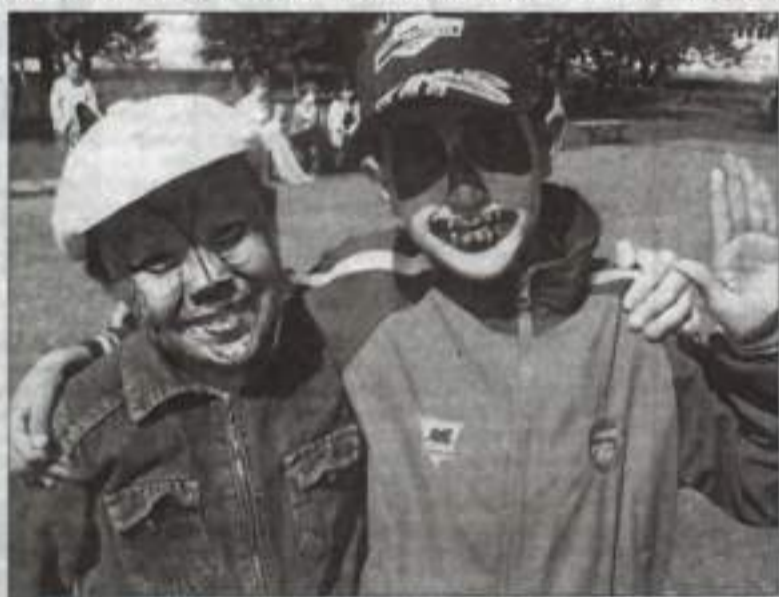
В стиле «Боди-арт».