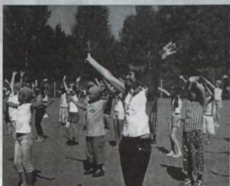
«Горное эхо»: приветствие на стадионе.