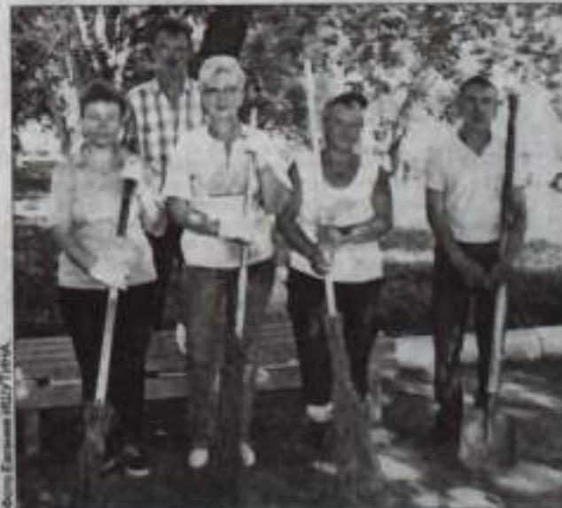
Газовики на субботнике в сквере Гафури.

После каждого из таких субботников сквер приводится в ухоженный вид: трава ровно подстрижена, деревья щедро дарят тень, прохладу и свежий воздух, столбы тополя побелены, мусор убран и вывезен, дорожки подметены. В этом чудесном зеленом уголке приятно посидеть на скамейке и отдохнуть, но работники Канчуринской станции пожаловались, что всякий раз во время субботника приходится убирать много мусора, особенно трудно подбирать с земли огромное количество окурков. Очень это обидно.