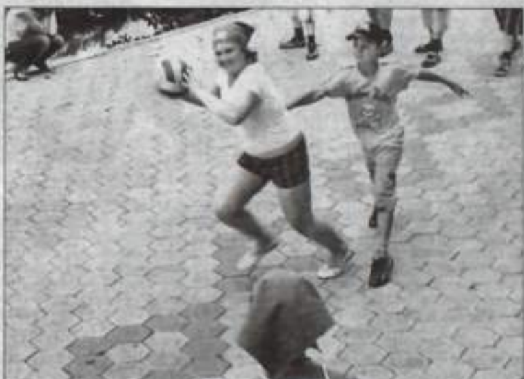
А ну-ка, отними!