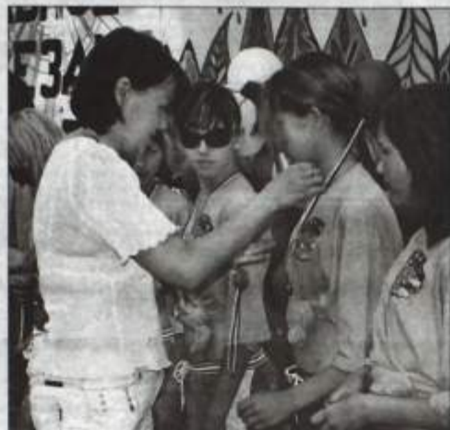
Медали – пионерболистам.