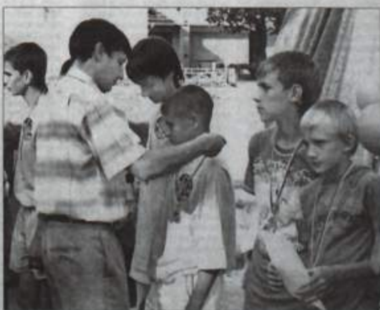
Футболисты «Зеленых дубков» победили.