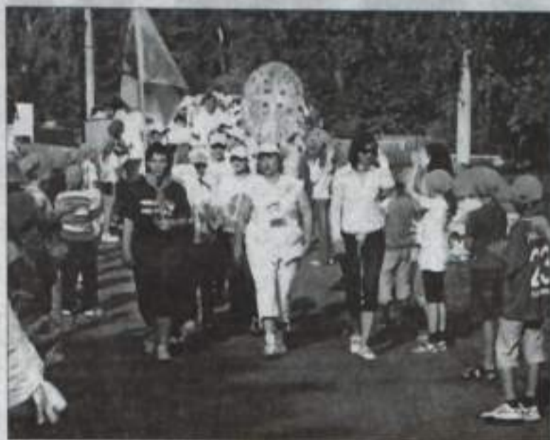
«Доброград» приветствует гостей из соседних лагерей.

Стадион «Доброграда» залплен воспитанниками «Горного эха» (отряды в разноцветных банданках заняли спортивную площадку) и делегациями, расположившимися на трибуне. Звучат взаимные приветствия. Доброградцы под овации гостей показывают яркую спортивно-танцевальную программу, которую сменяет калейдоскоп народных игр. Каждая делегация подготовила национальную игру, расположившись в одном из уголков гостеприимного лаге-