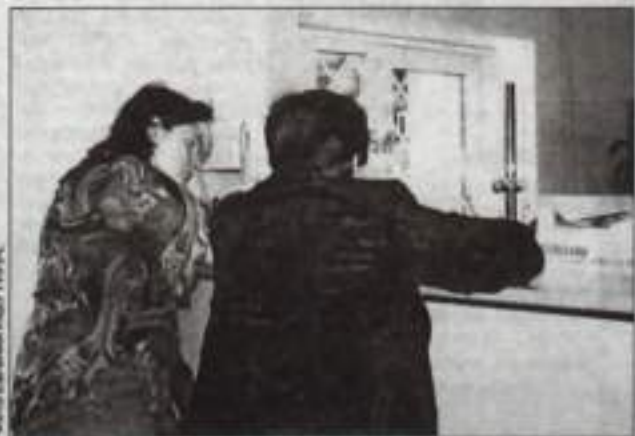
Приобретение билетов – дело хлопотное.

Это хорошо ощущают работники городского агентства, которые иногда продают в день до 50 билетов на поезда и 20 билетов