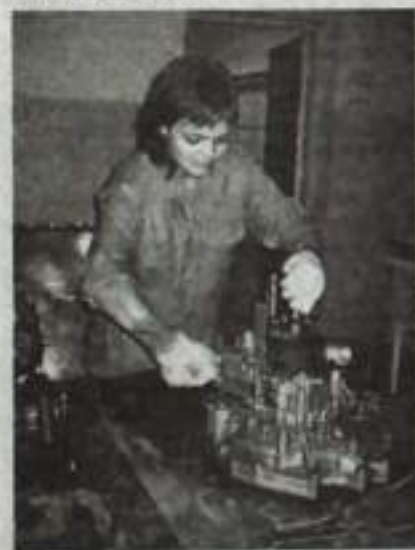
Понять устройство на практике.

У студентов Кумертауского филиала Оренбургского государственного университета учеба продолжается. Они проходят летнюю практику, во время которой закрепляют теоретические знания и получают профессиональные навыки. Организацией практики в филиале занимаются выпускающие кафедры «Электроснабжение промышленных предприятий», «Автомобили и автомобильное хозяйство», «Технология строительства», «Технология строительных материалов», «Архитектура и конструирование».