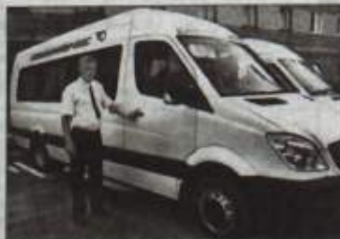
День сегодняшний: новый «Мерседес»...

время, а отделка подъезда перенесена на следующий год, так как вначале предстоит произвести ремонт системы электроснабжения, кроме того, у нас пока на этот подъезд не хватает денег. Многие проблемы по текущему содержанию и капитальному ремонту дома жители смогли бы решить путем объединения в товарищество собственников жилья и принятия решения о финансировании ремонта средствами собственников в размере пяти процентов. В этом году по РЭУ №2 жители домов по Лесной, 19 и Калинина, 12 участвуют в федеральной адресной программе по проведению капитального ремонта многоквартирных домов.