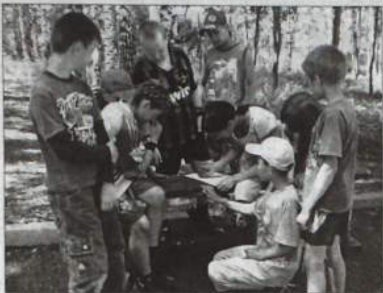
Одна голова – хорошо, а девять – лучше.