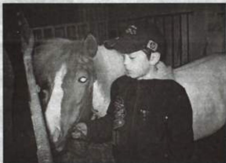
Вдвоем с конем.

Было создано два отряда: старший «Неугомонные» и младший «Радуга». Ребята активно проявляли