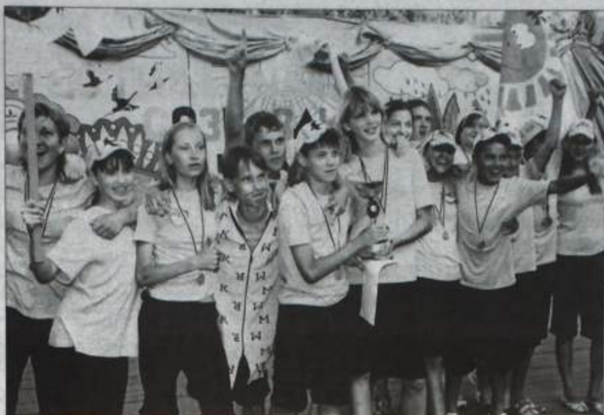
Ликует «Ласточкино гнездо»: победа!!!

И, возвращаясь к моменту открытия фестиваля в «Горном эхе», яркой, зрелищной презентацией, следует сказать, что в этой номинации первенствовало «Горное эхо». Второе место – «Ласточкино гнездо», третье – «Березка».