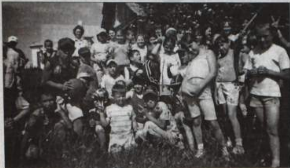
Вместе – дружная семья!

При школе №8 с. Маячного, как и во всех школах города, открыт летний оздоровительный лагерь для 75 ребят от 6 до 14 лет.