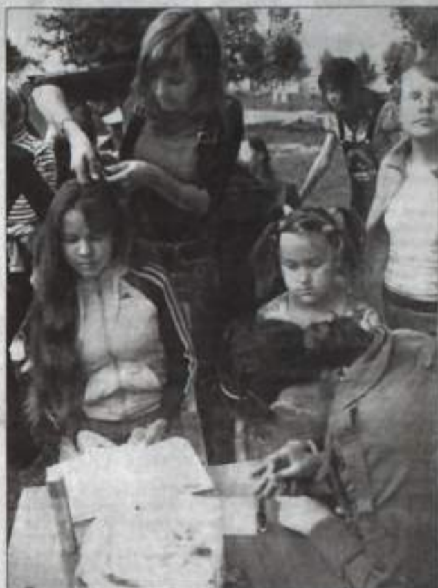
Салон красоты на свежем воздухе.

В рамках праздничной программы прошло награждение почетными грамотами комитета по делам молодежи сотрудников «Самоцветов» за большой личный вклад и активное участие в реализации государственной молодежной политики. Получили награды победители городского конкурса рисунков в стиле граффити «Тебе, Россия, посвящаем». Почетными грамотами отмечены воспитанники подростковых клубов. По окончании концертной программы – молодежная дискотека, давно ставшая излюбленным развлечением молодых... и не только.