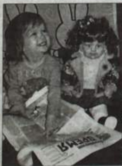
Из всех удовольствий по списку Даешь на «Время» подписку!

Уважаемые горожане! До 31 августа открыта льготная подписка на газету «Кумертауское время» на 2009 год. Подписная цена в редакции (читатель получает газету в редакции или в одном из пунктов раздачи) на 3 месяца – 99 руб., на 6 месяцев – 198 руб., на год – 396 руб. Пункты раздачи газет: 1. КП РБ Редакция газеты «Время», ул. Комсомольская, 35, тел. 4-48-86; 2. Магазин «Книжная находка», ул. Бабаевская, 12, тел. 3-10-90; 3. Центральная детская библиотека, ул. Ленина, 27; 4. Магазин «Орбита», ул. Шахтостроительная, 14, тел. 4-42-77; 5. Магазин «Ариадна», ул. 60 лет БССР, 17, тел. 4-75-76; 6. Магазин «Башспирт», ул. Шахтостроительная, 12, тел. 4-20-09; 7. Магазин №7, ул. Вокзальная, 31«а», тел. 7-72-68. Чтобы вам доставляли газету на дом, вы также можете подписаться на весь 2009 год в отделениях почтовой связи, в отделе подписки, у почтальонов по действующей цене.