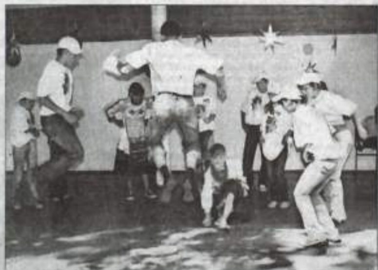
Страсти игровые накаляются.