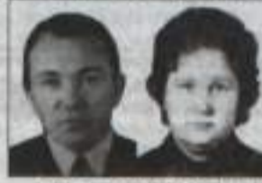
Дети, внуки, правнуки.

Вы полвека вместе прошагали По дорогам жизненным, крутым, Все делили – радости, печали, Зной и стужу, боль и восторг дым. Пусть на все оставшиеся годы Будет теплым и уютным дом. Счастья вам! Любови высоких вздохов, Долгой жизни, радости во всем!