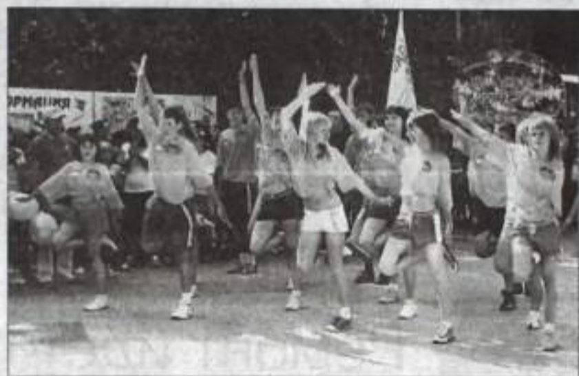
Визитка лагеря — презентация.