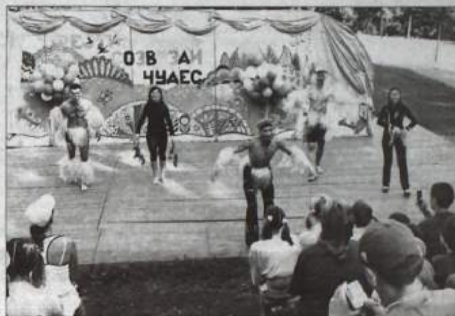
Каждый в лагере – артист.