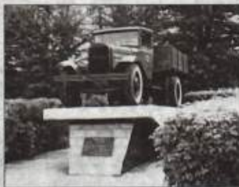
День вчерашний: легендарная полупортка.