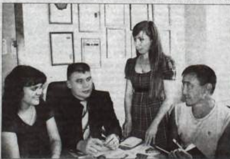
Мозговой штурм — по расписанию.

Беседовала Динара ИШМАЕВА.