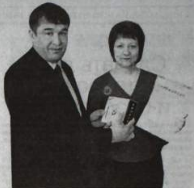
Цифровой фотоаппарат и сертификат в качестве приза.