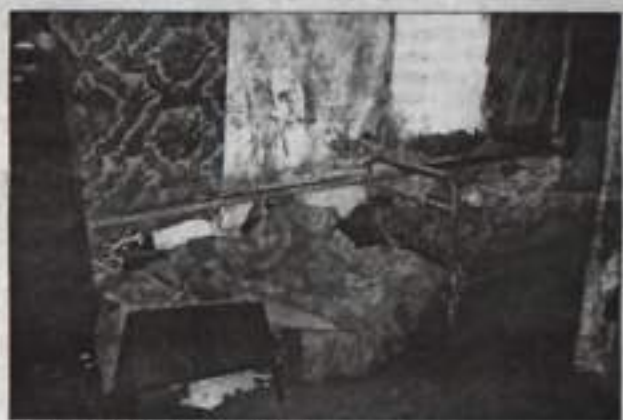
В доме – грязь, вонь, разруха.

ных сапогах и искусственной шубе. Лицо ее – один большой синяк, а сама она была настолько худая, что с трудом стояла на ногах. Восемнадцатилетняя мать гражданки Д. запритчала, рассказывая о своей жизни. О том, что дочь бьет ее, отбирает пенсию, не кормит, пьет и меняет сожителя. Хозяйка время от времени замалывалась на бабу, та ненадолго замолкала. В доме