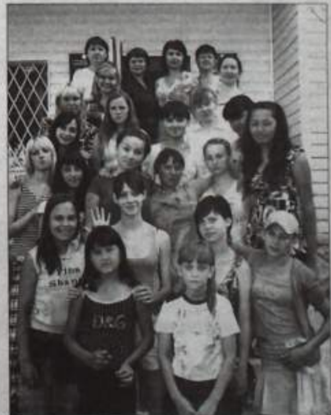
Будущие принцессы и их «феи».

Организаторы лагеря учли и потребность подростков в досуговых мероприятиях. Незабываемая поездка в г. Мелеуз в конноспортивный комплекс «Туглар», поселок Тюльган на крытый ледовый каток, посещение лушкинского праздника в центральной библиотеке. А в конце лагерной смены, как итог, состоялся конкурс «Супер Золушка». Вот тут-то и раскрылись таланты всех наших «золушек». Девушки замеча-