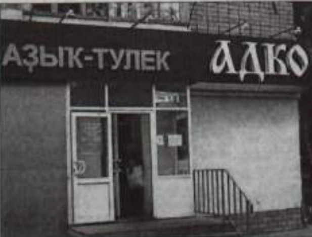
Здесь буква «С» вполне уместна, да не нашлось для буквы места.