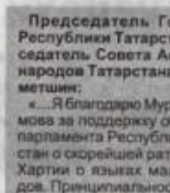
Председатель Госсовета Республики Татарстан, председатель Совета Ассамблеи народов Татарстана Ф. Мухаметшин:

«...Государственная национальная политика России должна стать политикой собирания этого Отечества по кусочкам — каждого народа, независимо от национальной принадлежности».