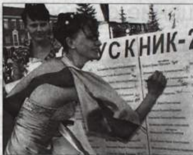
Подпись в книге медалистов.

дали пронизывающие приветствия выпускников детского сада, учащегося хореографической школы, «проплавивший» над площадью вертолет с полотнищем городского флага, внушительные и многочисленные букеты цветов и разноцветные воздушные шары, которые к концу торжества взмыли в небо. Вместе со своими золотыми и серебряными чадами родители совершили круг почета, приветствуемые бурными аплодисментами участников и зрителей праздника. В добрый путь, выпускники! Тамара ЛАПШИНА.