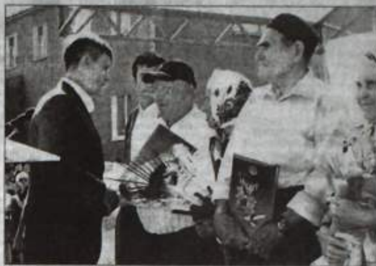
Супругам-рекордсменам – почет и уважение.