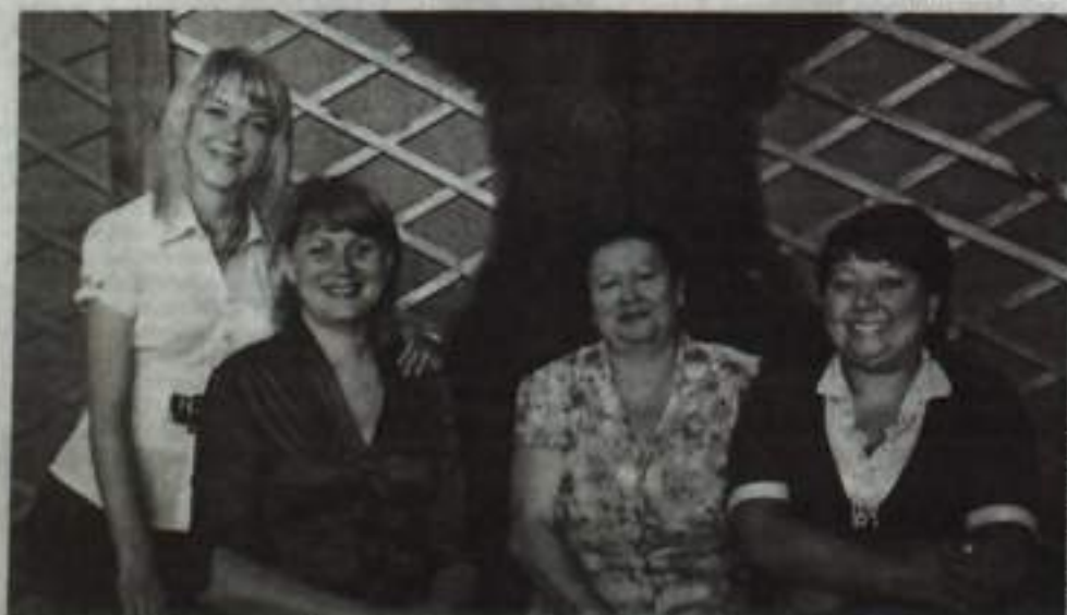
Директор и методисты Центра полны оптимизма и сил дарить людям праздники.