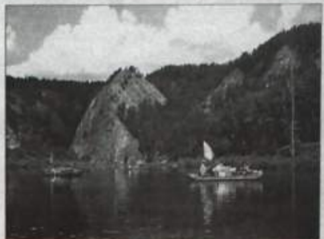
Нашему взору открывались чудные красоты.

Нам предстоял подъем на высокую гору по веревке и