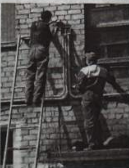
В ходе капитального ремонта по Пушкина, 3 выполняется монтаж выводного электрического кабеля.

По Горького, 18 предстоит освоить, соответственно, 4,3 млн. руб., в том числе 3,9 млн. руб. из Фонда содействия реформированию ЖКХ, и 374,3 тыс. руб. – из республиканского бюджета. Доля собственников жилья, которым дана рассрочка платежа на 12 месяцев, составляет 227 тыс. рублей. По Пушкина, 3 запланиро-