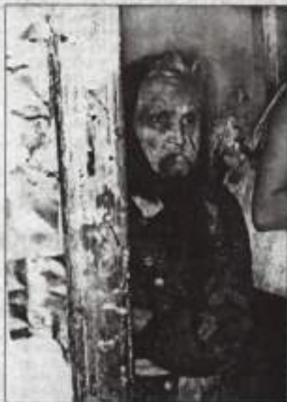
Хозяйка обижает даже собственную мать.

Боюсь, не хватит красноречия, дабы описать увиденный ужас. Поваленный забор, келья-то съездившийся дом, глядящий на улицу мутными стеклами подслеповатых окон, огород, заросший сорняками и заваленный всяким хламом. Из открытых дверей пахнуло так, что мы еле сдержали рвотные слезы. У хороших хозяев загон для скота выглядит чище и уютней, чем помещение, в которое мы попали. В единственной комна-