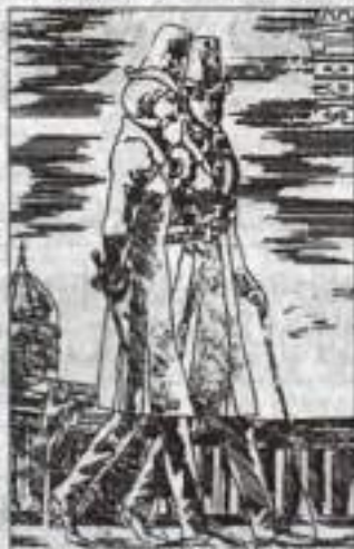
А.С. Пушкин и Н.В. Гоголь. Эскиз Леоныды Тартынского.

Живой интерес гостей вызывают ценные письма, поздравительные открытки, статьи из периодических изданий, адресованные авто-