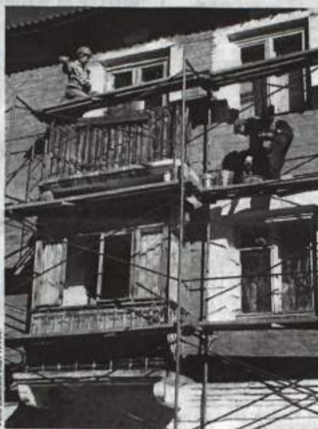
Ремонт фасада ведут рабочие ООО «Акрополь».