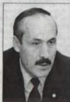
Председатель Совета Ассамблеи народов России Р. Абдулатипов: