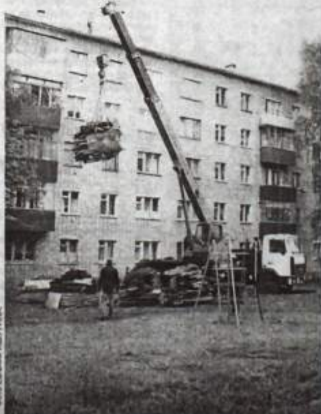
По ул. Пушкина, 16 ведется ремонт кровли.

Работы на всех трех домах ведутся полным ходом, в особенности, по ремонту фасадов и кровли. По Пушкина, 16 сделана отделка