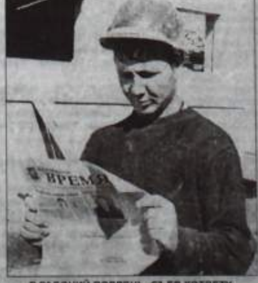
В РАБОЧИЙ ПОПДЕНЬ, СЪЕВ КОТЛЕТУ, ЧИТАЮ Я ЛЮБИМУЮ ГАЗЕТУ.

Продолжается подписка на нашу газету на второе полугодие текущего года. Подписная цена в отделениях почтовой связи на 1 месяц – 56 рублей, на 6 месяцев – 336 рублей. Стоимость подписки в редакции газеты «Кумертауское время»: на 1 месяц – 38 рублей, на 6 месяцев – 228 рублей.