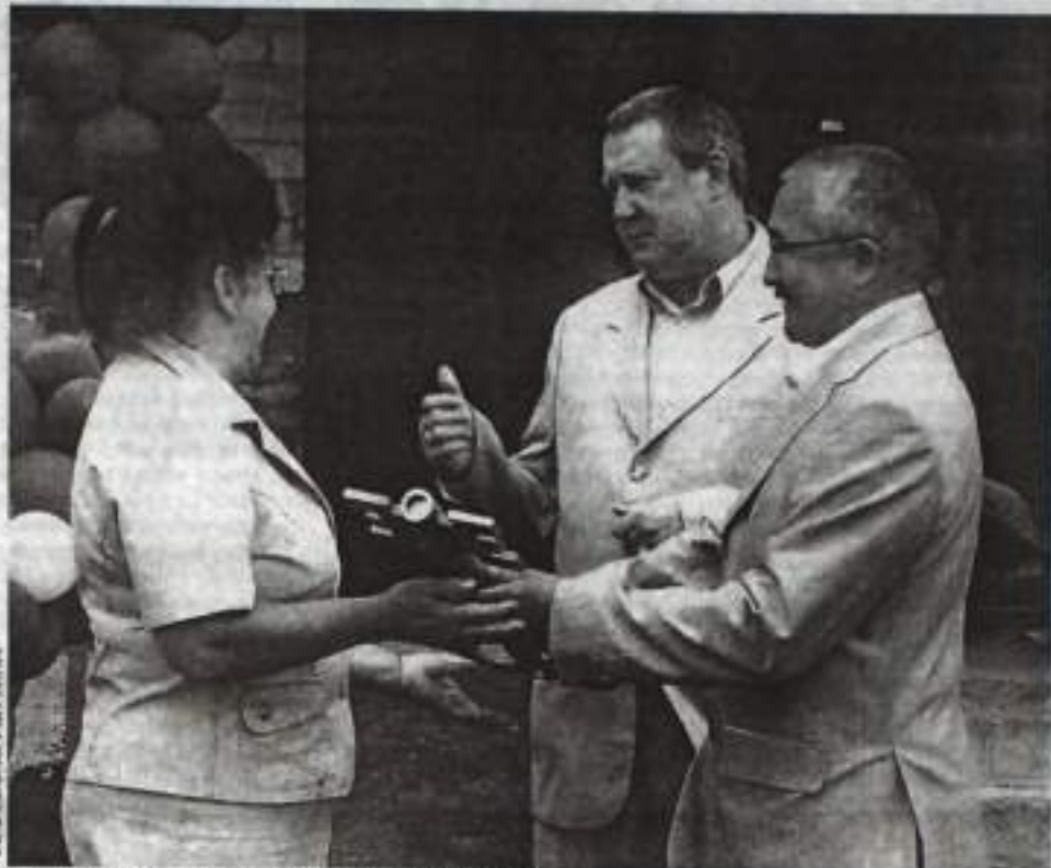
Ключ от нового дома передан директору РЗУ-3.