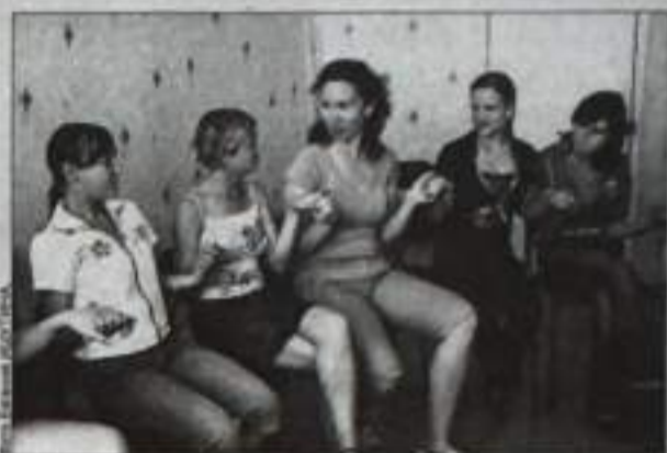
Особенностью работы летнего лагеря дневного пребывания «Золушка» является реализация проекта «Свет мой зеркальце, скажи...». Участницы смены общаются со своими бабушками и мамами, изучают и собирают народные рецепты по уходу за внешним видом, не требующие

Данный социальный проект реализуется с 1 по 19 июня для 30 девочек от 12 до 16 лет. За время пребывания в лагере девочкам помогают найти себя – создать свой образ, сформировать свою жизненную позицию. В двух отрядах с девочками ежедневно занимаются педагоги – психологи, а в качестве инструкторов привлекаются волонтеры городского молодежного добровольческого движения «Поколение NEXT». Помимо этого, проходят встречи с врачами, работниками культуры, парикмахерами, визажистами. Психологами центра «Откровения» проводятся индивидуальные консультации подростков и различные тренинги, в том числе на профориентацию. Программа мероприятий в лагере очень насыщенная. Это посещение туристских дней в библиотеке, экскурсии на конноспортивный комплекс Меллеуза и поездка в п. Толкаган на ледовый каток.