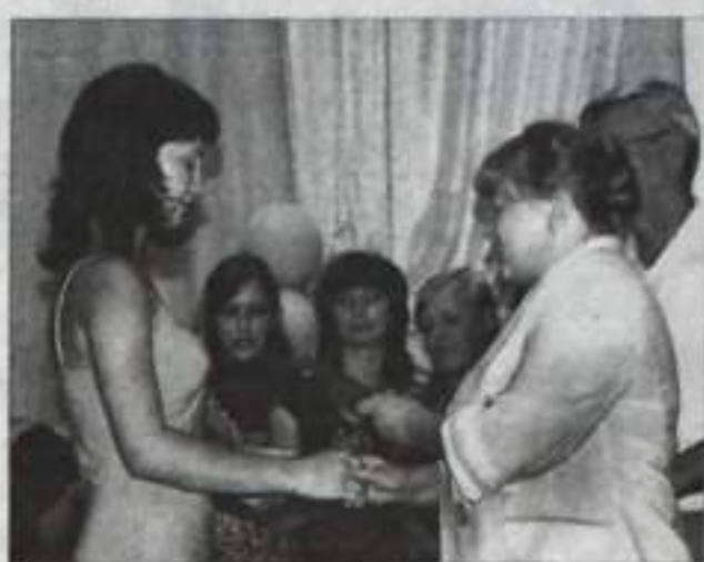
Вручение дипломов выпускникам этого года.

— Основной аспект — материальный. Несложно просчитать затраты на обучение, если студент учится где-нибудь в крупном городе. Даже