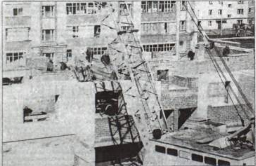
Дом возводится быстрыми темпами.

В начале мая возобновилось строительство 60-квартирного дома №4 по улице Энергетиков. Строительство ведется за счет собственных средств генподрядчика – ООО «Ах-рополь».