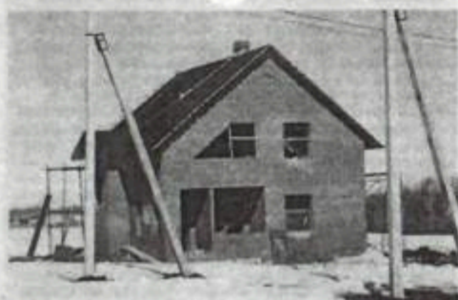
Продолжается строительство коттеджей в микрорайоне Шхертском-3.

под крышей. На земельном участке, где ведется строительство, будет построено 30 индивидуальных жилых домов. Под каждым приусадебным участком отводится от 12 до 14 соток, причем все они размежеваны и имеют кадастровые паспорта, так что у застройщиков не будет в последующем проблем с оформлением их в собственность. Электроснабжение этих участков уже выполнено. Водо- и газоснабжение инвестируется за счет средств республиканской адресной программы, а значит, не влияет на себестоимость квадратного метра. Строим дома трех типов: одноэтажные, площадью 96 квадратных метров, мансардные, площадью 116 квадратных метров, и мансардные, площадью 132 квадратных метра. Проекты домов разработаны квалифицированными специалистами кумертауской мастерской проектного института «Башкилкоммунпроект». Это полные типовые проекты, включающие архитектурные, строительные и инженерные разделы. Дома строим из кирпича, потому что сегодня именно кирпичные постройки на рын-