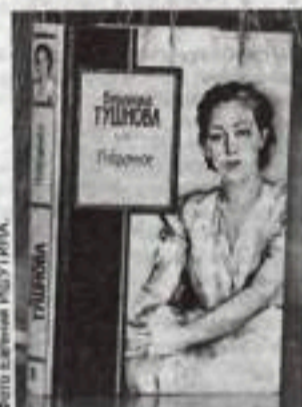
10 лет. Большинство стихов Вероники Тушновой о любви.

тетрадкой», так как она не расставалась с блокнотом, в котором постоянно писала стихи. В 29 лет у поэтессы вышел первый сборник стихов. Он был безжалостно «расплет» литературными критиками. Тушнова достаточно остро переживала критику, следующий сборник она выпустила спустя