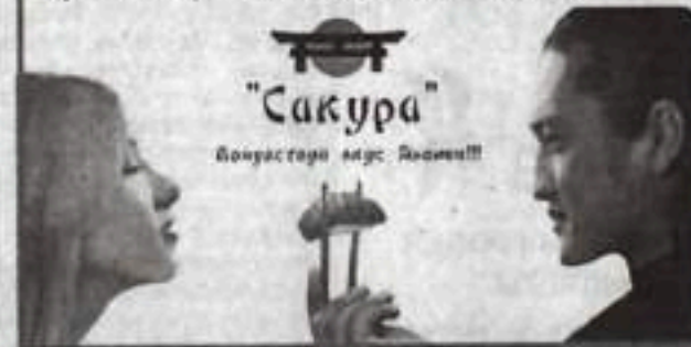
График работы: понедельник-вторник — с 12 до 22 часов, среда-пятница — с 12 до 24 часов, суббота-воскресенье — с 14 до 24 часов. Реклама