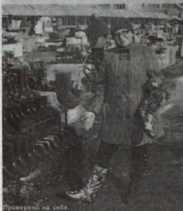
Проверено на себе.

Этой весной, как никогда, востребована резиновая обувь. Промышленность повернулась лицом к покупателям. Сапожки стали разнообразными, красивыми, яркими, в не унылыми черными или зелеными, как было раньше. Модницам – раздолье! Спешит ПОДБЕЛЬСКАЯ.