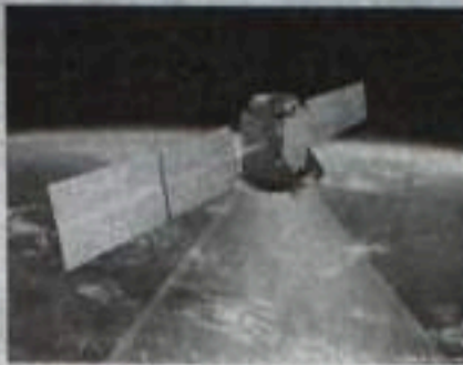
Впервые на орбите – 20 работающих спутников ГЛОНАСС, плюс 2 в резерве. Гиперзвуковой летящий аппарат HiFite развил скорость 5,5 Маха. Спутники будущего будут оснащаться солнечным парусом для утилизации. Сингапур завершает работу над своим первым спутником, а Канада намерена построить 2 собственных космодрома.

● Британские специалисты разрабатывают «ларус» для очистки околоземной орбиты от космического мусора. Аппарат будет иметь массу лишь 3 кг и в сложенном виде «раз-