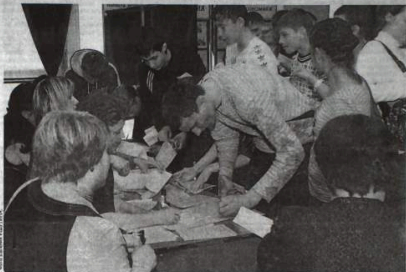
На ярмарке царил оживление.