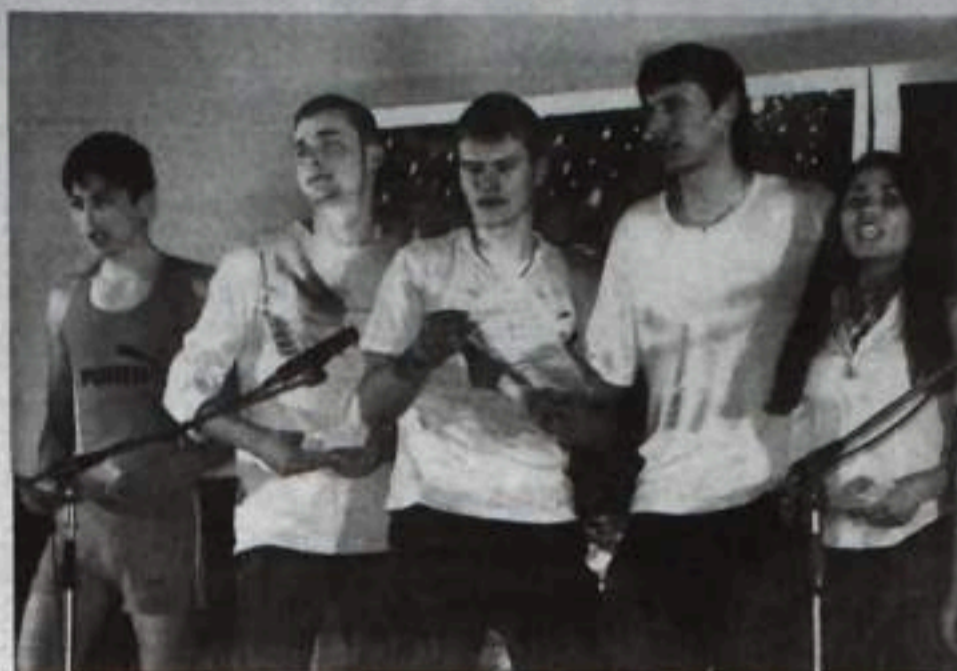
«План эвакуации» в действии.

дентов и преподавателей. Сборная КФ УГАТУ «От винта!» неоднократно становилась победителем городских игр в активный период развития КВНовского движения у нас в городе. А в 2007 году здесь была сформирована собственная лига КВН – «Смайлы». В этом году состоялось второй сезон игр. Участниками лиги «Смайлы» становятся коман- ды КВН, сформированные на основе академических групп с 1 по 4 курс. Делегирование отдельных участников из одной команды в другую разрешается по обоюдному согласию. Схема игр этого сезона получилась следующая: две отборочных игры и финал. В отборочных играх соревновались 7 команд, которые по жребию определили, в какой день им предстоит играть. Две команды вышли в финал. Зрительское СМС-голосование определило третью команду финалистов. Тема конкурсной программы отборочных игр звучала так: «Мы начинаем КВН». По итогам первого тура в финал лиги прошли три команды: «15 ананасов», сформированная исключительно из первокурсников, «План эвакуации» – победительница СМС-голосования и «Comedy Women», отличавшаяся оригинальной игрой. 18 марта состоялся финал. Ребята не подкачали: тема «Олимпийский резерв» раскрыта полностью. Шутки и об олимпиаде, и о городе, и, конечно, о студентах и преподавателях. Все было всерьез, как на Первом канале: жюри, таблички с баллами, электронная счетная комиссия, которая мгновенно выводила баллы на экран, и традиционное: «Ни пуха ни пера!» перед игрой. В конкурсной программе финала значились: визитная карточка,