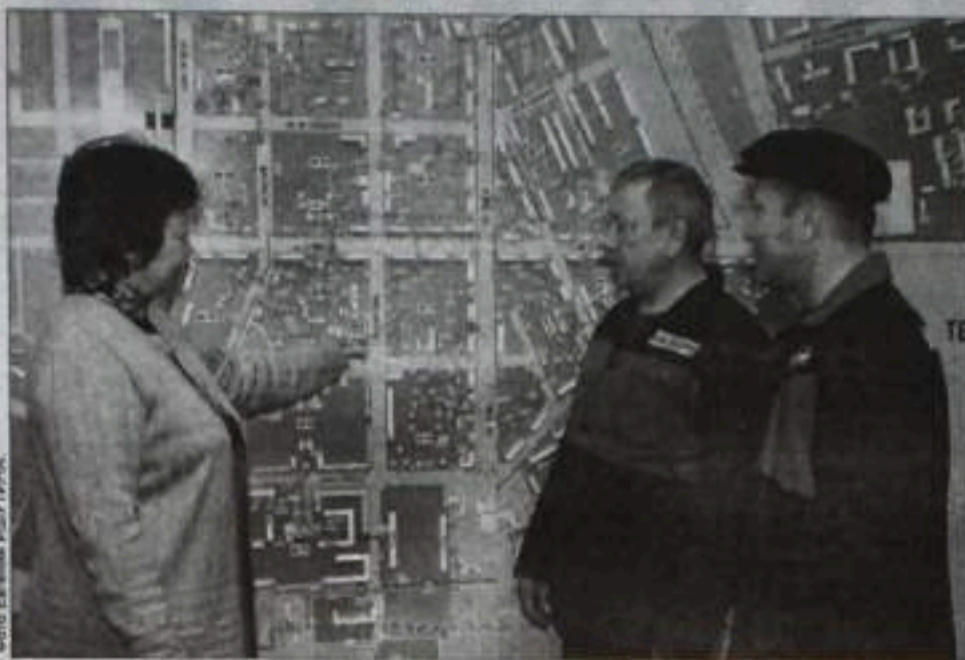
Диспетчер выдает задание оперативной службе.