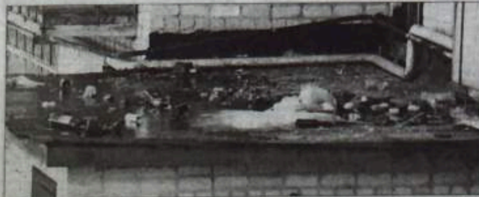
Так выглядит козырек подъезда дома №29 по улице Ломоносова и площадка за хореографической школой.