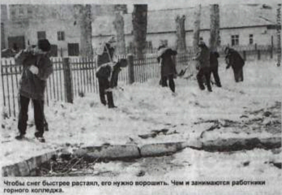
Чтобы снег быстрее растаял, его нужно ворошить. Чем и занимаются работники горного коттеджа.