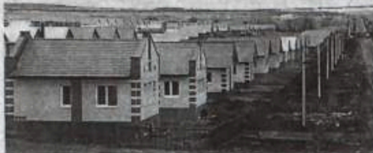
В рамках республиканской программы «Свой дом» в поселке Шамонино под Уфой получили жилье более 120 новоселов. Всего в планах построить здесь 1200 домов.

Б. БЕЛЯЕВ, первый заместитель главы Администрации городского округа город Кумертау.