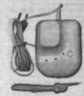
МАВИТ. массажем. Их сочетание ускоряет обменные

факторами: магнитным полем, теплом и вибро-