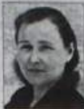
Дети, внуки, правнуки.

Спасибо, родная, что есть ты у нас, Что видим и слышим тебя каждый час, За добрую душу и теплое слово, За то, что не видели в жизни плохого. Спасибо тебе, наш родной человек, Желаем здоровья на долгий твой век!