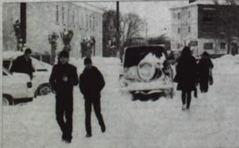
Зима опять пришла неожиданно...