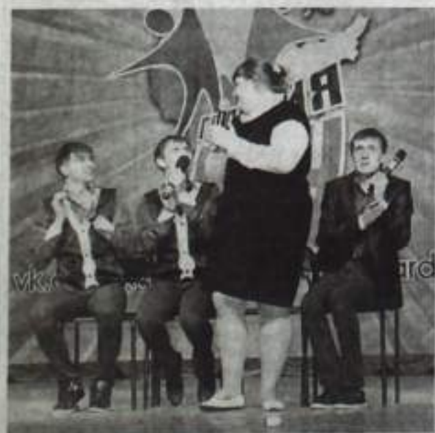
Участница команды «Аристос» получила диплом за лучшую женскую роль.