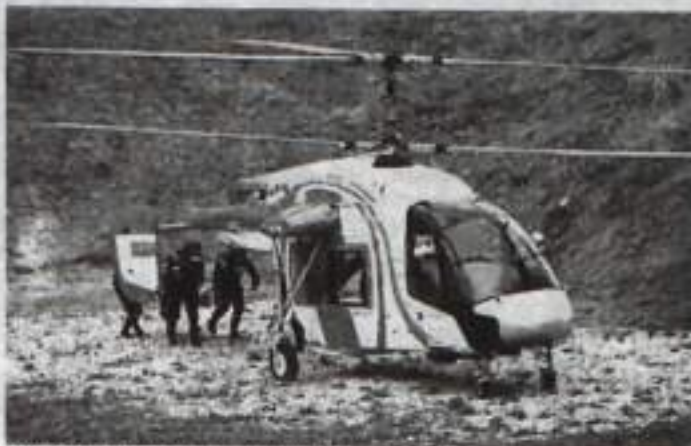
Вертолеты КумАПП незаменимы в любых условиях.

Реструктуризация направлена именно на то, чтобы сохранить КумАПП как важную часть холдинга. Сейчас 90% продукции предприятия – это готовые вертолеты. После завершения модернизации вертолеты будут составлять 48% продукции, а еще