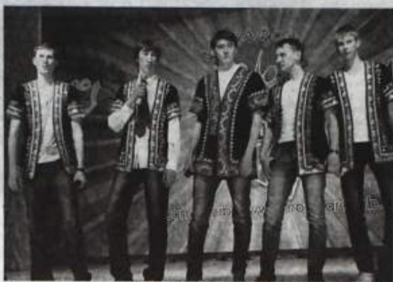
Красавицы в национальных костюмах, «Степные башкиры» из Хайбуллинского района, стали победительницами КВН

ведь народная мудрость гласит, что хотя бы одна должна быть красивой. Тем не менее девушки доказали, что женская дружба существует: одной удалось вытянуть подружку на экзамене по химии, вторая в знак благодарности буквально за волосы вытянула приятельницу в клуб. Кто ожидает в будущем тех парней, кто не сдаст ЕГЭ, с легкостью предсказали ребята из «Аула» Зиянчуринского района. Намек в виде марширующих под известный хит от Status Quo «In The Army Now» людей в военной форме, судя по аплодисментам, понял каждый. Тему ЕГЭ подхватили и учителя из команды «Полокоть в меле» (Куоргазинский район), сообщив присутствующим, что десять тысяч выпускников, не сдавших ЕГЭ, успешно сдали ЭКГ и флюорографию. Красавицы в национальных костюмах, «Степные башкиры» из Хайбуллинского района, с первых же минут появления на сцене завоевали симпатию зрителей и – особенно – зрителей и – особенно – зрителей и – особенно – зрителей.