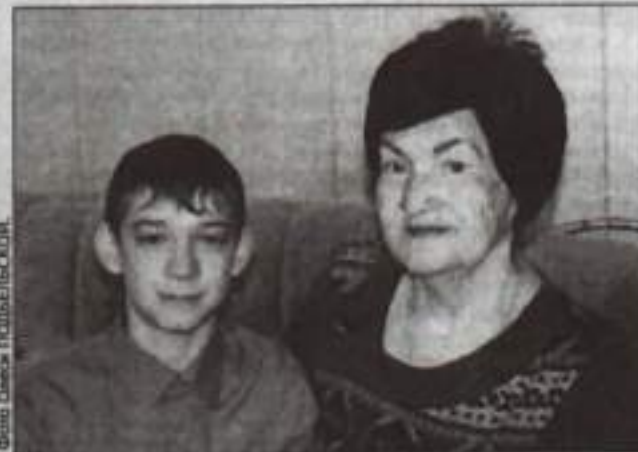
Бабушка и внук стали опорой друг другу.