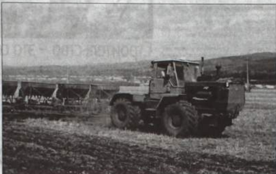
Культивация почвы проводится модернизированной техникой.

В настоящее время сев в районах региона перевалил за экватор. Еще неделя – завершится он и в ООО «Колос», главном сельхозпредприятии городского