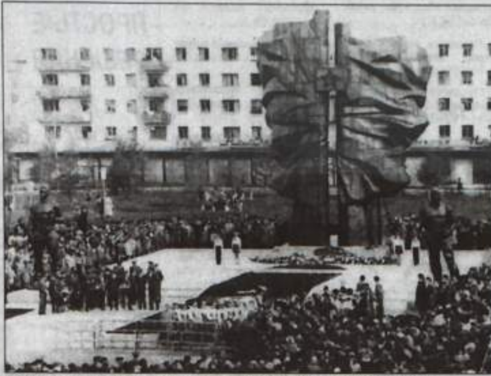
Открытие архитектурного ансамбля Боевой и Трудовой Славы, 9 мая 1983 года.