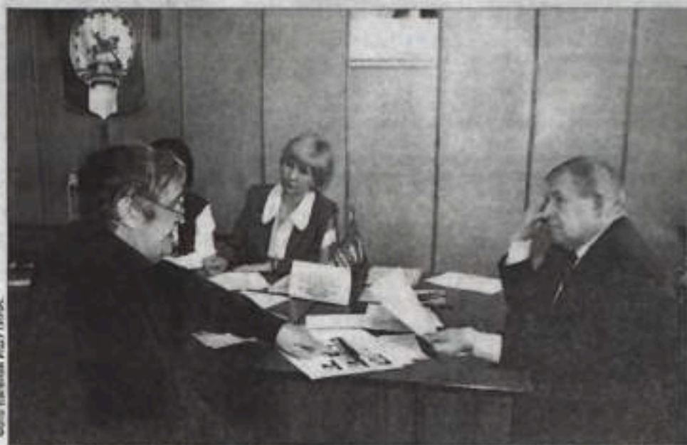
Каждый посетитель был внимательно выслушан.