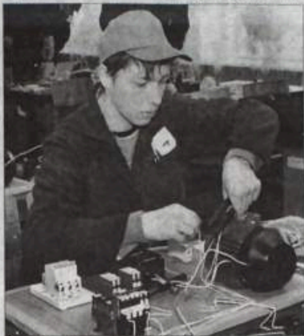
Выполнение практического задания.

Ученики и мастера из 24 учреждений начального профессионального образования республики приехали в Кумертау для того, чтобы показать свое мастерство и претендовать на звание лучшего по профессии. На базе профессионального лицея №33 в течение двух дней проводились испытания для электромонтеров по ремонту и обслуживанию электрооборудования.