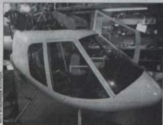
«Роторфлай»: простота, надежность, совершенство, доступность.

товар лицом, демонстрируя свою технику летной братии. В прошлом году, к примеру, «Ротор» стал чемпионом России в 15-й раз. В июне мы побывали в Италии на чемпионате мира «Икаринда» (олимпиада, которая проводится один раз в четыре года по 9 авиационным видам спорта). Это уникальное мероприятие, на котором собирается вся элита авиации. Съездили туда опять же за свой счет, своим ходом (5 тысяч километров в один ко-