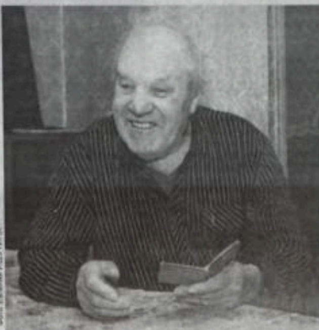
Старый солдат не терпит оптимизма.