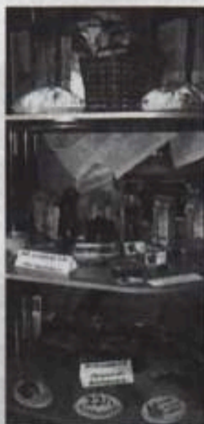
Выставочный стенд Кумертау.