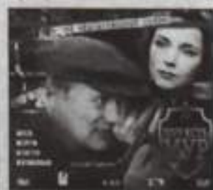
08:08 Т/с "МУР есть МУР"

08:00, 10:00, 13:00 Сегодня 08:15 Полтергейст "Золотой ключик"