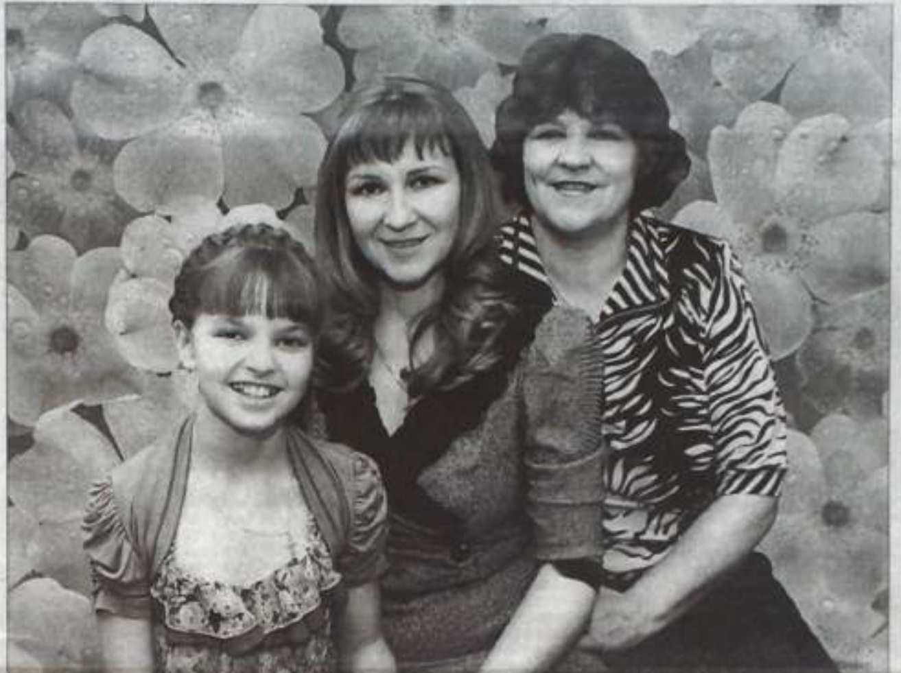
Красива женщина тогда, когда в глазах искрится счастье...

Х. ГАЙСИН, д.т.г.т.т.т.т.т.т.т.т.т.т.т.т.т.т.т. генеральный директор ООО «Агрополь».