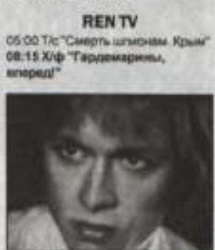
14:00 Х/ф "Виват, гардемарины!"

05:00 Т/с "Смерть шпионам Крым" 08:15 Х/ф "Гардемарины, вперед!"