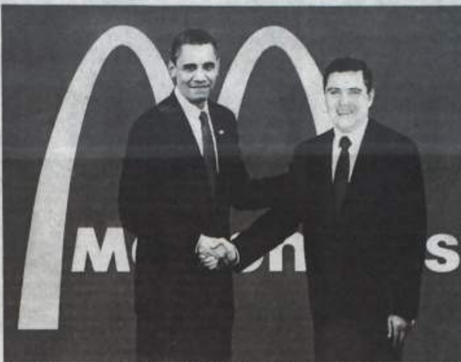
«Приятно иметь дело с такими предприимчивыми людьми», – сказал, скрепляя договор рукопожатием, Президент США Барак Обама.