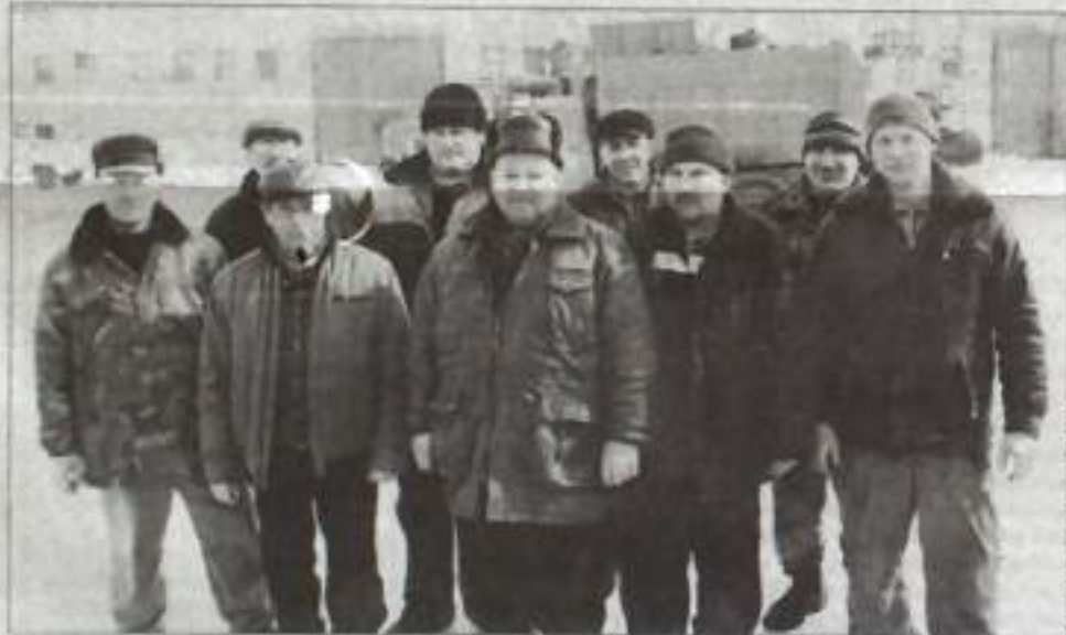
Сергей Акимов / ИА «ИНСОС»