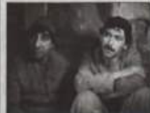
15:10 "Не горюй!". Х/ф.

06:30 Телеканал "Евроньюс" 10:00 Новости культуры 10:20 "Обыкновенный человек". Х/ф