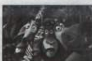
19:25 М/ф "Мадагаскар"

06:00 Х/ф "Садко" 07:45 М/ф "Сказка о мертвой царевне и о семи богатырях"