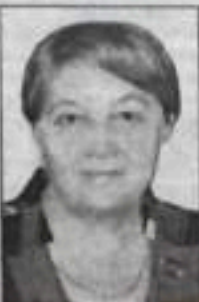
Муж, дети, внуки.

Цветы, улыбки, поздравленья, Тепло души и доброту От нас прими в твой день рожденья, Твой юбилейный день в году. За ласку, доброту, заботу Хотим тебя благодарить. Собрать бы все цветы на свете – Тебе, родная, подарить. И пожелать здоровья, счастья, побольше радости, добра, Чтоб в жизни не было ненастья И чтоб не старили года.