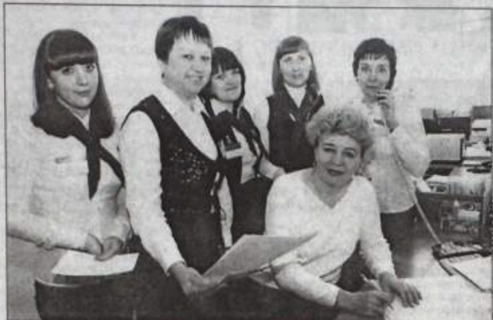
Вот такие мы дружные.

Рабочий день здесь, в отличие от других чисто женских коллективов (да не в обиду им будет сказано), где первые 30 минут дружно проводят у зеркала, начинается с обслуживания клиентов, которые подошли еще до открытия учреждения. Круг обязанностей службы довольно широк: от приема платежей за услуги Интернета, IP-телевидения, телефонии и другие интеллектуальные услуги до заключения договоров и их оплаты как с физическими лицами, так и юридическими. Иными словами, абонентская группа – первоочередная и постоянная точка соприкосновения клиента с районным узлом связи. А об объемах работы службы можно судить по солидной абонентской базе, которая в последние два года непрерывно увеличивает-