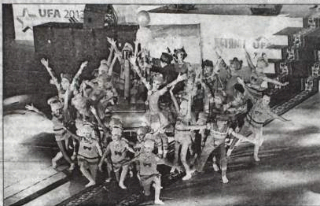
Закрытие Игр – красочное шоу.

Не зря эти соревнования называют детскими Олимпийскими играми, они проходят под знаком олимпийских традиций, в теплой дружеской ат-