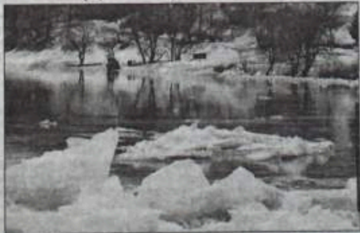
паводка, который станет известен 25 марта.

Сброс воды в водохранилищах Башкортостана планируется после уточненного прогноза