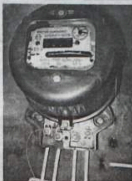
Нарушители вскрывают счетчики, срывают с них пломбы, делают набросы на провода, не выполняя предписания о замене вышедших по срокам эксплуатации приборов учета, что карается законом.

Еще одна причина перебоев напряжения – оборудование. Старые изношенные кабельные, воздушные линии и трансформаторные подстанции не могут обеспечить качественную поставку электроэнергии. А в настоящее время большинство владельцев частных домов серьезно расширяют свои площади и в разы увеличивают потребление электроэнергии. Играет роль и активное строительство домов в прилегающих к городу поселках: на тех улицах, где несколько лет назад стояло 20 домов, сегодня их уже 200. Складывается такая ситуация, что питающая сеть просто неспособна обеспечить всех подключенных к ней потребителей. Ведь на-