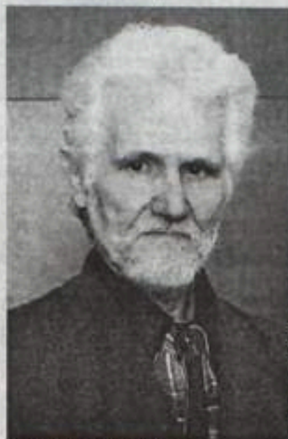
Художник с душой поэта.

О, Господи, спаси от злобы, От суеты и мелких склок. Пусть будут в грязных пятнах рабы, Лишь души замарать не смог. Не надо помнить, как чина, Дай силы боль свою сносить, И в мновение кончины Своих обидчиков простить.