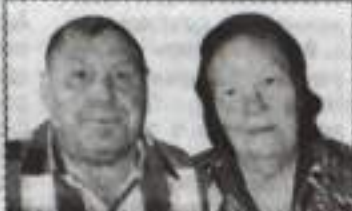
Дети, внуки, правнук.

Такие даты празднуют нечасто, Но коль пришла сей день встречать пора, Мы от души желаем много счастья, А с ним - здоровья, бодрости, добра!