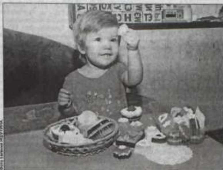
Младший сын Рома – первый мамин «помощник» и ценитель ее работ.

Мыловарами можно долго любоваться, нюхать, восхищаясь фантазией и аккуратностью мастерицы, поскольку эти творения имеют не только богатый состав, но и высокохудожественный внешний вид. А еще и «одетые» в эксклюзивную упаковку, они становятся просто