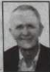
Жена, дети, внуки, правнучки.

Год прошел - много или мало? Никто не скажет никогда, А в сердце боль не утихнет, Мы помним о тебе всегда. Скорбь не выразить словами, Боль не утешить слезами. Осиринкой и глубокой раной Остался след в наших сердцах. Светлая тебе память и вечный покой. Помним, любим, скорбим.