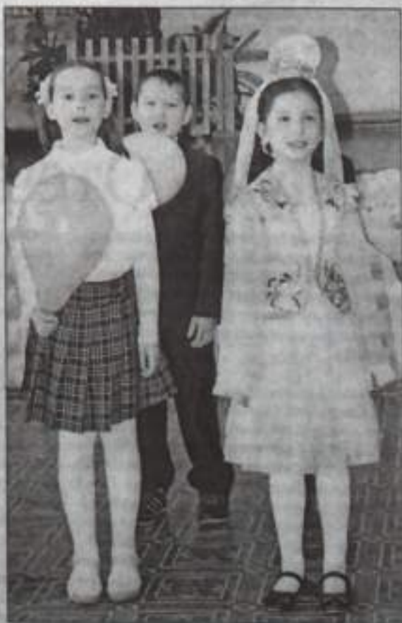
Приятно смотреть и слушать, с какой радостью и гордостью читают ученики стихи национальных поэтов.