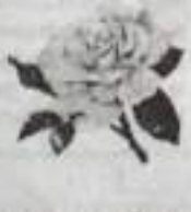
С поздравлениями, святая Амир, Светлана, Лилия, Азат, Илина, зять Фидан, дочка Алёна, внучка Аделина.

ТД «Забота» отдел «Инструменты» реализует: ручной и электринструмент, сварочные аппараты, деревообрабатывающие станки, бензопилы, снеговые лопаты, двигатели для снега, ледорубы, автомашины, аккумуляторы. Теплица «Надежная» с поликарбонатом (4*3*2 м) – от 12000 руб.