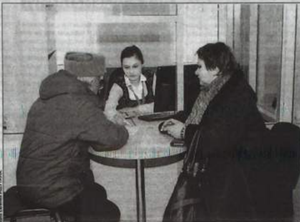
«Одно окно» – это большой ряд услуг в одном месте.

В МФЦ первым встречает людей специалист на ресепшене. Ресепшн в переводе с английского означает приемная. Это то место, куда в первую очередь обращается человек, заходящий в учреждение. Сотрудники, работающие здесь, помогают клиентам сориентироваться в зале, дают разъяснения, следят за порядком, очередностью. Одна из лучших – Римма Сиразетдинова. Она обладает уме-