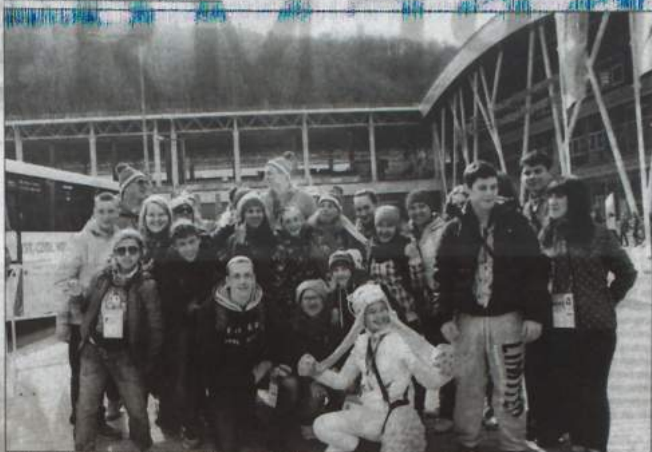
Кумертауские участники фестиваля «Здравствуй, Сочи!».