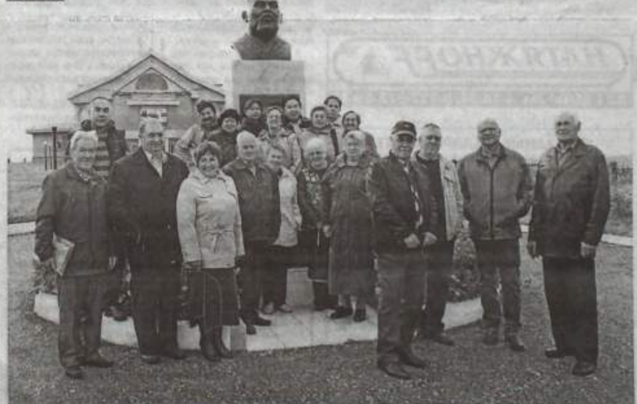
Ветераны на экскурсии в музее К. Арсланова.