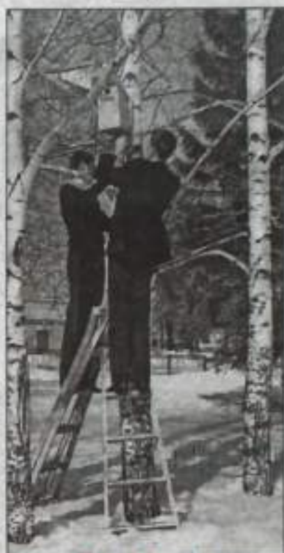
Во многих дворах, в том числе школьных, по традиции весной развешивают скворечники.