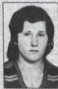
Муж, дети, внуки.

Пусть печали в твой дом не заходят, Пусть болезни пройдут стороной, Мы весь мир поместили в ладони И тебе подарили одной. Но и этого было бы мало, Чтоб воздать за твою доброту; Мы всю жизнь, наша милая мама, Пред тобой в неоплатном долгу. Спасибо, родная, за то, что растила, За то, что взамен ничего не просила, Что горе и радость дела папилом, Во всем лучшей доли желала ты нам. Красива, заботлива, мила, нежна, Ты нам ежедневно и вечно нужна!