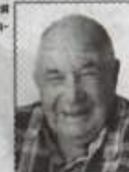
Внуки со всей России и правнучки.