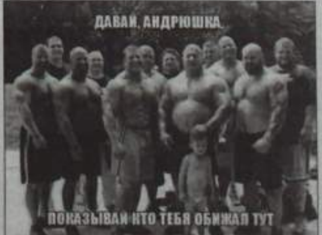
ДАВАИ, АНДРИШКА! ПОКАЗЫВАЙ КТО ТЕБЯ ОБИНЯЛ ТУТ!

В гостях • Говорить во всеулышание о том, что вы сидите на диете, – дурной тон. Тем более нельзя под этим предлогом отказываться от блюд, предложенных гостеприимной хозяйкой. Обязательно похвалите её кулинарные таланты, при этом вы можете ничего не есть. Так же следует поступать с алкоголем. Почему вам нельзя пить – это ваша проблема. Попросите сухого белого вина и слегка пригубите. • Запрещённые темы для светской беседы: полити-