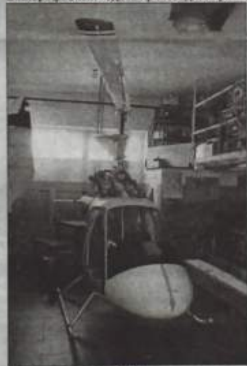
Ещё немного – и в небо!

больше – 8-10 литров в час (расход в авиации высчитывают не в километрах, а в часах).