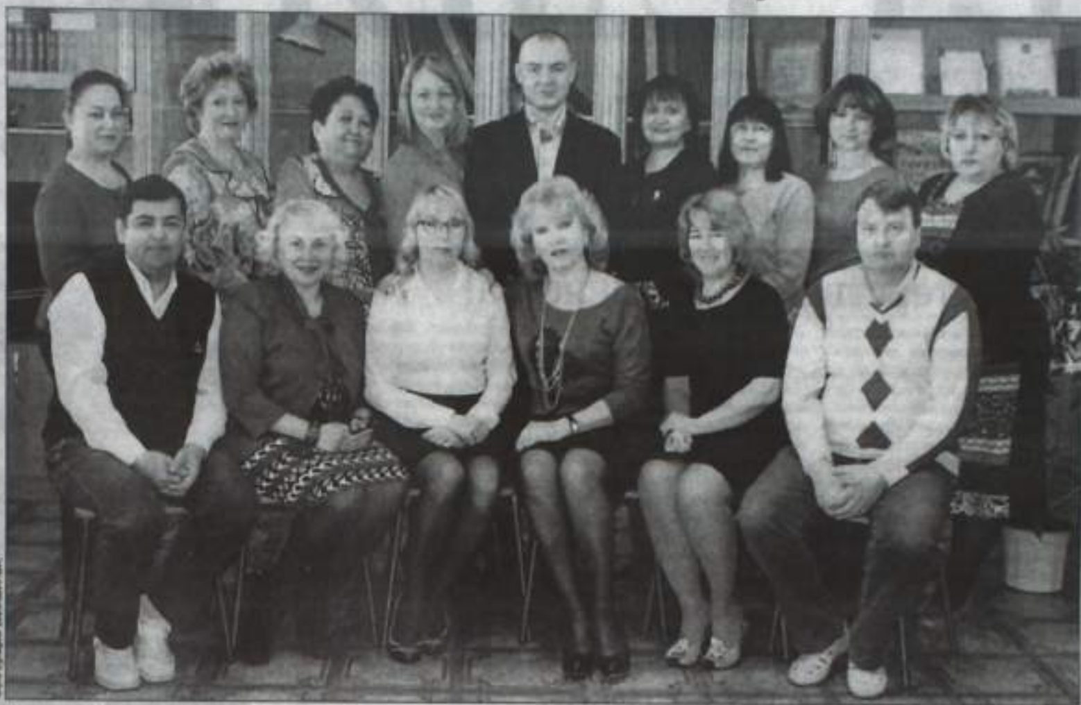
Коллектив редакции сегодня.