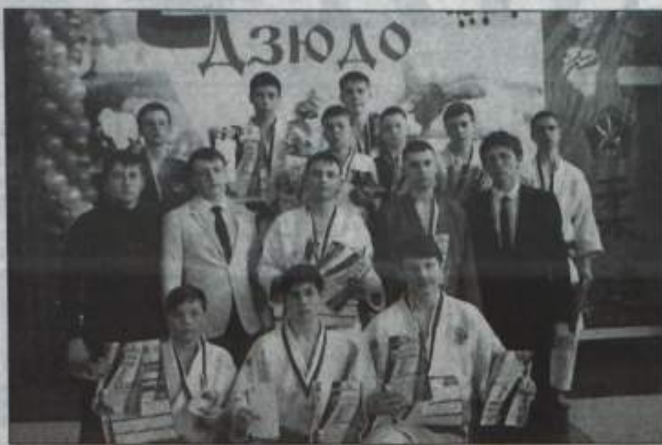
Нашки спортсмены не подкачали!