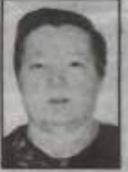
Дети, внуки, правнучка.