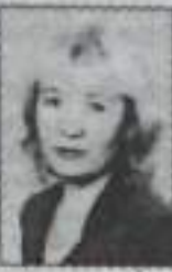
Муж, дочь, сын, сноха, внук.

Тебе, родная наша, всего лишь пятьдесят! Душа твоя все краше и теплее взгляд. Памяти не воплоти, трудилось день и ночь, Всегда была готова ты каждому помочь. И нас ты научила работать и любить, И мы, как ты, стремимся полезными людям быть. Ты отдала нам годы душевного тепла И через все невзгоды всегда вперед вела. Жене, любимой маме, бабушке родной Шлем поздравленья наши и наш поклон земной.