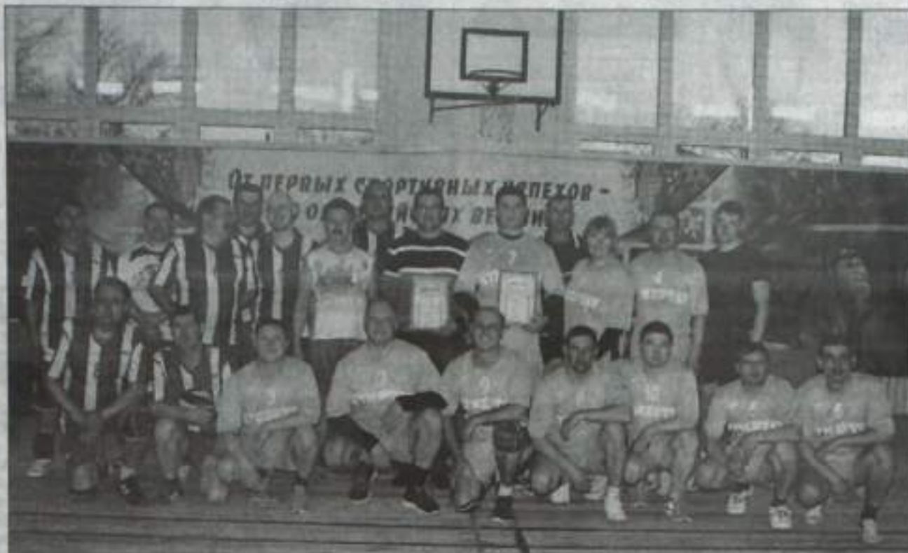
Команды Кумертау и Куургазинского района.

На протяжении всего матча присутствовали азарт, спортивный настрой и нена-