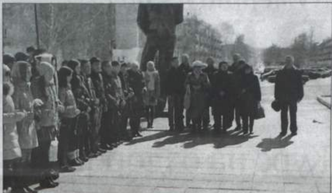
Память павших участники акции почтили минутой молчания.