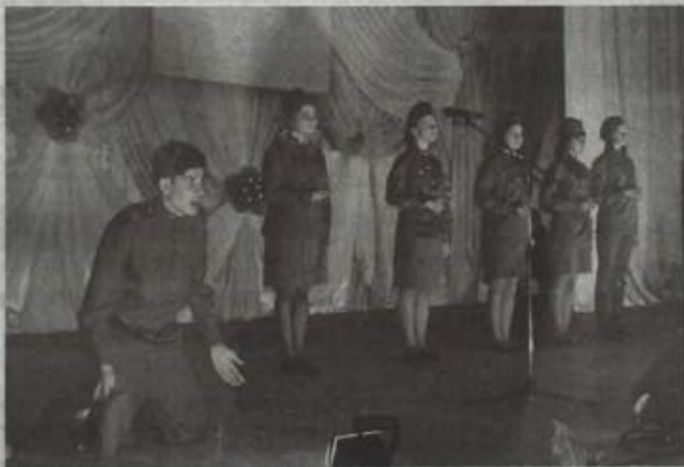
Сцена из пьесы "А зори здесь тихие..."