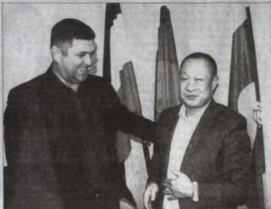
С надеждой на дальнейшее сотрудничество.