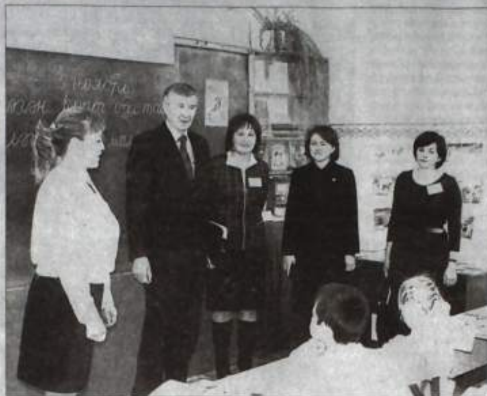
Урок башкирского языка в школе №5.