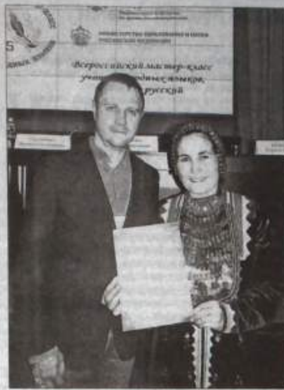
В Московской академии повышения квалификации и профессиональной переподготовки работников образования прошёл Всероссийский мастер-класс учителей родных языков.

Мероприятие состоялось по инициативе и финансовой поддержке Федерального агентства по делам национальностей (ФАДН России) в рамках Федеральной целевой программы «Укрепление единства российской нации и этнокультурное развитие народов России». В нём принимали участие призёры конкурсов учителей родных языков, проводимых в субъектах Российской Федерации, победители национального проекта «Образование».