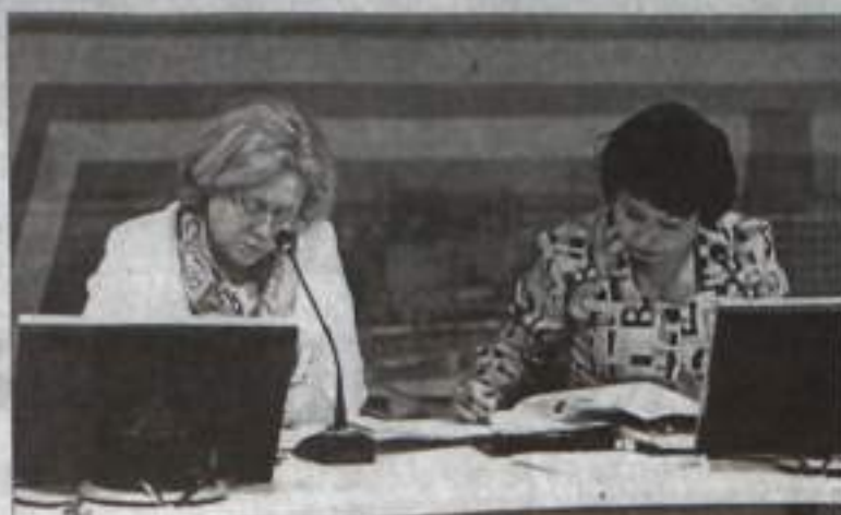
Члены комиссии тщательно рассмотрели каждого претендента на финансовую помощь.