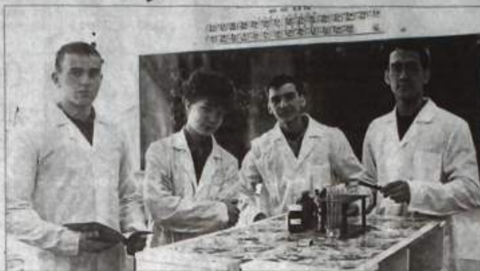
Кто из этих студентов останется в Кумертау?

года ликвидируется начальное профессиональное образование, теперь подготовкой специалистов начального звена будут заниматься учреждения среднего профессионального образования. Чтобы готовить рабочие кадры, мы по профилю нашего предприятия в ближайшее время получим лицензию на десять рабочих специальностей. То есть выпускники девяти классов получат рабочую специальность и профессию техника (среднее звено). Алгоритм начали. Половину времени обучения занимает практика, половину – теория. Этот метод оправдался, 45 выпускников авиационного технического колледжа продолжают обучение в системе высшего профессионального образования в нашем вузе. Вместе с тем на КумАПП идёт процесс обновления, реструктуризации. Закупается новое оборудование, станки. Думаю, что если задуманное осуществится, больше выпускников будет оставаться в городе.