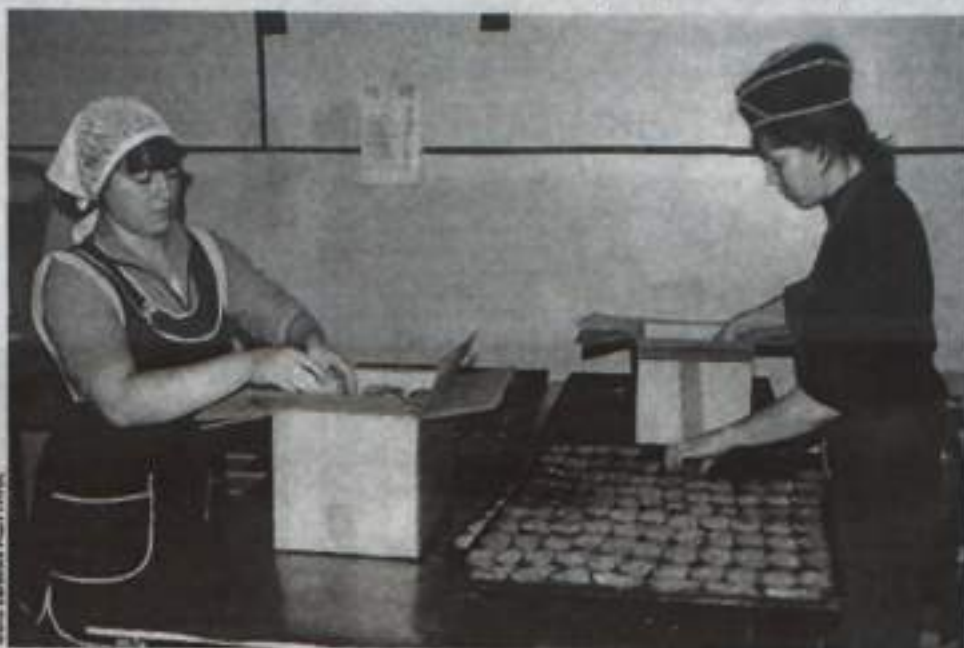
«Продукт Башкортостана» фасуется перед отправкой на прилавки магазинов.

зисный объем выпускаемой продукции: стали ежедневно выпекать 2,5 тонны хлеба. Однако увеличить выпуск продукции до объема, на которую рассчитывали выйти после технического перевооружения (это порядка пяти тонн), не позволила новая проблема – кадровый дефицит, явно проявившийся в конце лета. На комбинате осталось всего 17 пекарей и кондитеров. Сегодня срочно требуется как минимум столько же работников. Кстати, в результате модернизации и проведенной оптимизации управленческого аппарата удалось увеличить зарплату на 25 % – теперь пекари получают от 13 до 16 тысяч рублей. Кроме