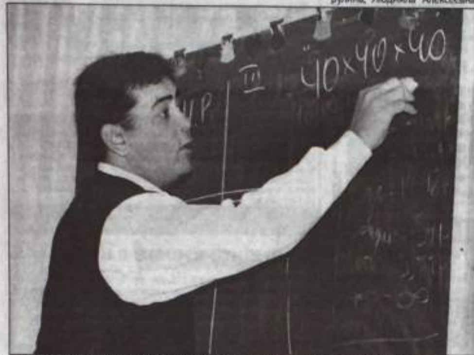
Формула жизни наемного рабочего: 40 часов в неделю, 40 лет стаж и пенсия – 40% от зарплаты.