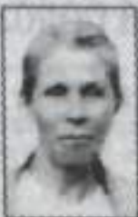
Сыновья, родные, близкие.

Сколько прожило лет, Мы не будем считать, И хотим в эти дни Мы тебе пожелать: Не стареть, не болеть, Не хандрить, не скучать, И еще много раз День рожденья встречать!