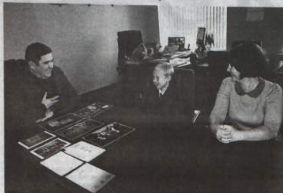
В штаб-квартире ЮНЕСКО в Париже прошёл круглый стол по сохранению уникального эпоса «Урал-батыр» и включению природного объекта

«Башкирский Урал» в список всемирного наследия. С успехом прошли выставка «Башкортостан – жемчужина РОССИИ», гала-концерт, в котором приняли участие ведущие солисты и творческие коллективы республики.