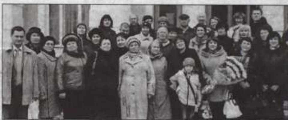
В честь праздника для активных пайщиков была организована поездка в Уфу на концерт фольклорно-эстрадного ансамбля «Каравансарай».

Кооператив является членом Союза предпринимателей города Кумертау. Примером нашего сотрудничества является совместное изучение и анализ предпринимательской деятельности в городе, постоянный обмен информацией, участие в мероприятиях, проводимых республиканскими и общероссийскими структурами поддержки малого бизнеса, в том числе и в конкурсах. Так, на Международной неделе предпринимательства и бизнеса в Республике Башкортостан в 2007 году КПК «Гражданский кредит» был награжден Дипломом I степени за лучший прирост фонда, ста-