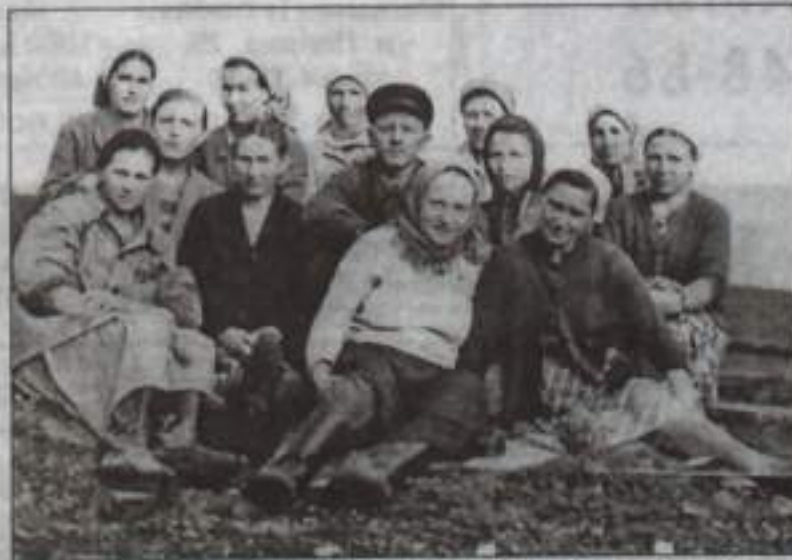
Мама (крайняя справа в последнем ряду) среди путейцев.