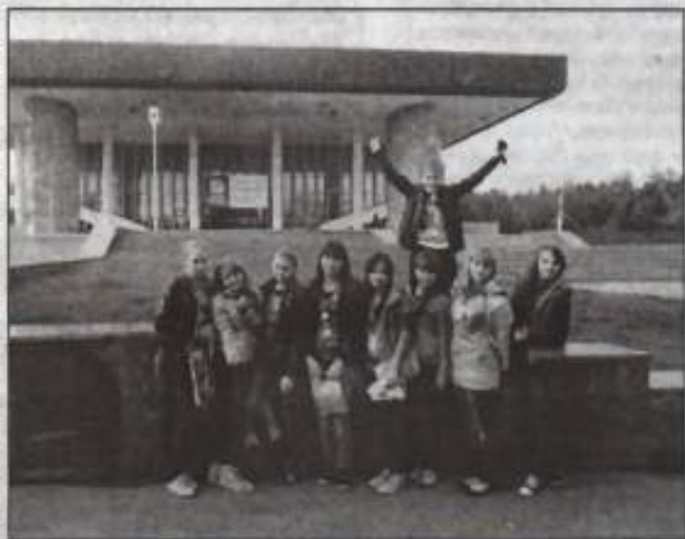
Наши юные звезды перед концертом.

Работа фестиваля проходила в три этапа. С 17 июля по 17 августа шел прием и отбор конкурсных работ по следующим номинациям: вокальное творчество, хореография, изобразительное творчество. На втором этапе члены жюри определили победителей. По итогам фестиваля в Уфе состоялся гала-концерт и выставка-ярмарка конкурсных работ декоративно-прикладного направления. Из 120 заявленных участников в финал фестиваля прошли 20 номеров различных жанров. Финалистами конкурса из города Кумертау стали воспитанник реабилитационного центра, учащийся гимназии