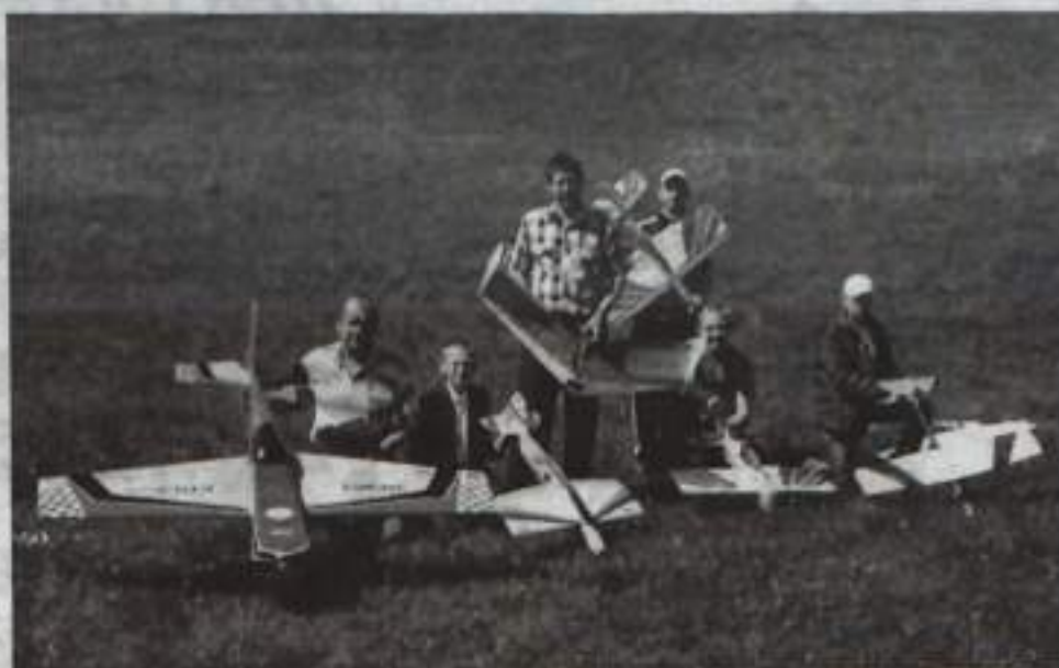
Кумертауские авиамоделисты – неоднократные победители и призёры различных соревнований.

Может быть, кому-то покажется удивительным, что в Центре юных техников ОАО «КумАПП» среди руководителей кружков нет ни одного педагога со специальным образованием. Но так сложилась судьба, что многие из них проработали педагогами дополнительного образования практически с начала создания этого учреждения.