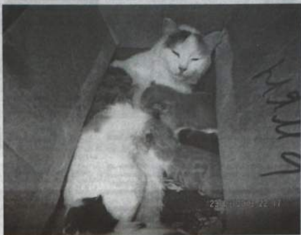
Лучшая реклама магазина «Няма».

Наша кошка с удовольствием приносит потомство только в картонных коробках. Так что пустые коробки из магази-