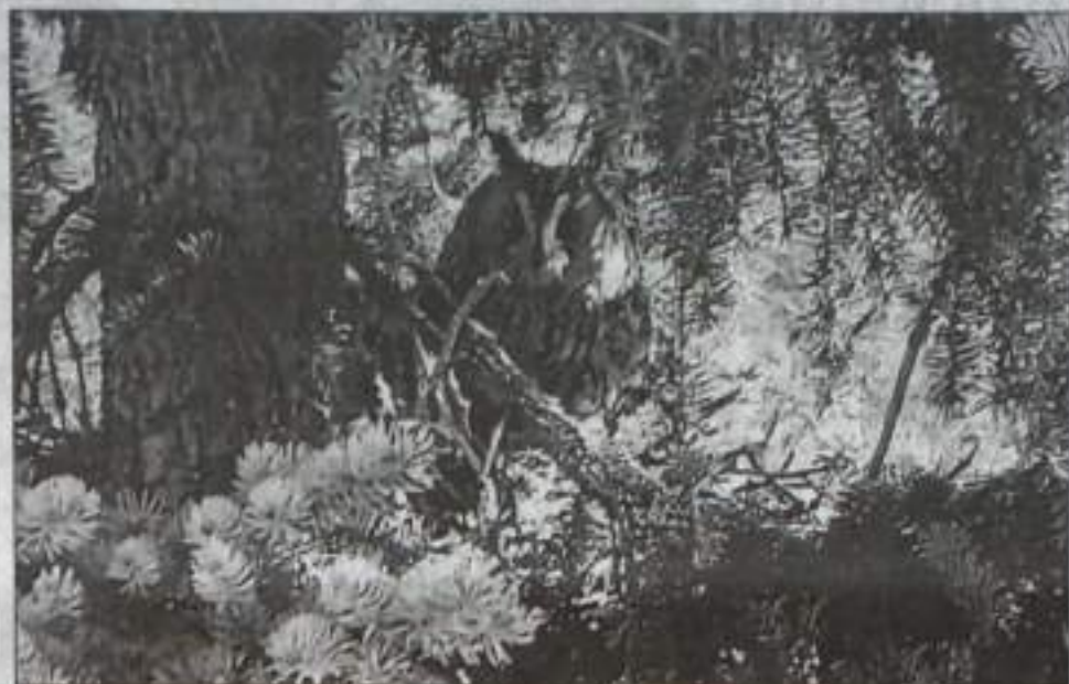
"Я наблюдаю за вашей работой..."

На ели, напротив окон нашей рабочей комнаты на КумАПП, на уровне третьего этажа поселилась ушастая сова. С ранней весны до поздней осени мы глядели друг на друга.