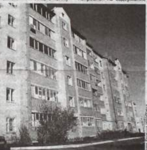
Лучший многоквартирный дом прошлого года – №3 по улице Салавата.

В первую очередь, жюри будет учитывать оформление подъездов и поддержание в них чистоты. Особое внимание – техническому состоянию. В исправном состоянии и без разрушений должны быть конструктивные элементы дома – цоколь, крыльцо, козырьки над входами в подъезды. Жюри оценит фасад, лестничные клетки, подвальные и чердачные помещения. Дополнительные бонусы получат те дома, возле которых оборудованы детские и спортивные площадки, проведено озеленение. Еще одно обязательное условие для участия в конкурсе: у граждан, проживающих в многоквартирном доме, не должно быть задолженности по оплате жилищно-коммунальных услуг.