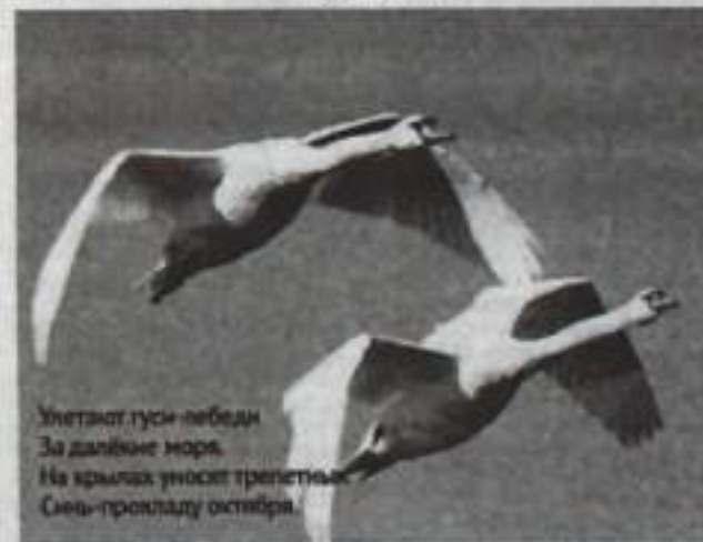
Улетают гуси-лебеди За дальние моря. На крыльях уносит трепетных Снег-прохладу октября.

Заканчивается сезон миграции перелетных птиц. Первыми – в конце августа – нас покинули черные стрижи, городские ласточки, кукушки, кулики, зяблики. Следом улетели крупные хищные птицы – орланы-белохвосты и другие. В начале сентября наши леса оставили пеночки, славки, мухоловки, за ними – зяблики, овсянки, дрозды-зарянки.