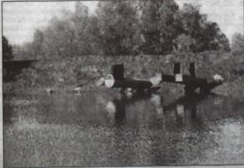
Дамба Канчуринского пруда.

ны задвижки и сливные трубы. Работники предприятия хорошо и быстро выполнили намеченную работу. На этой неделе она будет продолжена: подготовка площадки для установки весной оборудования, очистки родников. А чтобы почистить весь пруд, нужно несколько миллионов рублей, которых, к сожалению, у садоводческого товарищества нет. Оставшиеся 340 тысяч вложены в новый водовод длиной 630 метров для участка в массиве «Восток-2» и «Сосновый бор». То, что уже сделано в этом году, вызывает у садоводов оптимизм. «Думаем, что в 2014