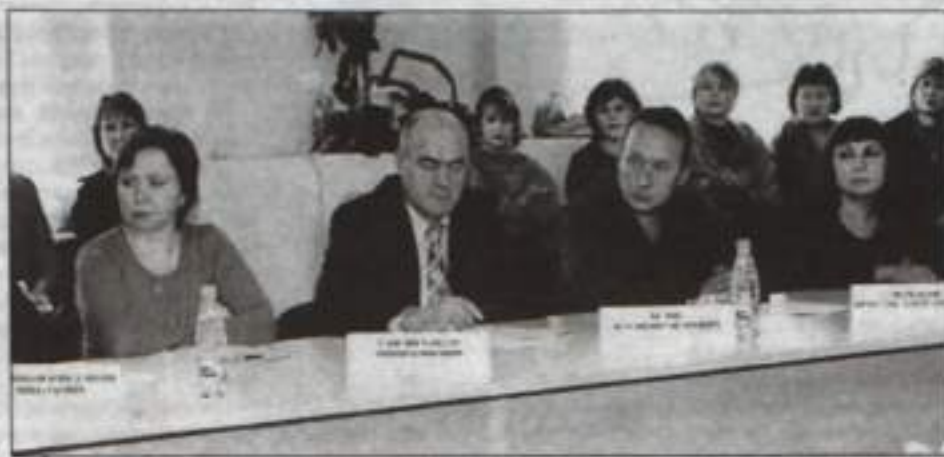
Информацию, прозвучавшую за круглым столом, представители кумертауского бизнеса восприняли заинтересованно.

Второй день Недели был посвящен начинающим предпринимателям и тем, кто только собирается открыть собственное дело. О том, где можно обучиться азам предпринимательства, и какие затраты необходимо предусмотреть начинающему бизнесмену на организацию своего дела, рассказала Ди-