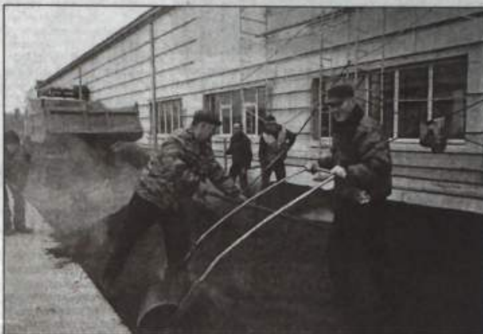
Со стороны кажется – работа несложная, на самом деле – это тяжелый труд.

– Одна из основных причин разрушения проезжей части, после качества асфальта и технологичности ремонта, – это вода, которая рекой течет по доро-