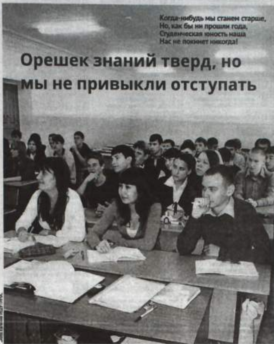
Будущие инженеры, а ныне второкурсники Кумертауского филиала УГАТУ на лекции. В настоящее время здесь постигают премудрости авиастроения 319 студентов дневного отделения, 170 студентов – вечернего и 469 студентов – заочного.

С покойником трудно спорить: ты ему – мысль, а он тебе – диагноз.