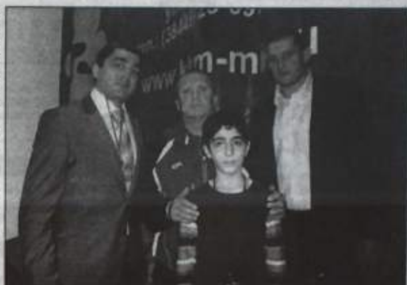
Фото на память с чемпионом (Хасан Бароев – крайний справа).