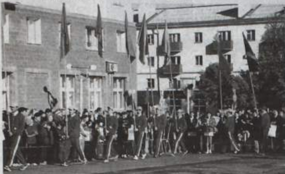
Выступление Кумертауского педагогического колледжа.

спортивных залах города, в которых приняли участие около тысячи любителей спорта. Финалом недели стал «Кросс Нации-2010», посвященный Всероссийскому дню бега.