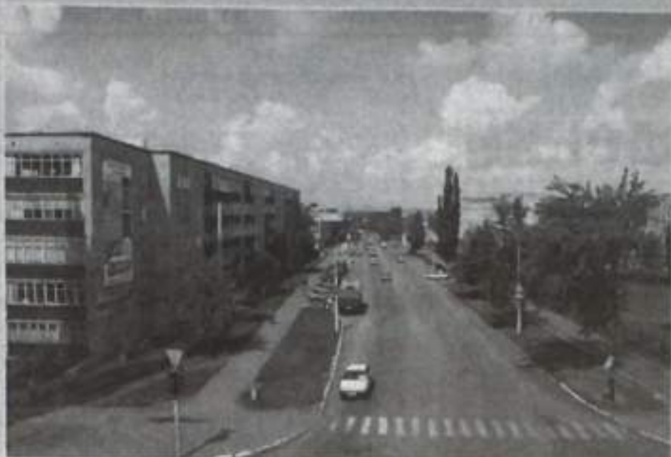
Несмотря на некоторые недостатки, город наш все-таки хорош!

«Асфальтированная тропинка, что пролегает за