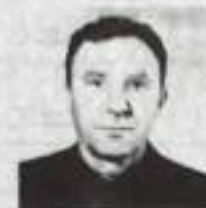
Жена, дети, внуки.

Папочка, прими от нас, детей, Поздравления в славный юбилей. Семьдесят – для всех немалый срок, Но хотим, чтоб ты и дальше мог Радоваться присутствием своим. Знаешь ведь, как дорог нам, любим, Как нам нужен ласковый твой взгляд, Юмор твой – ты им всегда богат. Чтобы хворь не мучила тебя, Не болела бы за нас душа, Был в отличном, бодром настроении, Как сегодня, в славный день рождения!