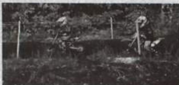
из спорткомплекса им. Кадирова г. Уфы, третьими – мотогонщики из Стерлитамака. К сожалению, кумертаусцы только седьмые. Зато есть, куда расти.

Соревнования по мотокроссу всегда пользуются большой популярностью у горожан. 11 сентября в Кумертау на трассе для мотокросса состоялся 10-й этап открытого Чемпионата Республики Башкортостан. В гонках приняли участие 14 команд из городов Башкирии и 5 – из городов других регионов России: Орск, Бузулук, Самара, Соль-Илецк, Трехгорный. Соревнования проводились в различных возрастных группах. По итогам 10-го этапа гонщики из Учалов заняли первое место. Вторыми стали спортсмены