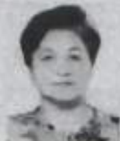
Муж, дети, внуки.

Ты, как всегда, полна забот, Всю жизнь даришь людям уют! Ах, сколько трудов, сколько дней По сердцу твоему прошли! Ты заслужила и жизнь радость, На мягкой диване уют и тепло, Так будь же счастлива, здорова И каждый день, и каждый год!