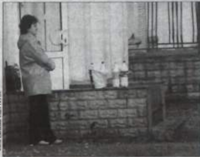
Для заражения бруцеллезом не обязательно пить молоко некипяченым. Достаточно его капли, попавшей на ранку или царапину при переливании продукта. Бактерии бруцеллы и туберкулез погибают только при длительном (более 15 минут) кипячении молока при температуре 100 градусов.

Анализатор молока «Клевер-2» позволяет быстро узнать жирность, кислотность и другие показатели качества молока (жирность, кстати, должна быть, согласно новым требованиям, 3,5% вместо прежних 3,2%). Обязательна и органолептическая оценка, после которой выдается разрешение на торговлю. Для тех, кто торгует на Центральном рынке, оно действительно лишь до конца дня, а тем, кто торгует на так называемых рынках одного дня, по согласованию с отделом торговли, разрешение выдается сроком на десять дней. «Почему-то количество желающих получить десятидневное разрешение уменьшилось, обращаются