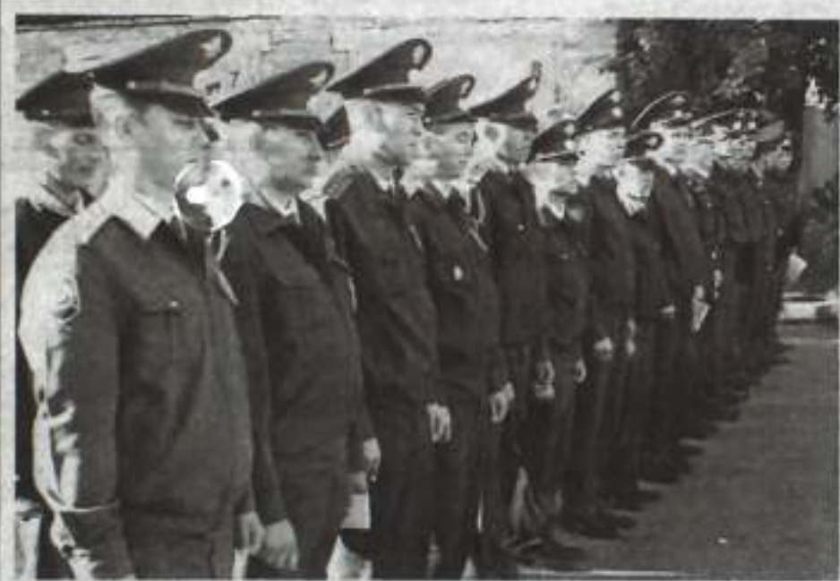
Инструктаж перед заступлением на службу.