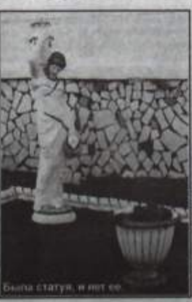
Была статуя, и вот ее.

В ночь на 6 сентября на ул. К. Маркса неизвестным хулиганом была разрушена статуя Афродиты, украшающая клумбу. Дело вовсе не в том, сколько она стоит, сколько усилий было потрачено работниками РЭУ на ее установку. Варвару, наверное, было плохо от того, что статуя радовала глаз других людей. У него, видимо, переизбыток энергии, и выплеснул он ее таким мерзким способом. Очень надеюсь, что сотрудники ОВД по г. Кумертау сделают все возможное, чтобы найти и наказать негодяя. Р. ЯМАНСАРОВ.