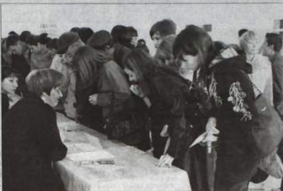
Более 200 молодых людей посетили ярмарку вакансий.

Для тех, кто хочет начать свое собственное дело,