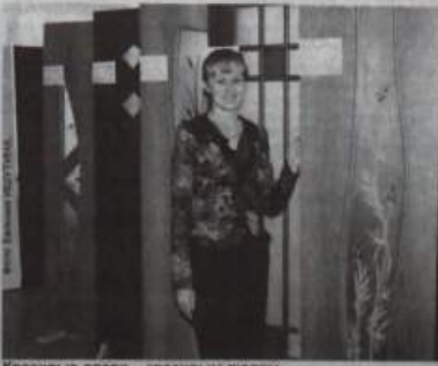
Красивые двери — красивым людям.

По материалам штаба ОВД по городу Кумертау подготовил Рафис ЯМАНСАРОВ.