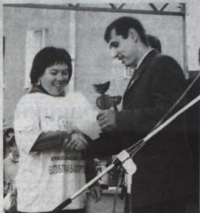
Гимназия №1 лидирует среди школьников.

В 2009 году город Кумертау занял призовые места в республиканском конкурсе «Масовость и мастерство» в комплексном зачете по итогам республиканских спортивных соревнований и фестивалей «Башкортостан спортивный». Наш город имеет славные традиции в лыжных гонках и тяжелой атлетике, в борьбе дзюдо, самбо и парашютном спорте. Яркое подтверждение тому – многочисленные побе-