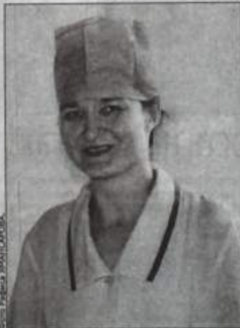
Фото Рафикова РАФИКОВА