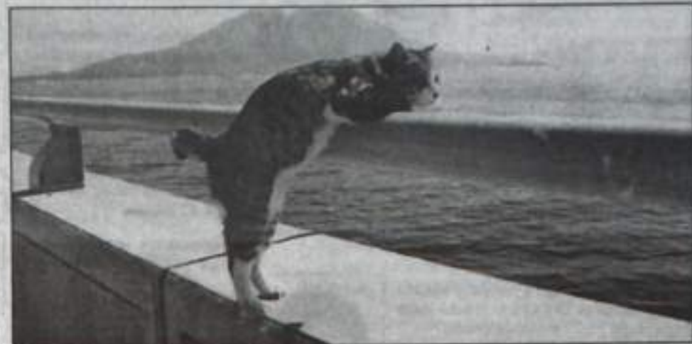
«Эх, свалить бы отсюда...»

отбора на фотоконкурс – неординарность. Ждем снимки с указанием имени автора и телефона по адресу: улица Комсомольская, 35, кабинет №4 или на электронную почту: vremia@ufamts.ru.