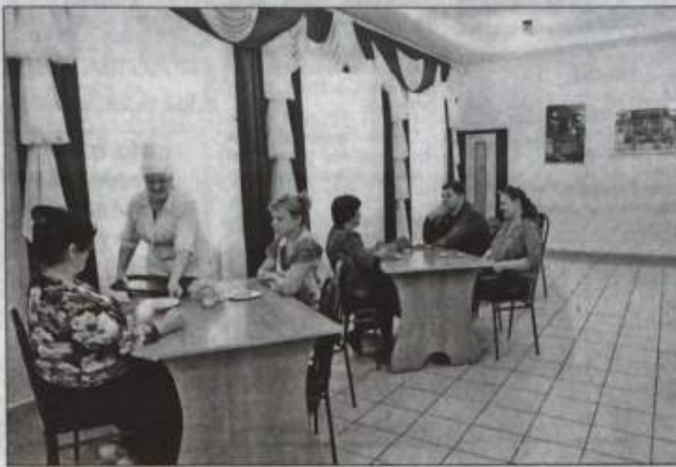
В комфортной обстановке и еда вкуснее!

Что касается цен. Недавно на свадьбе у племянника гуляла в «Березке», естественно, поинтересовалась у сестры, сколько за человека платили. В общем, они зака-