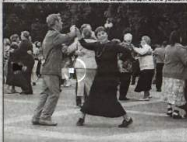
Осенний листопад закружит в вальсе.

Уважаемые горожане, молодые душой и сердцем! Ваши предложения услышаны. Думаю, скоро мы сможем вас порадовать. Следите за информацией и рекламой.