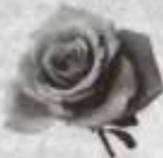
Брат, жена, дети, друзья.

60 – не мало и не много, В 60 открыта к мудрости дорога. Не беда, что мелькает года И волосы от времени седеют, Была бы душа молодая, А молодые души не стареют.