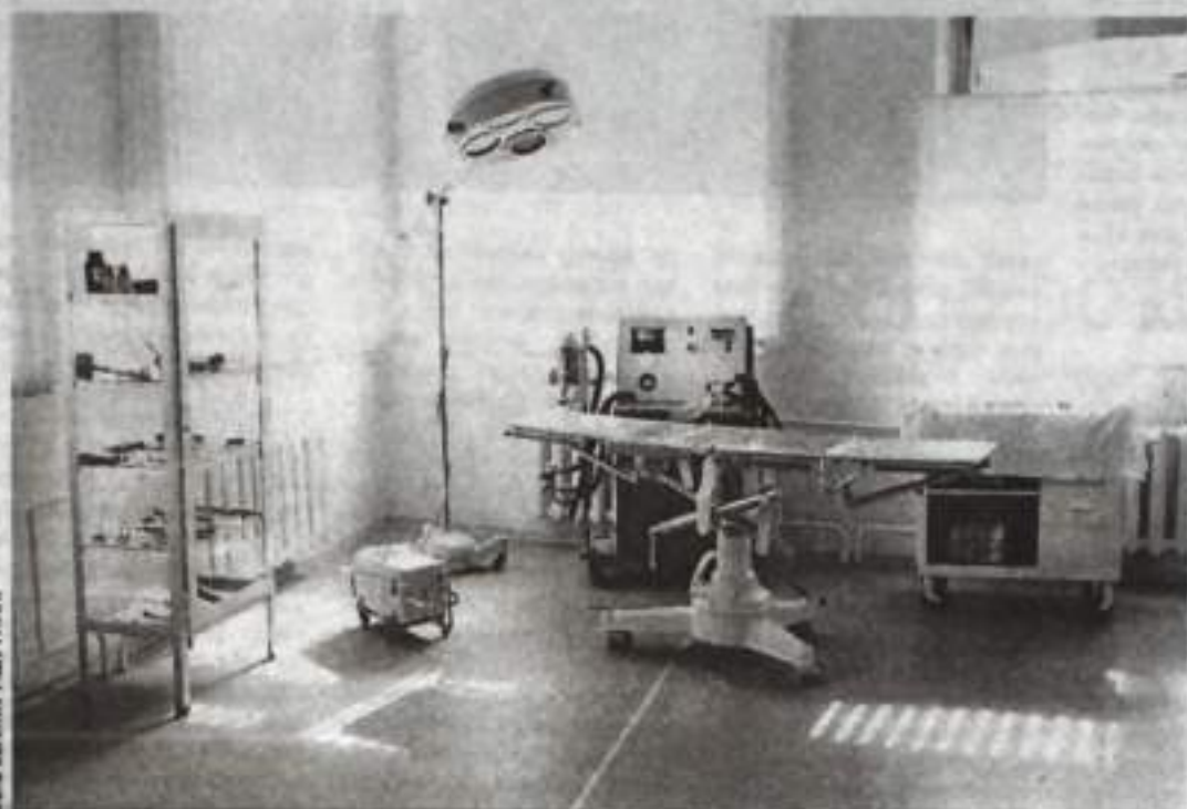
Музейный уклон: в такой операционной спасали людей кумертауские врачи лет 20 назад.

— С момента основания и до сегодняшнего дня больница развивалась: строились новые корпуса, обновлялось оборудование, внедрялись новые специальности и методики лечения. От самых истоков учреждение шло в ногу со временем, выполняя свою главную задачу — сохранение здоровья населения города и близлежащих районов. А юбилей, подкрепленный действительными успехами, знаменателен вдвойне. Успехи достигнуты благодаря врачам, медицинским сестрам, санитаркам, служащим и рабочим больницы. Во все времена самым главным нашим ак-