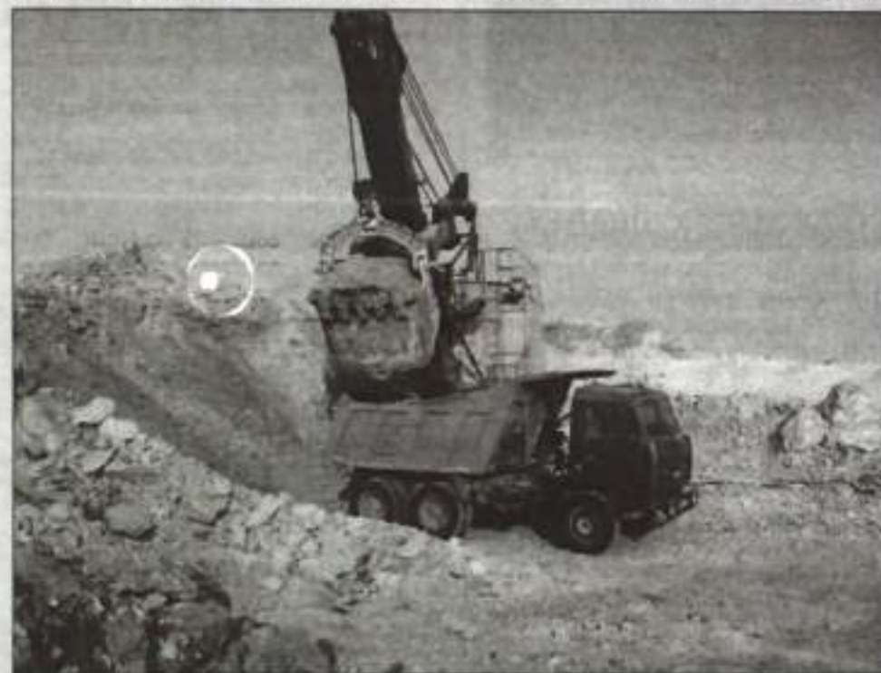
Добыча гипсового камня в карьере.

По материалам штаба Отдела МВД России по городу Кумертау подготовил Рамис ЯМАНСАРОВ.