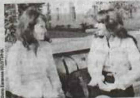
Приятно посидеть на скамейке, понежиться в ласковых лучах бабьего лета.

Бабье лето связывают с тем периодом в жизни крестьян, когда заканчивались полевые работы и женщины принимались за домашние дела. На Руси эти дни отмечались, как сельские праздники.