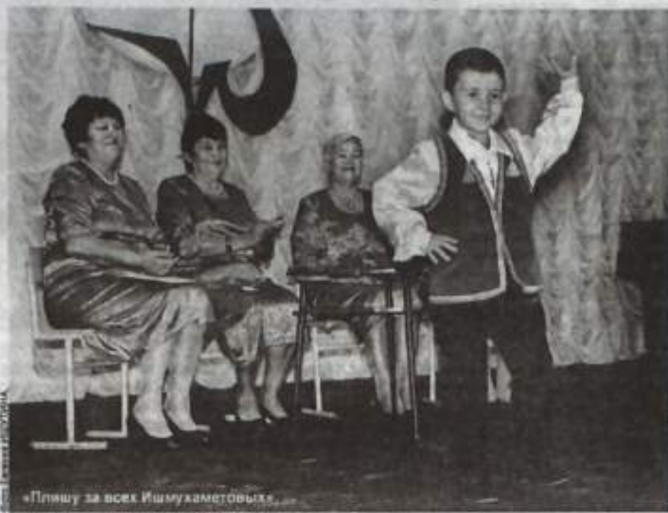
«Плещу за всех Ишмухаметовых!»