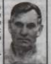
Жена, дочь, зять, внучка, правнук.