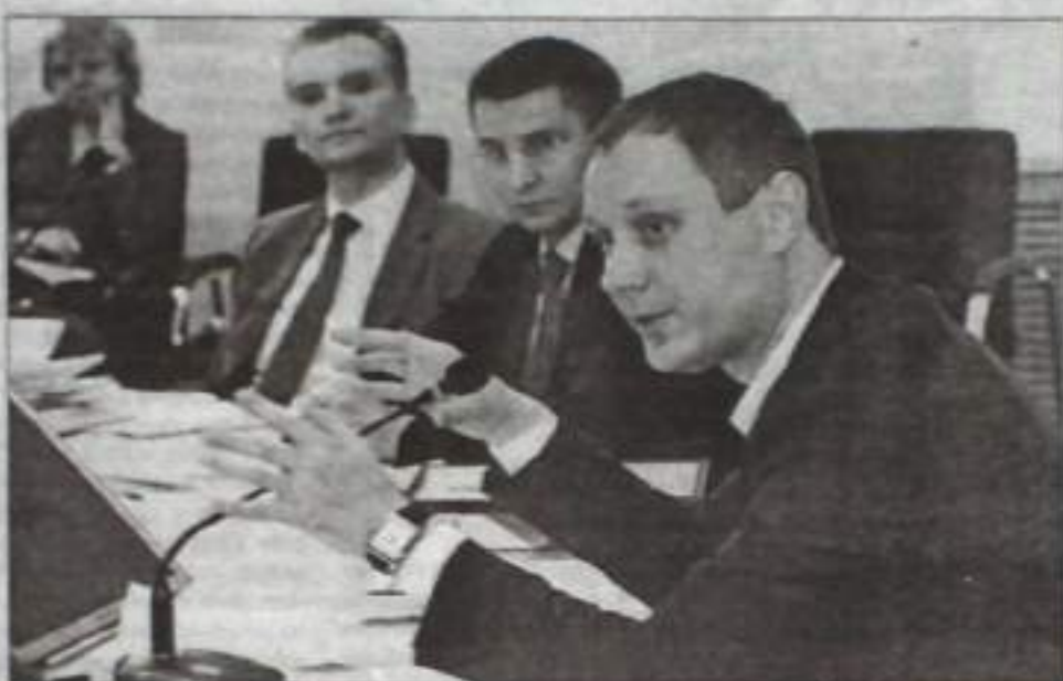
Министр Сергей Новиков рассказал об инвестиционном климате республики.

Первый заместитель министра земельных и имущественных отношений РБ Альмир Тазаев ознакомил с возможностями получения гарантий и поручительства Залогового фонда республики. Залоговый фонд – совокупность республиканского недвижимого имущества, сформированного в том числе для обеспече-