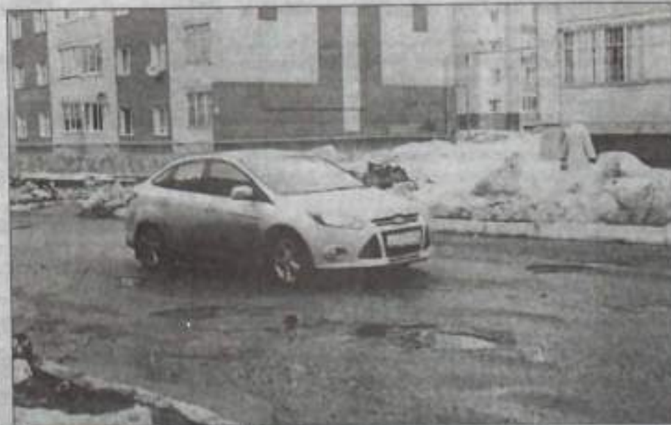
Из-за ям машина – на встречной полосе.

образуются ямы и выбоины, но этой весной их действительно очень много. Причин несколько. Первая: в этом году природа в пять раз более интенсивно испытывает дороги на прочность: если в обычные годы переходов температуры «через ноль» бывает около десяти, то этой весной их было уже около 60. Именно при колебании температуры в районе нуля происходит оттаивание снега и снова замерзание, что сказывается самым неблагоприятным образом на состоянии дорог. Ведь, когда вода замерзает, она увеличивает свой объем и с огромной силой давит на окружающий ее материал, в результате появляются трещины, колдобины и ямы. К тому же эта зима была многоснежной, сейчас происходит обильное таяние. Вода попадает в асфальт, ночью она замерзает и тем самым разрушает покрытие. Вторая причина, и, наверное, самая главная, – хронический недоремонт дорог. На те средства, которые нам ежегодно выделяются, мы можем выполнить лишь ямочные работы, а городские дороги уже давно нуждаются в капитальном ремонте. Срок эксплуатации верхнего слоя асфальтобетона не больше пяти-семи лет. По сути, все дороги нужно перекрыть раз в семь лет. Так что городским дорогам давно нужен капитальный ремонт, но на него в бюджете попросту нет денег. Поэто-