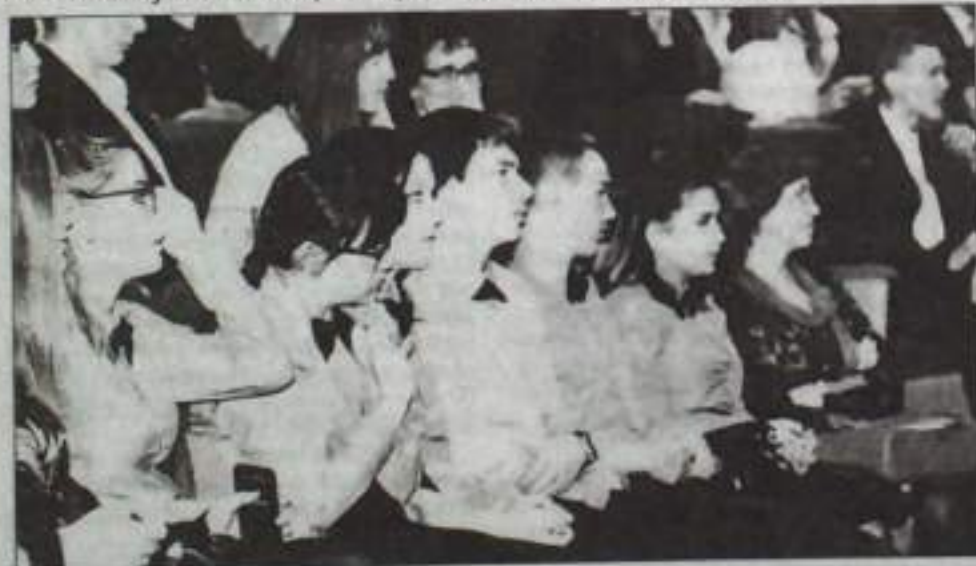
Команда школы №5 «Возрождение».

Состоялись полуфинальные встречи весеннего тура серии игр «Лиги школьников» интеллектуальной игры «Брейн-ринг» на кубок главы