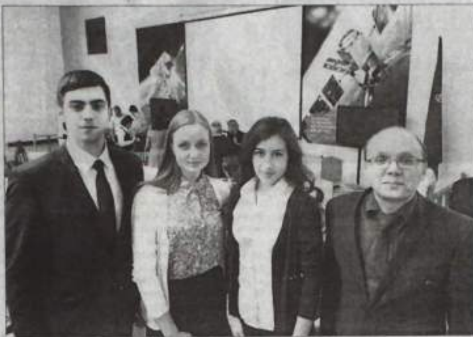
Представители филиала ОГУ на телемосте.

– Мы тоже отмечаем праздники, на нашу полугодовую экспедицию их выпало четыре. В такие дни мы просто меньше работаем, и у