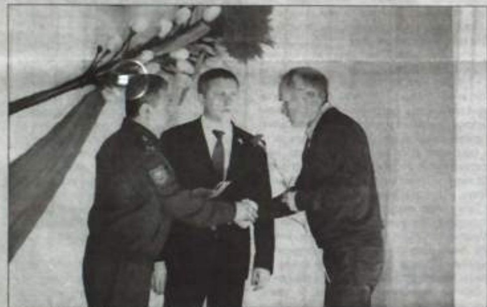
Вручение юбилейных медалей.

руководители предприятий и организаций города, школьники. Организовали мероприятия сотрудники МГЦ «Самозащита».