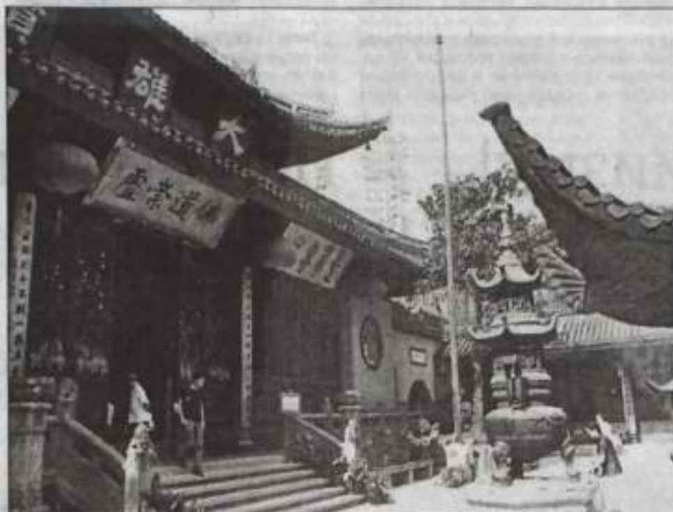
Город Цзиндзюань – мировая столица фарфора.