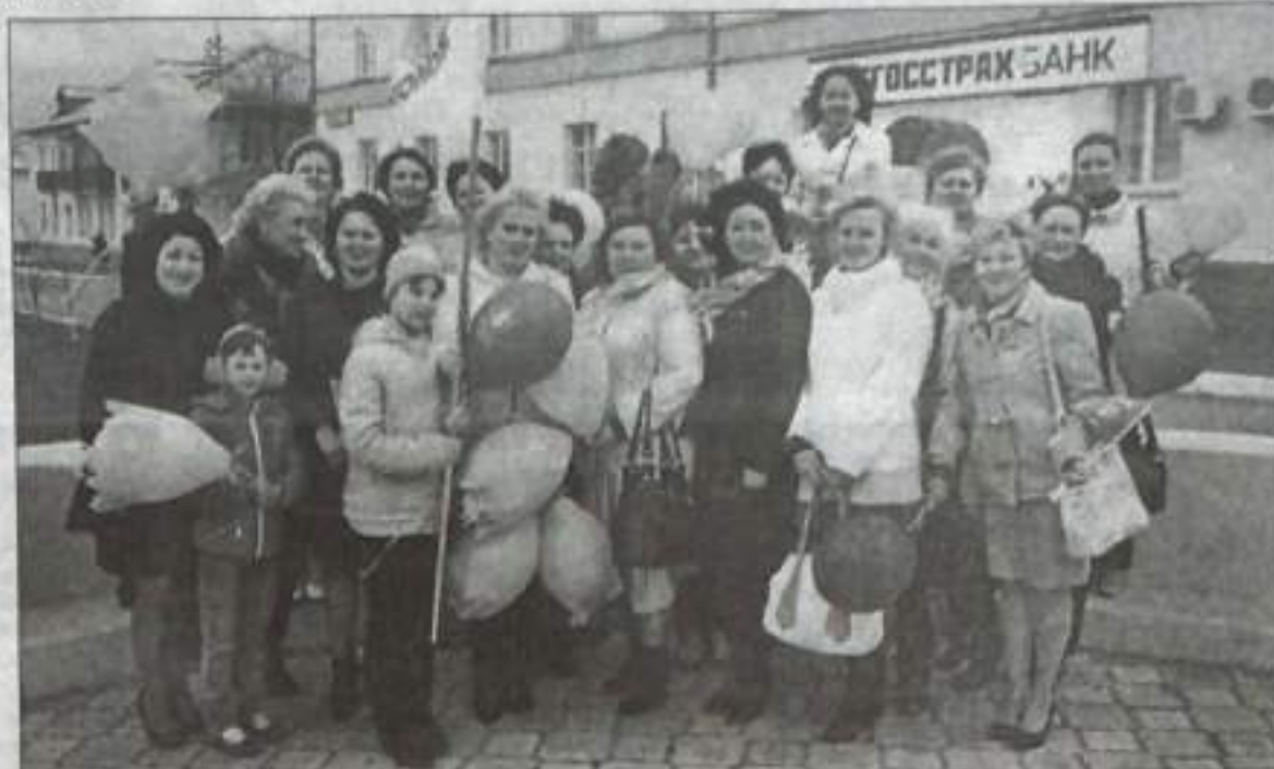
В 2014 году коллектив занял первое место в первомайском шествии, посвященном Празднику Весны и Труда.

Воспитатели детсада находят дорожку в душу каждого ребенка, повара стараются угостить вкусной и полезной едой, музыкальный руководитель – раскрыть творческий потенциал, и каждый, кто работает в «Колокольчике», вкладывает частичку своей души в любимую работу. Результатом слаженного добросовестного труда являются многочисленные благодар-