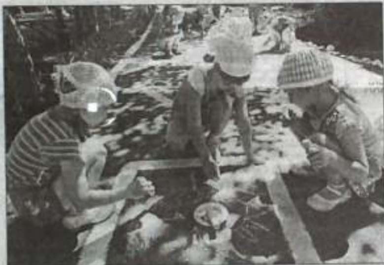
Кто рисует лучше?