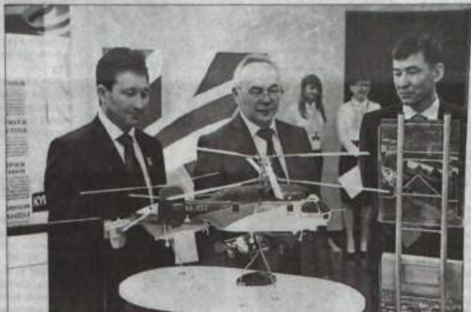
Кумертауские вертолеты – бренд города.