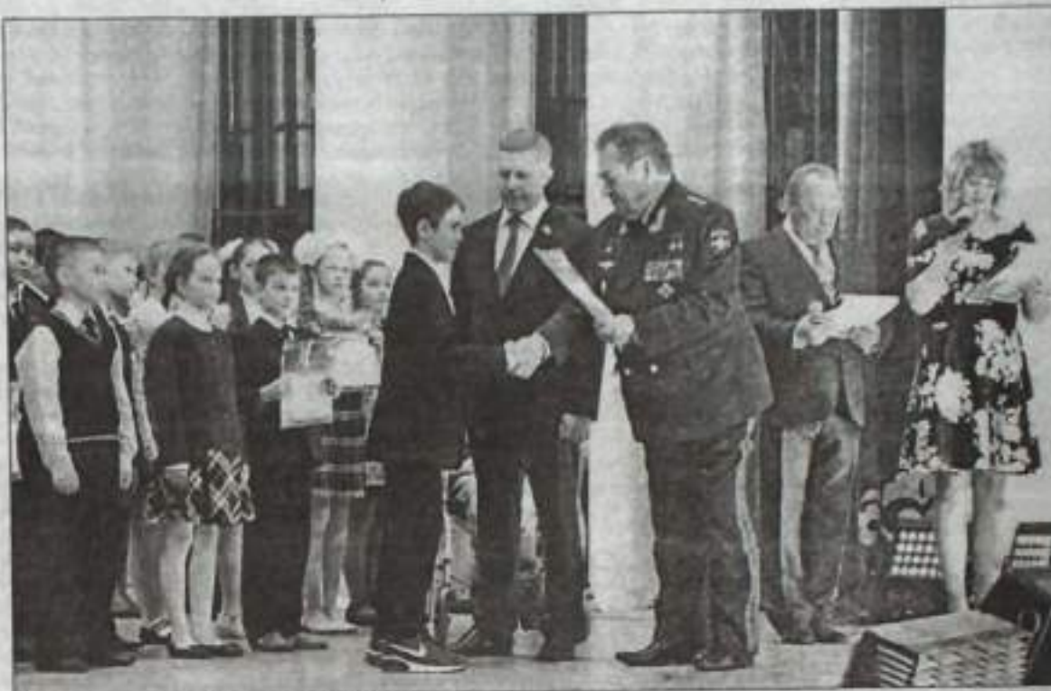
Награда из рук выдающегося космонавта.