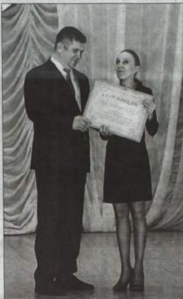
Подарок от города.

Танец — поэма. В нем каждое движение — слово. Мата Хари.