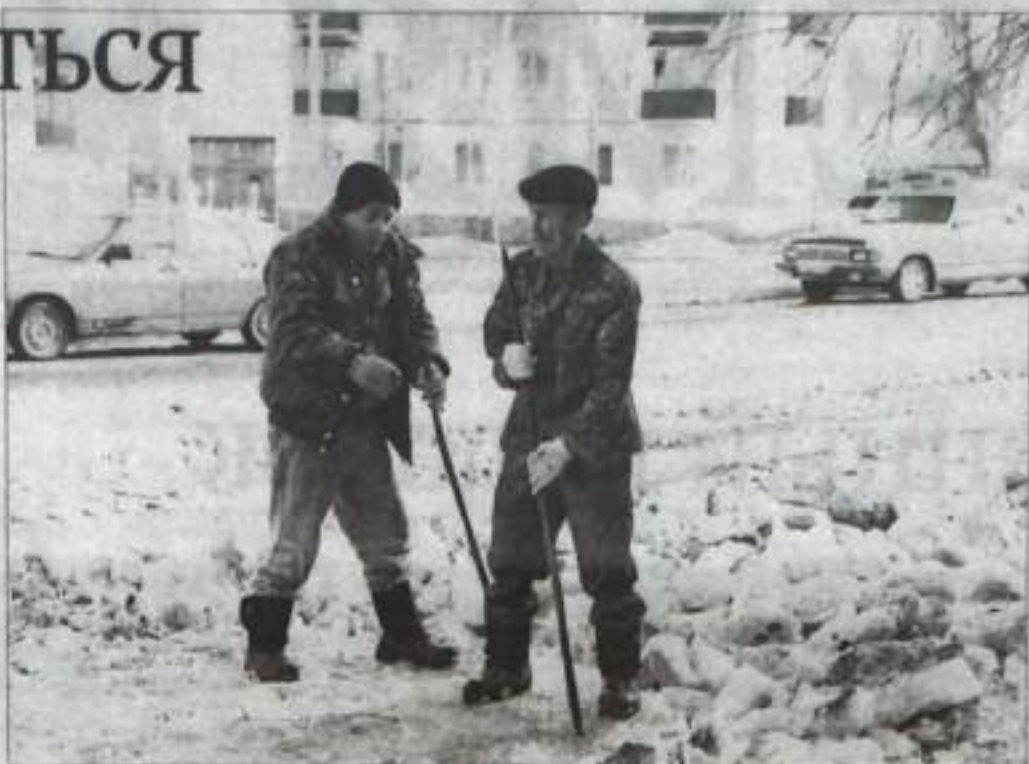
Работники КИЭП на уборке территории от снега.