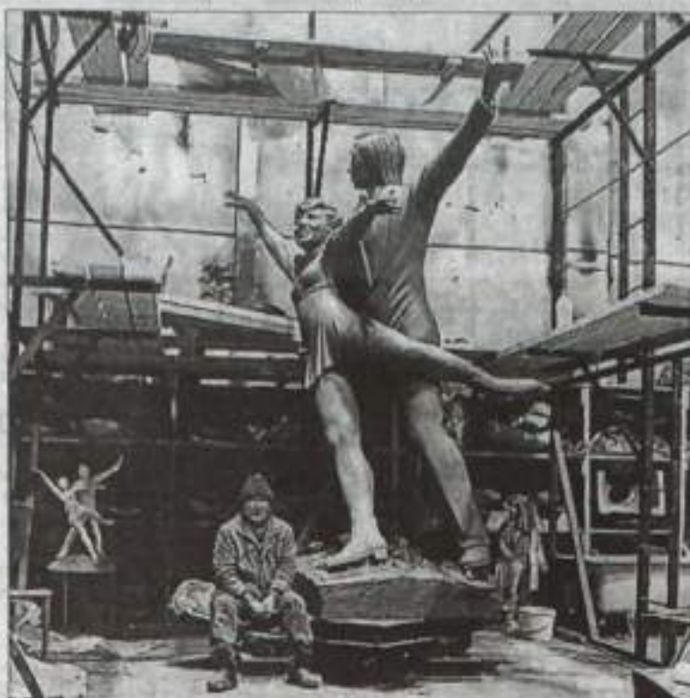
Скульптор в мастерской.