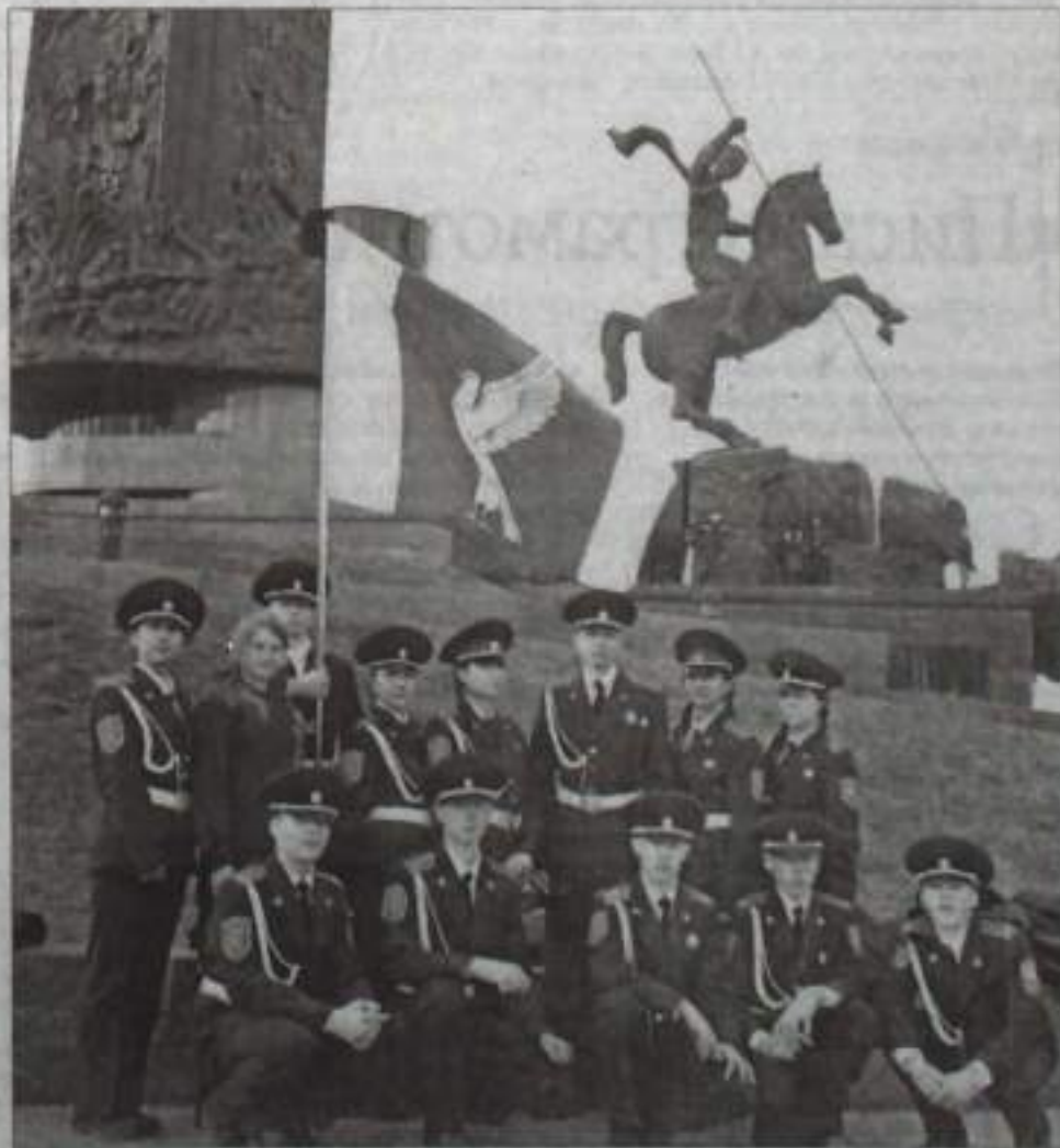
Кумертауские кадеты в Москве.