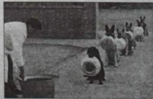
Кормёжка, кормёжка! Готовь к обеду пшошки!

7. Правило оптимизма. Пока мы ругаем жизнь, она проходит мимо. Глаза видят, ноги ходят, уши слышат, сердце работает, Душа радуется. Мой фитнес – солнечное лето, луг и речка. Пока я двигаюсь, пока ветер овеивает кожу – я живу. Когда я смотрю телевизор, лека на диване, или общаюсь с френдами в инете – я не в этом, а в потустороннем мире.