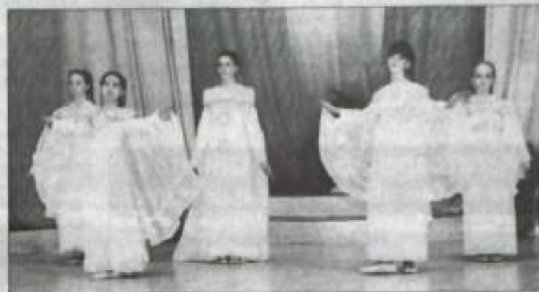
Гран-при – коллекция «Белым платом, крылом белым», театр моды «Орхидея» села Илек.

Каждый год наряду с постоянными участниками появляются новинки. В этом году мы приветствовали дебютантов фестиваля-конкурса из Благовещенска, Уфы и Уфимского района. Конечно же, мы были рады встрече с коллективом, ставшим уже друзьями фестиваля. В нынешнем празднике моды приняли участие 34 коллектива из 13 городов и районов республики и села Илек Оренбургской области.