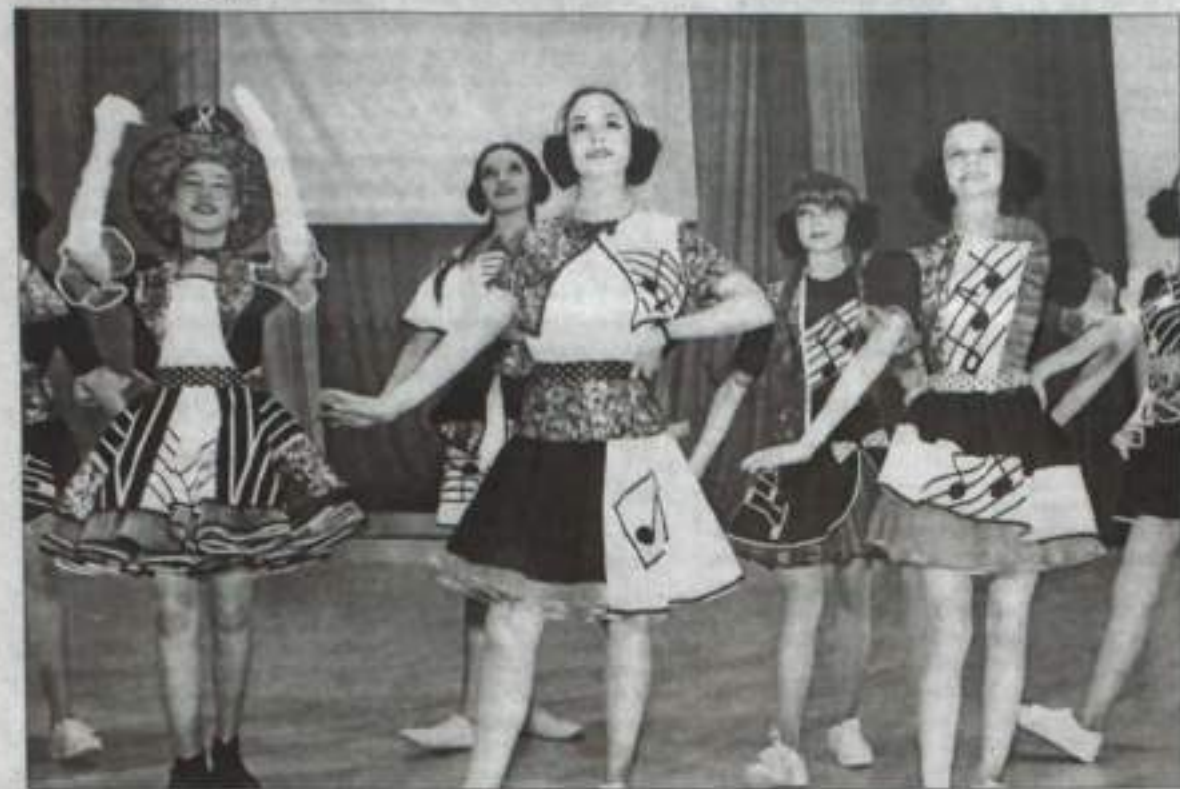
Кумертауская коллекция «Вдохновение в ре мажоре» завоевала первое место.

В Центре детского творчества в шестой раз состоялся открытый республиканский фестиваль-конкурс театров детско-юношеской моды «Планета красоты»