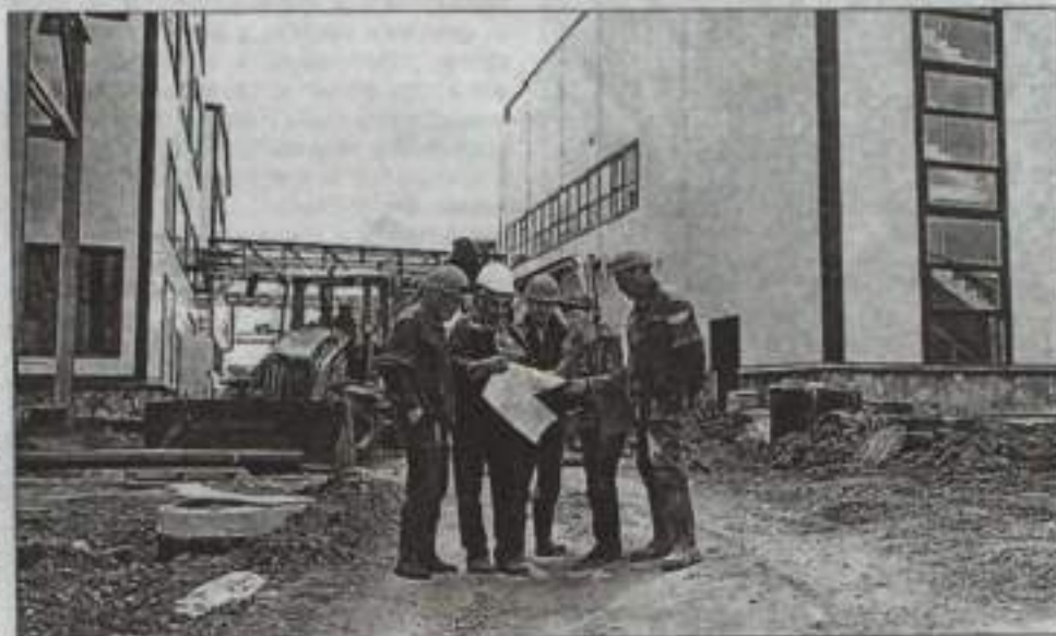
2 стр. <img alt="Arrow icon"/>

Всего же в список моногородов включены шесть территорий Башкирии: кроме двух уже названных, еще Нефтекамск, Белорецк, Благовещенск и Учалы. Однако для получения особого статуса Фонд выбрал лишь два — Белебей и Кумертау, которые уже сотрудничают с ФРМ. Причем наиболее успешно идут дела по выводу города из сложной ситуации, по мнению главы минэкономразвития республики Сергея Новикова, в Кумертау.