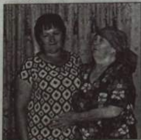
«Это моя Оленька!»

Напомним, что участником розыгрыша может стать каждый, кто подписался на газету «Кумертауское время» не менее чем на полгода и принес копию квитанции в редакцию по адресу: улица Комсомольская, 35, кабинет №9. Справки по телефону 4-48-86.