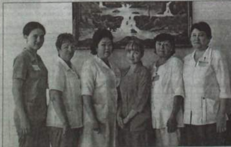
Вот она – преемственность поколений.