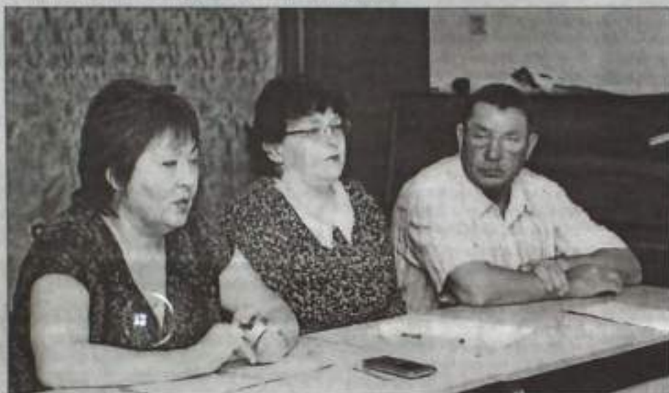
В селе Ире активисты решили разрабатывать проект спортивной площадки.

Прошли первые собрания членов товарищества собственников жилья дома №19 «а» по улице Энергетиков и территориальной организации самоуправления «ИРА» по вопросам участия в Программе поддержки местных инициатив.