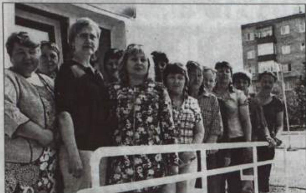
У парадного крыльца.