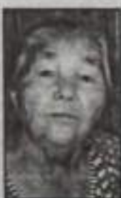
Муж, дети, внуки.

Уходит из жизни хорошие люди, Как будто уснула, забыла обо всем, Но далеко звучать в нашей памяти будет Заночный галос и ласковый смех. Вчера говорила: «Нам надо собраться, Вчера открывала нам дверь на звонок, Вчера ты так мило могла улыбаться, Сегодня твой голос навеки умолк. Вспомните все, кто знал нашу маму, ба- бушку, и помяните добрым словом».