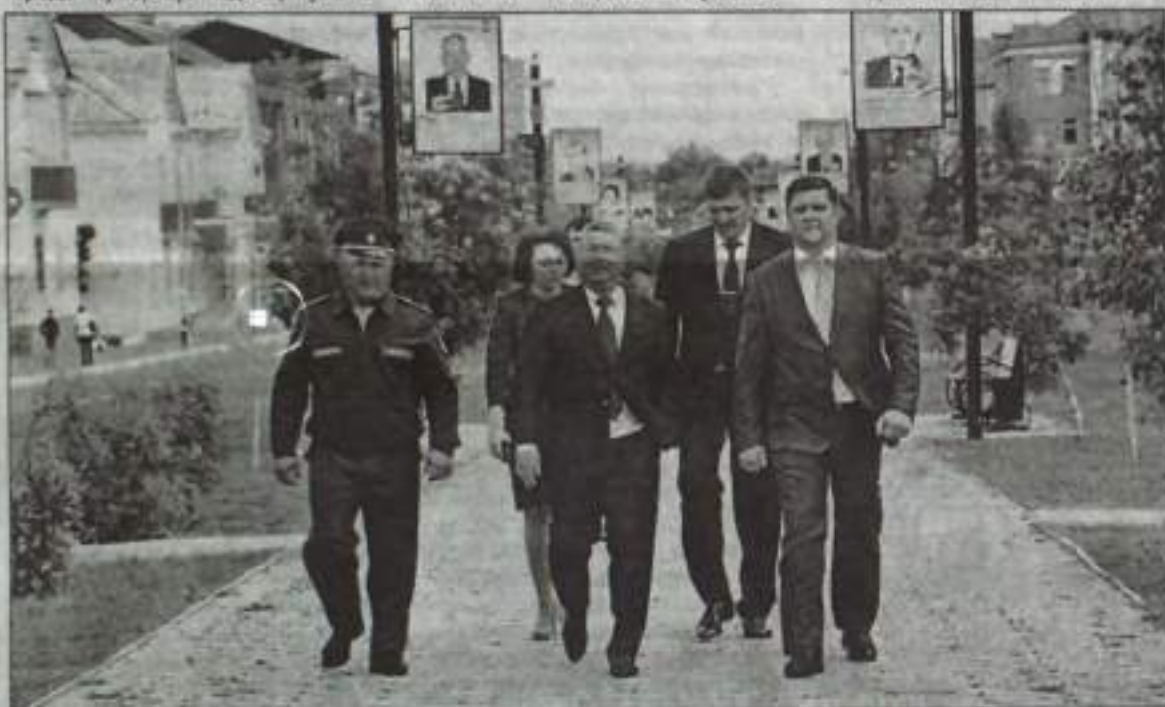
Высокие гости и козлева встречи прошлись по городской аллее Славы и Почета.