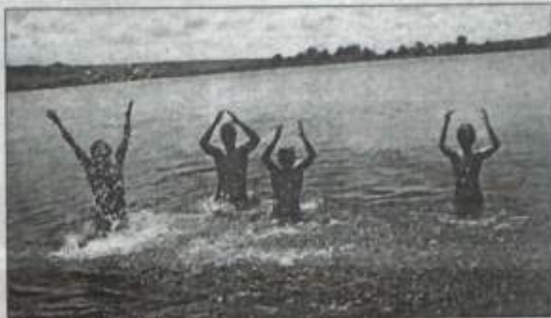
А теперь – купаться!

– Матерился, – пояснила она. – У нас такое правило в команде, кто матерится, тот расплачивается день-