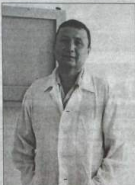
Высокую награду заслужил.