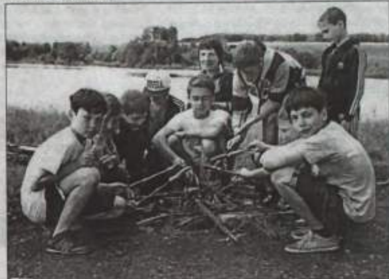
А костер не хотел разгораться.