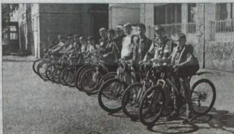
Построение возле «Маяка».

Следует упомянуть тот факт, что последний раз я на велосипед садилась лет тридцать назад. Хотя и говорят, что навык езды на велосипеде забыть невозможно, но у меня он был применительно утренних. Я даже забыла, как на него садиться, и упорно нучилась первое время, закидывая ногу через раму вперед. Да и ездил я когда-то на донорическом «Школьник», который по сравнению с современными