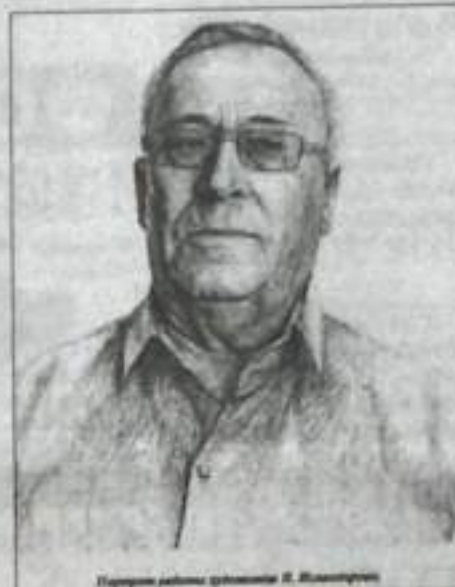
Портрет писателя Закира Акберова