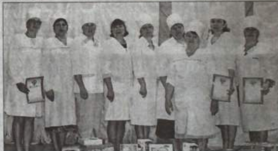
Участницы конкурса «Медсестра года».

В Кумертауском ПНИ села Мачного большое внимание оказывается развитию медицинского обслуживания, спорту, культуре, трудотерапии, воспитанию медицинских кадров и повышению их профессионального мастерства.