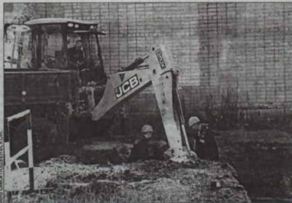
Ремонт трубопровода по улице Гафури.

По результатам испытаний выявлено 37 повреждений, из которых на сегодняшний день устранено 25, что составляет 68 процентов от общего количества. В целом, на ремонтную кампанию 2016 года запланировали провести капитальный ремонт тепловых сетей центрального отопления и горячего водоснабжения протяженностью 4,65 км в двухтрубном исчислении, или 5 процентов от общей протяженности тепловых сетей. Часть мероприятий по капитальному ремонту выполнен; проведена конкурсная процедура закупки труб и элементов трубопроводов в пенополиуретановой изоляции, а подрядная организация ООО «Шихан-Сервис» завершил