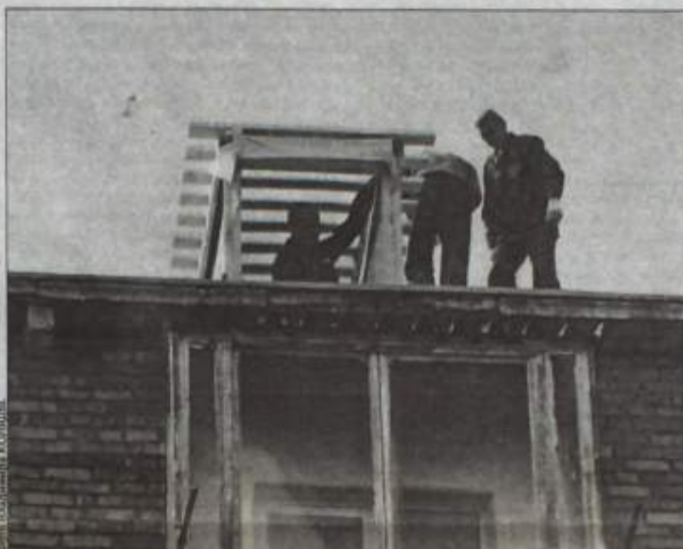
Ремонт крыши дома по улице К.Маркса.

Ремонтные работы идут полным ходом, и на сегодняшний день процент выполнения работ общего имущества в многоквартирных домах составляет около 30 процентов. Напомним, в 2015 году было капитально отремонтировано 34 дома на общую сумму 77849,3 тысячи рублей. Тогда, в отличие от нынешнего года, на ремонт домов выделялись средства как из фонда содействия реформированию жилищно-коммунального