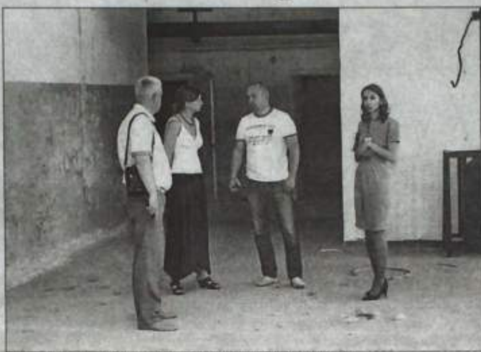
Инвесторы осмотрели имеющиеся свободные площадки в городе.