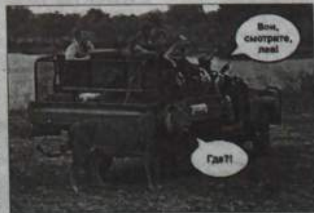
Вон, смотрите, лад!