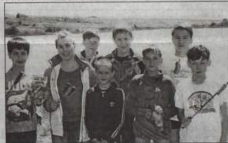
Вот и всё. Лагерный день подходит к концу.

гани. Помогает. Потом мы эти деньги разыгрываем с помощью спичек. Кто короткую выпянет – тону и достанутся.