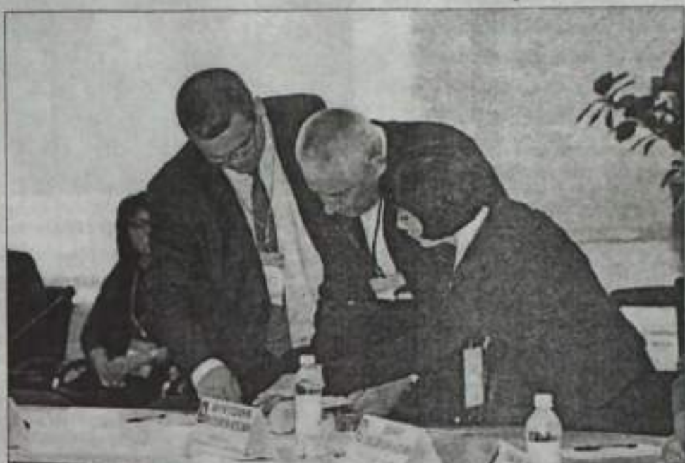
Участники семинара за обсуждением вопросов.

последними новостями жизни города. Он отметил, что 18 марта Кумертау стал на шаг ближе к большим экономическим переменам в Москве на заседании комиссии по вопросам создания и функционирования Территории опережающего социально-экономического развития на территориях монопрофильных муниципальных образований Российской Федерации под