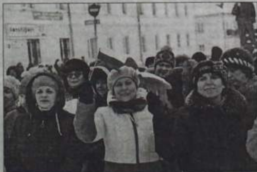
Жители пришли на митинг в приподнятом настроении.

Площадь Угальдиных вечером 18 марта была разукрашена флагами «Единой России», здесь звучали искренние слова поддержки в адрес наших новых соотечественников – крымчан. Как и по всей стране, у нас был организован митинг-концерт, посвященный второй годовщине присоединения Крыма к России. Представители региональных отделений политических партий, трудовых коллективов и жители города выразили свою поддержку историческому решению, принятому в результате референдума в Крыму, который прошел 16 марта 2014 года, когда жители полуострова высказались за воссоединение с Россией.