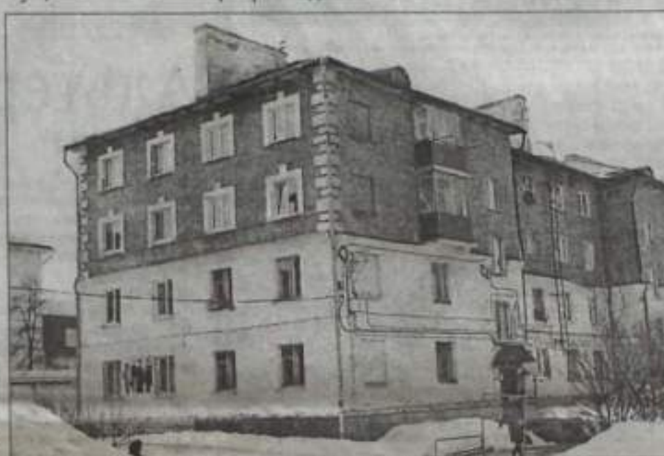
В текущем году Региональный оператор гарантирует проведение капремонта общедомового имущества 27 домов города, в том числе будет отремонтирован и дом №20 по улице К.Маркса.