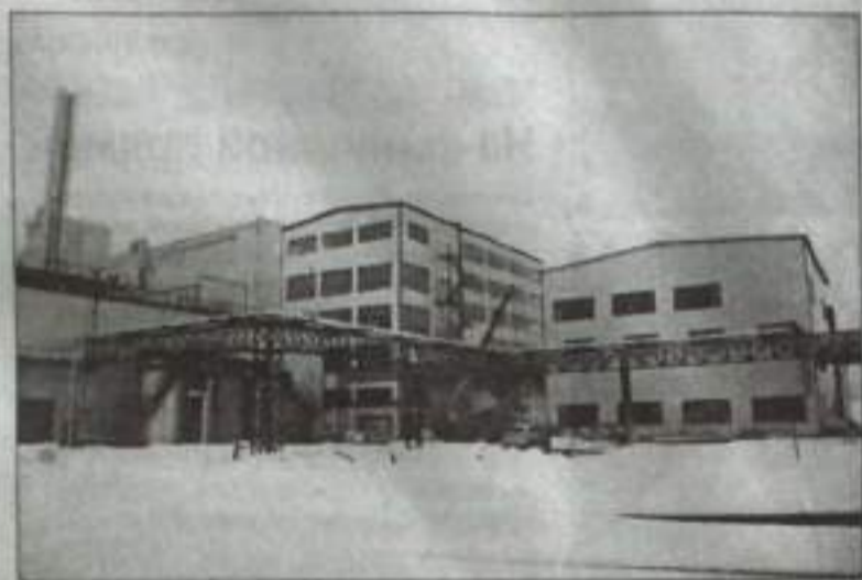
Основные корпуса маслоэкстракционного завода уже возведены.