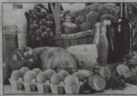
воспользоваться моментом, обучение в автошколе подешевело на четыре процента.

Зато сейчас тем, кто решил получить права, стоит