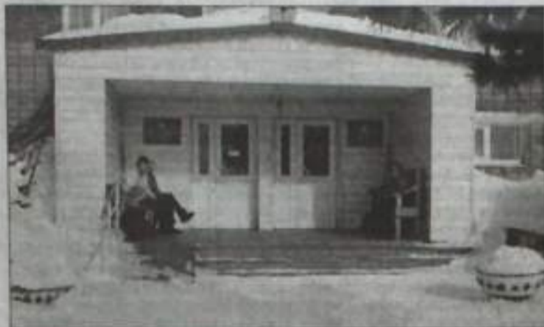
Ждём весны у парадного входа.

«Все в доме №2 поражало глаз своей чрезмерной скромностью: и мебельровка, состоявшая исключительно из садовых скамеек, привезенных с Александровского, ныне имени Пролетарских Субботников, бульвара, и базарные керосиновые лампочки, и сами одевла с пугающим словом «Ноги». Этот отрывок из бессмертных мифо-ветровских «12 стульев», описывающих быт дома престарелых дальних коловских времён, прокручивался в голове по пути в деревню Свободу Куоргазинского района. Именно здесь находится отделение стационарного социального обслуживания граждан пожилого возраста и инвалидов, проще говоря, дом престарелых.