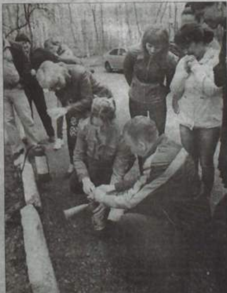
В реабилитационном центре регулярно проводятся обучающие мероприятия для персонала.

электроустановок и оборудования, надежность всех ограждающих устройств на оборудовании, правильность складирования материалов и инструментов. Все перечисленные мероприятия и, соответственно, порядок их про-