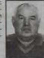
Жена, дети, внуки.

Из жизни ушёл ты внезапно, Оставив нам боль навсегда. Но светлый образ твой родной Мы будем помнить постоянно. С нами ты будешь всегда, Паним, любим и скорбим.