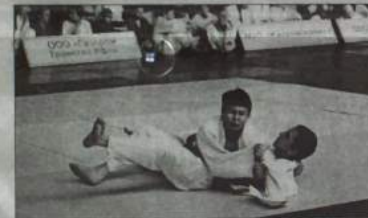
Турнир был насыщен зрелищными моментами.