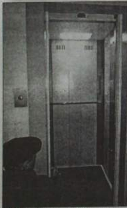
И антивандальный лифт нуждается в работе.