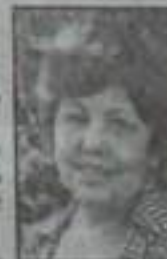
Дети и внуки.