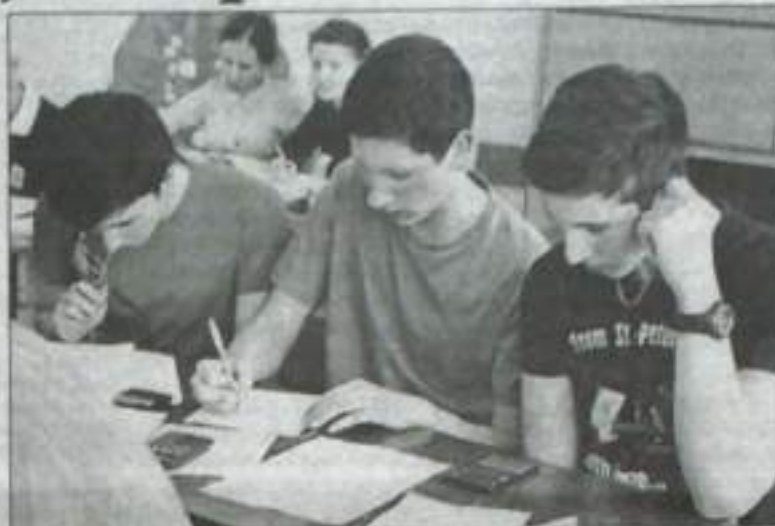
Команда гимназии №1, ставшая обладателем кубка города по физике.

Сразу хочу отметить, что он уделяет много времени не только подготовке к кубку, но и к единому государственному экзамену, который в скором времени не только этим трем парням, но и всем выпускникам города предстоит сдать. Я поинтересовалась у ребят, в чем секрет их победы? «Самое главное, альтруистский подход, любовь к тому, чем ты занимаешься, и всё будет, как нужно. Мы пытались вы-