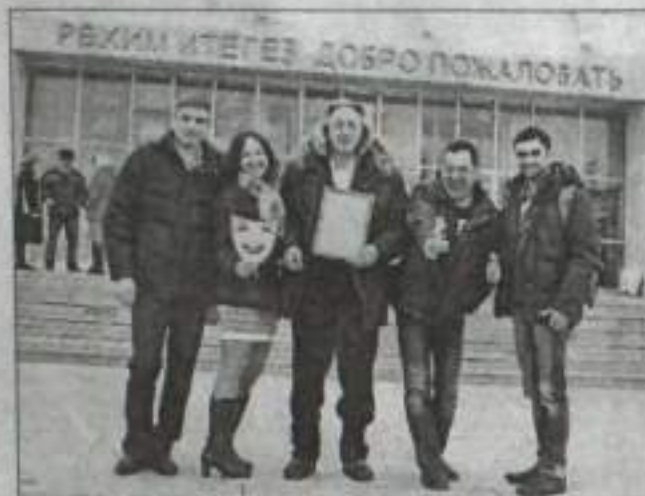
Коллектив театрального движения «Ананас» с заслуженной наградой.