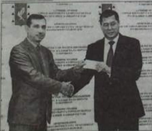
Момент вручения удостоверения.