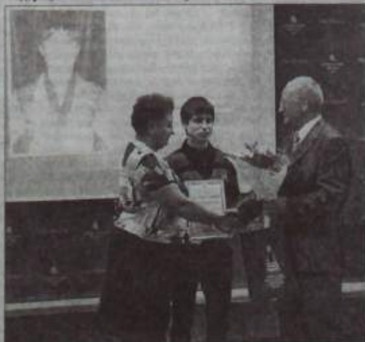
Директор филиала благодарит родителей за достойное воспитание детей.

В Кумертауском филиале Оренбургского государственного университета состоялось заседание ученого совета, на котором были вручены сертификаты на стипендии Правительства Российской Федерации и именные стипендии ученого совета.