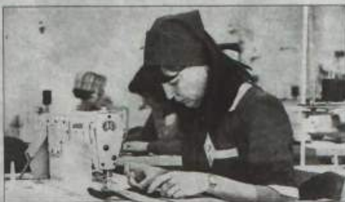
Скоро одной из самых востребованных профессий будет швея.

Представители учреждений высшего и профессионального образования представили подробный анализ проблемных вопросов приемных комиссий. В частности, это минимальное количество учащихся, сдающих физику и информатику, не все учащиеся выбирают профильную