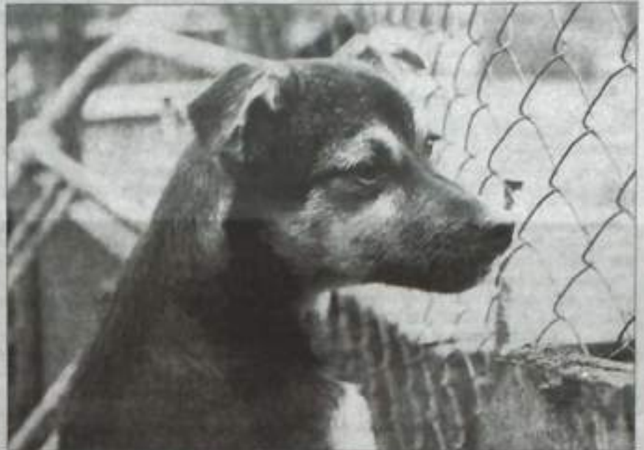
Таск: в день нашего визита эта маленькая собачка, с преданными глазами, обрела хозяина.