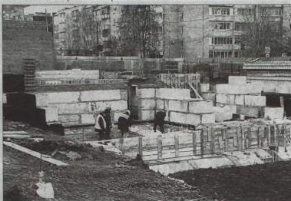
На улице Комсомольской будет новая высота.