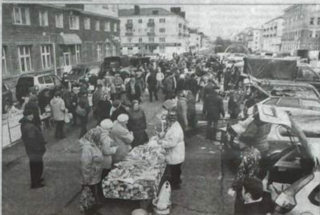
В этот день на ярмарке было продано продукции на 1,8 млн. рублей.