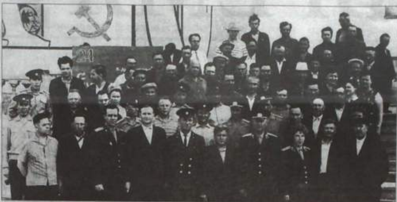
Члены городской добровольной народной дружины перед выходом на дежурство.

В 1965 году в республике происходят административные преобразования, связанные с укрупнением территорий. Тогда и был образован новый Кумертауский район. В связи с чем отдел милиции ре-