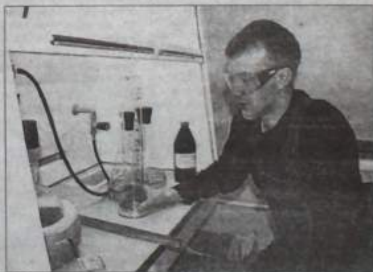
О том, что перспективы филиала АО «Энергоконтакт» неплохие, свидетельствует и залуженная на днях химическая лаборатория для определения межкристаллитной коррозии металла.

Напомним, этот контактный завод специализируется на выполнении научно-исследовательских и опытно-конструкторских работ, производит оснастку для наземной отработки и испытания ракетно-космической техники, выпускает наземно-стендовое оборудование для статических, динамических, электрических и огневых испытаний ракетноносителей. Поскольку текущий кризис коснулся и космической отрасли, заказы заводу резко снизились. У предприятия появились трудности: произошло некоторое сокращение штатов, была заморожена стройка нового цеха. Тогда руководство приняло разумное решение – достичь нового уровня рыночной гибкости путем