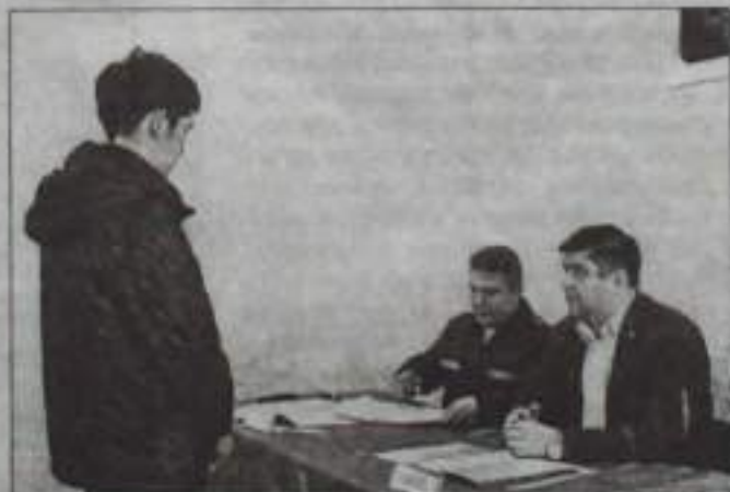
«На заседании призывной комиссии прибыли»