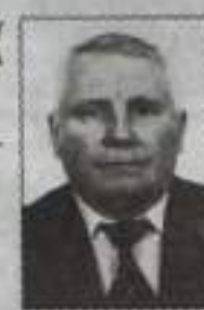
Жена, дети и внуки.

Это мудрость и жизнь расцвет, И не место для грусти, печали, Впереди еще множество лет. Ты достиг уже многого в жизни: И семья, и карьера, мечты – Все сложилось удачно и честно Для такого труда, как ты. Пусть здоровье крепчает, и только! Улучшают пускай жизнь успехи. Есть для гордости повод, поскольку Тебя любят жена, внуки, дети!