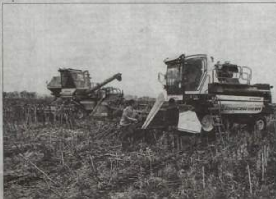
Обиолот подсолнечника ведет техника, купленная этим летом.

озимых культур, и уже практически поля готовы к весеннему севу. На 450 гектарах посеяли пшеницу и всего на 50 – рожь, поскольку в последнее время на нее упал спрос. А вот под гречиху в планах у хозяйства увеличить посевные площади до 300 гектаров. По предварительным подсчетам, на рынке в будущем году на нее будет спрос, ведь эта нежная культура летом полностью сторепа под палящим солнцем. Дунают выделить площади также под лен и многолетние травы, цены на которые довольно высокие. Хозяйство еще раз решило все просчитать и изучить спрос. А как перспективное направ-