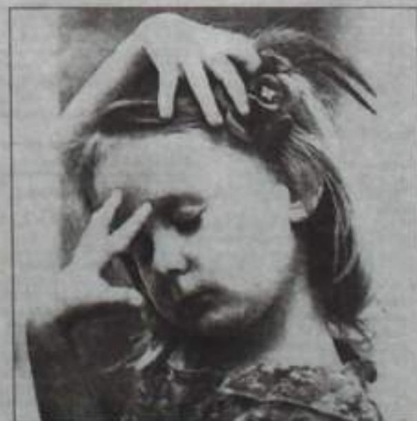
Такая непостоянная... То слоку с ума, то слоку с ума!